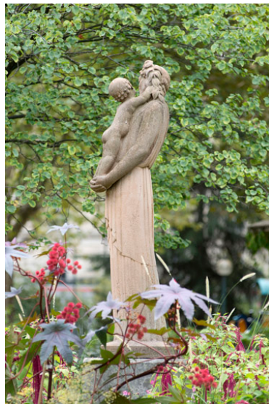
Vue du profil gauche de la statue. IVR11_20157500289NUC4A