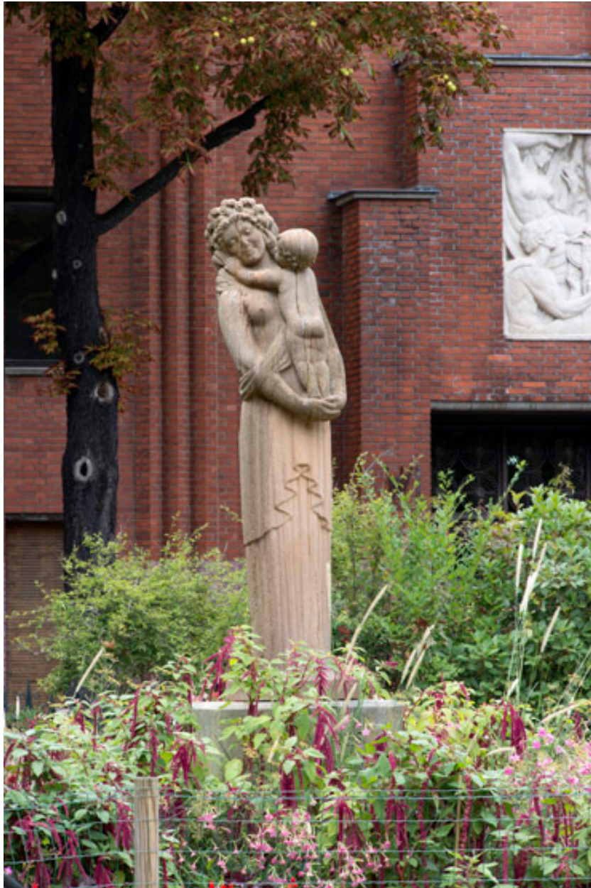
Vue de face de la statue.