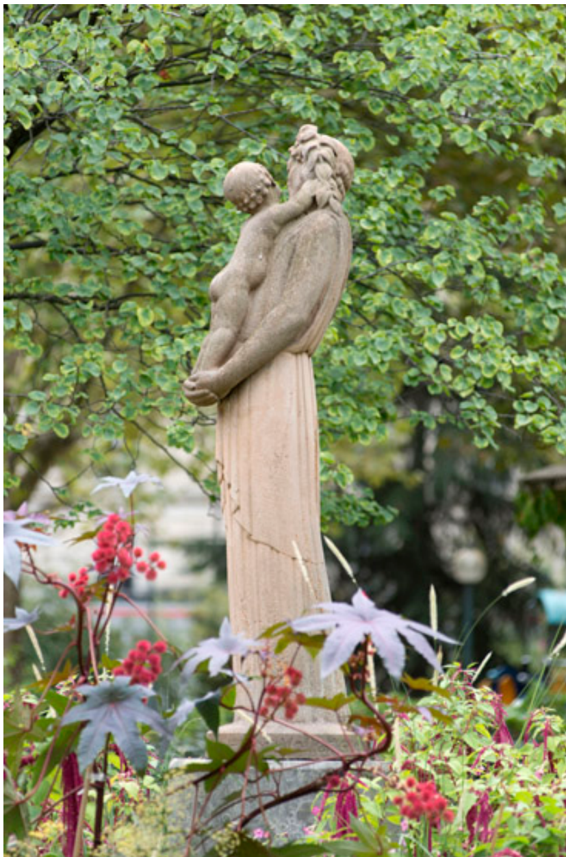
Vue du profil gauche de la statue.