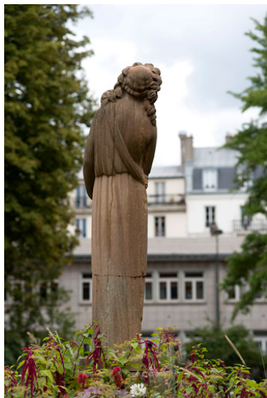
Vue ddu revers de la statue. IVR11_20157500291NUC4A