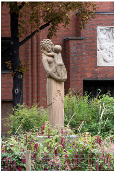
Vue de face de la statue.