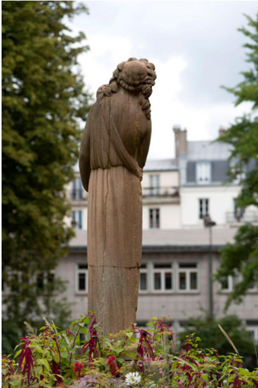
Vue ddu revers de la statue.