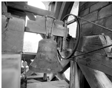
Vue d'ensemble. IVR11_20029101146X