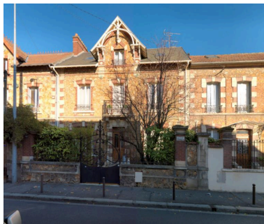
Vue de la façade principale et de la ferronnerie du portail.

IVR11_20167800720NUC4A