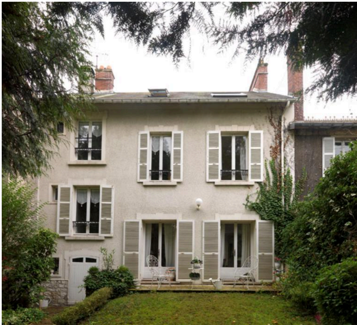
Façade sur jardin.