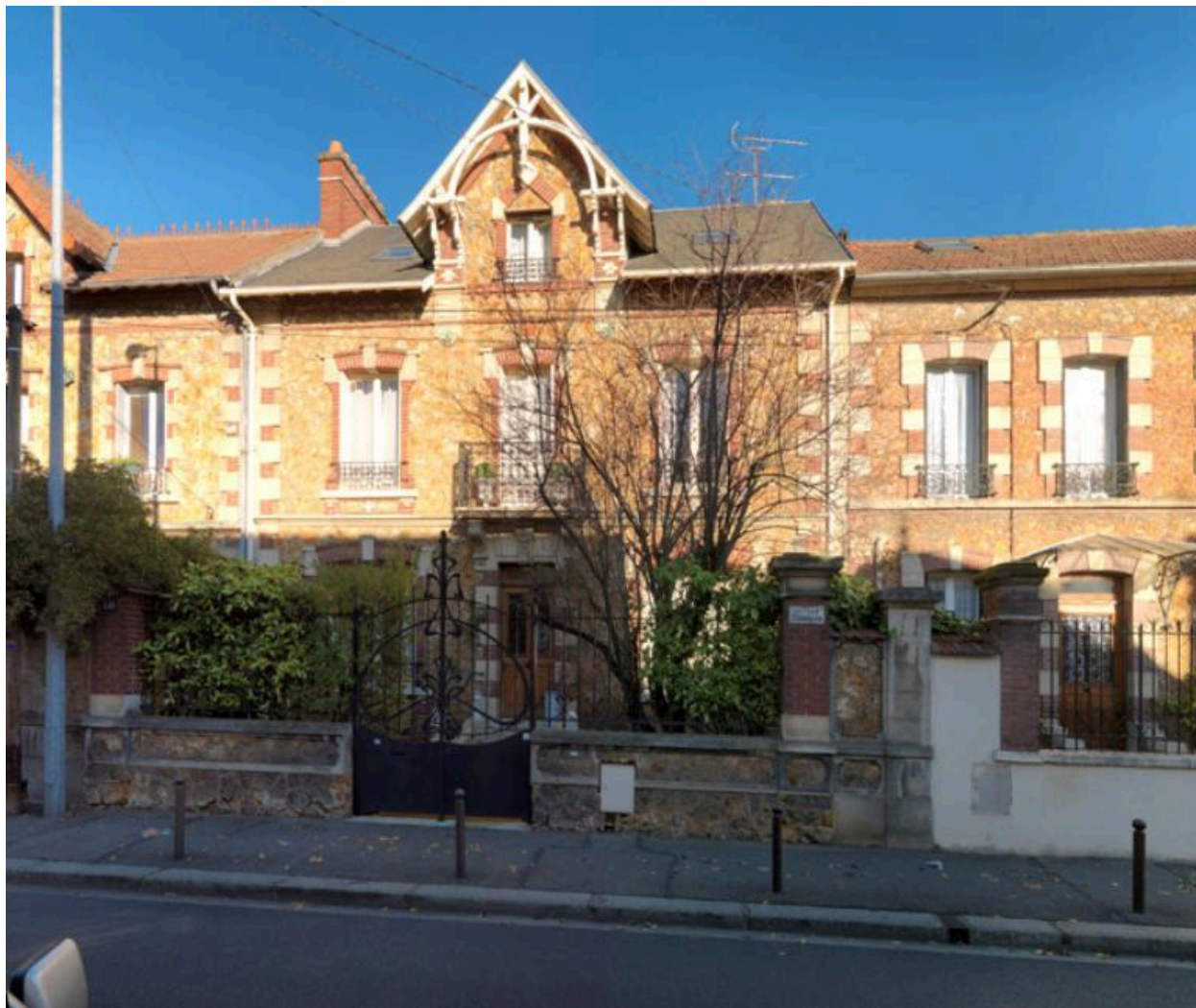
Vue de la façade principale et de la ferronnerie du portail.