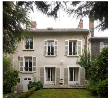
Façade sur jardin.

IVR11_20167800758NUC4A