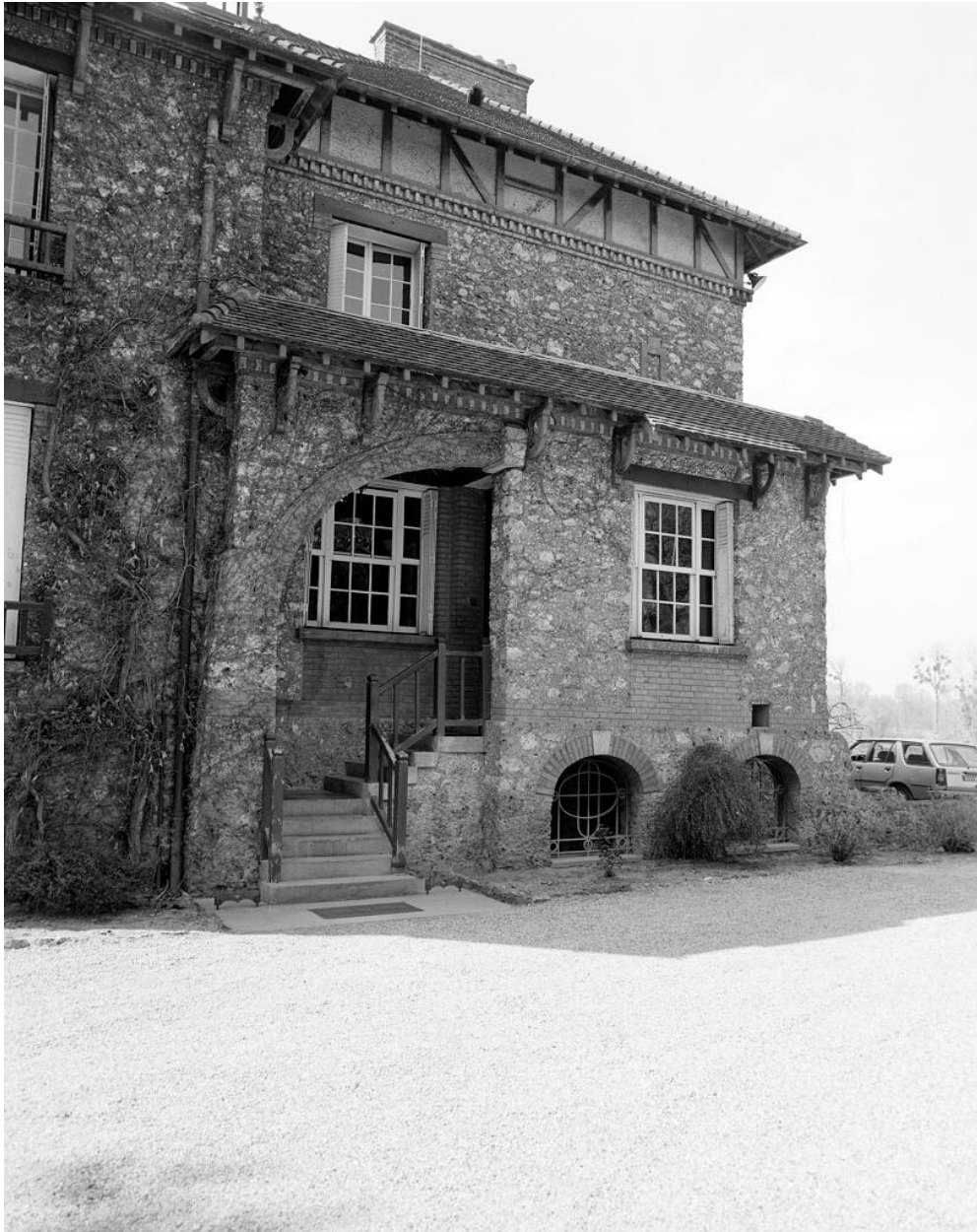
Détail de la porte latérale.