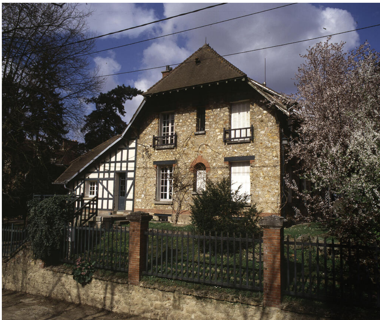
Vue des communs depuis la rue.