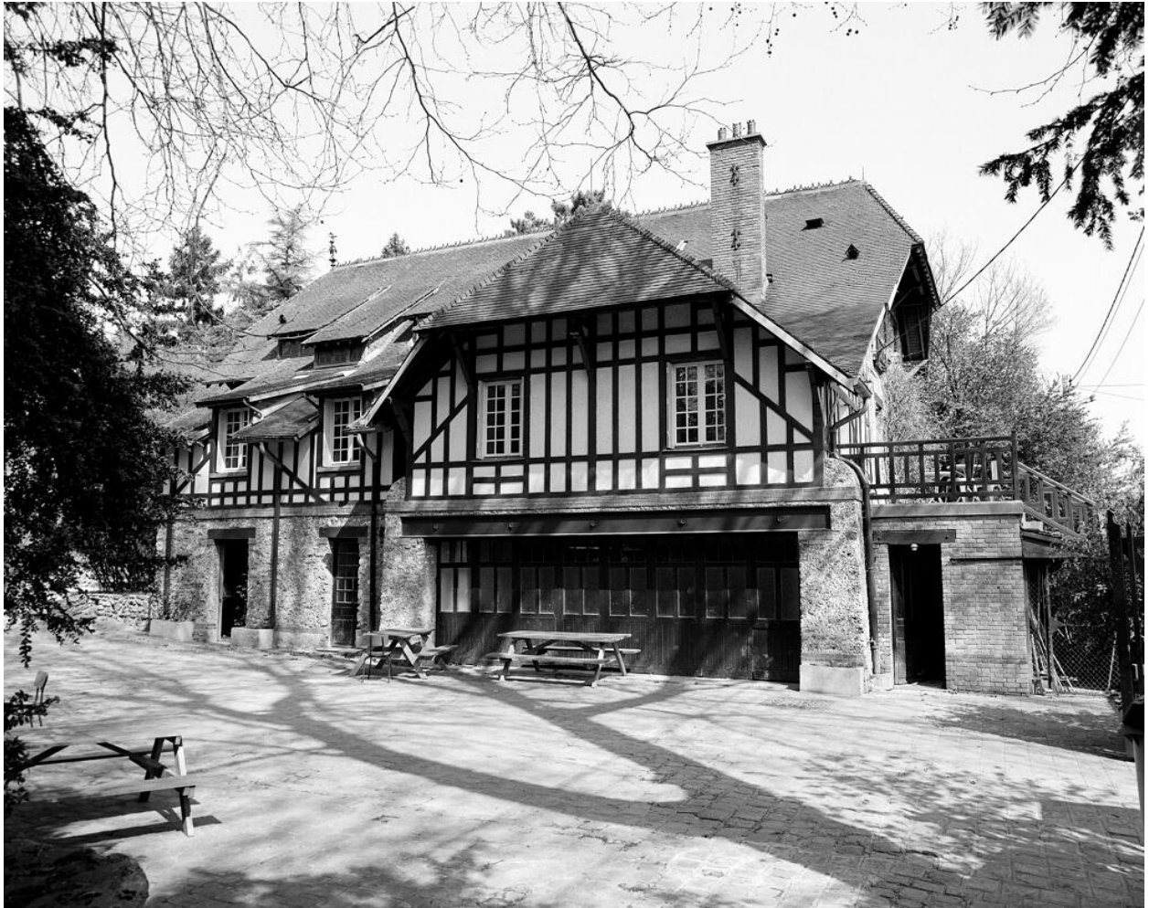
Vue des communs.