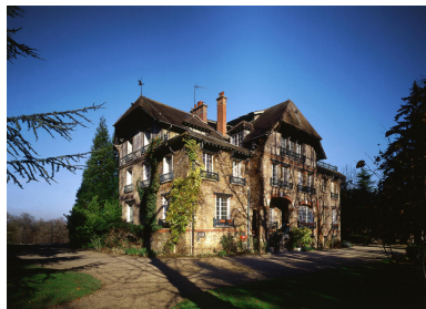
Vue de la façade antérieure. IVR11_20027800844VA