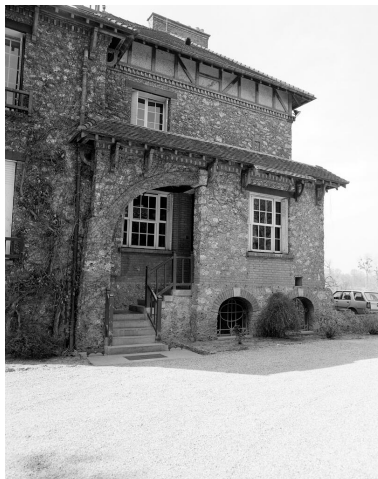
Détail de la porte latérale.