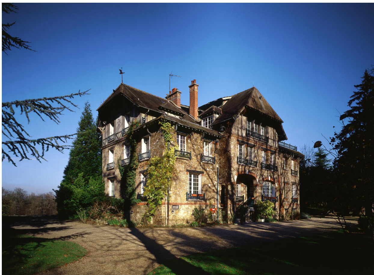
Vue de la façade antérieure.