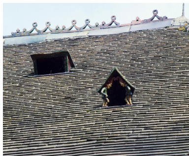
Détail de l'une des chatières sur le toit des communs : deux lutins se font face. IVR11_19967800420XA