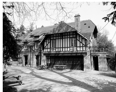
Vue des communs.