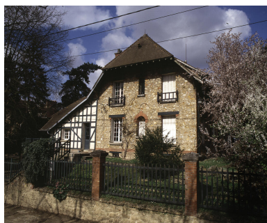
Vue des communs depuis la rue. IVR11_20027800043XA