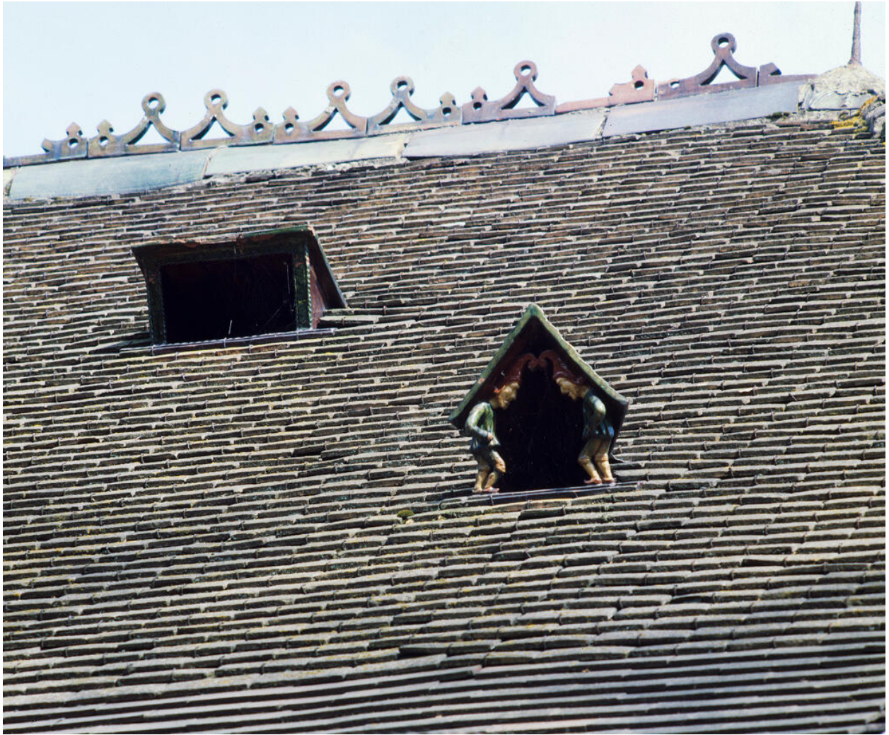
Détail de l'une des chatières sur le toit des communs : deux lutins se font face.