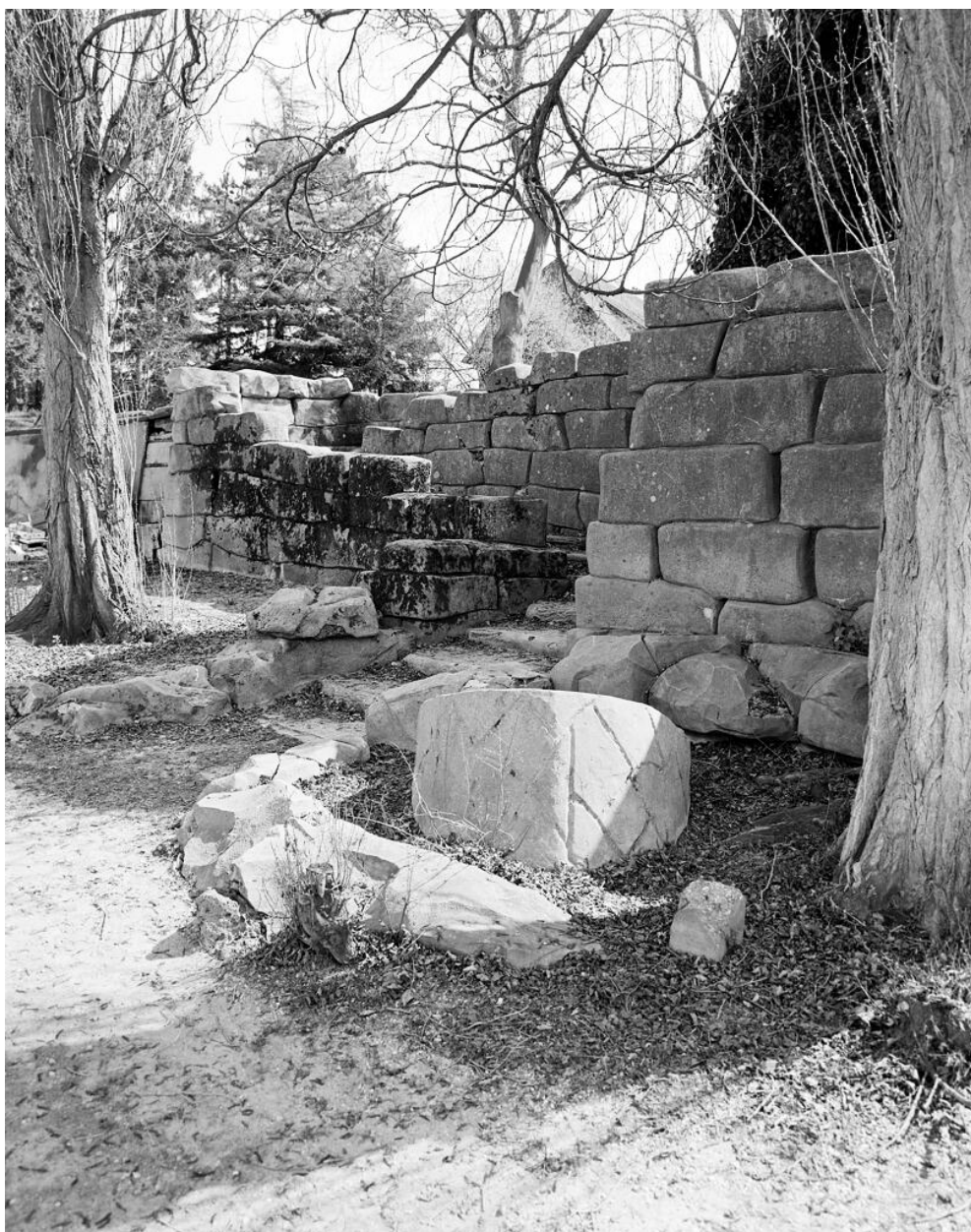
Vue du jardin du côté de l'embarcadère : des blocs en béton imitent un opus cyclopéen.