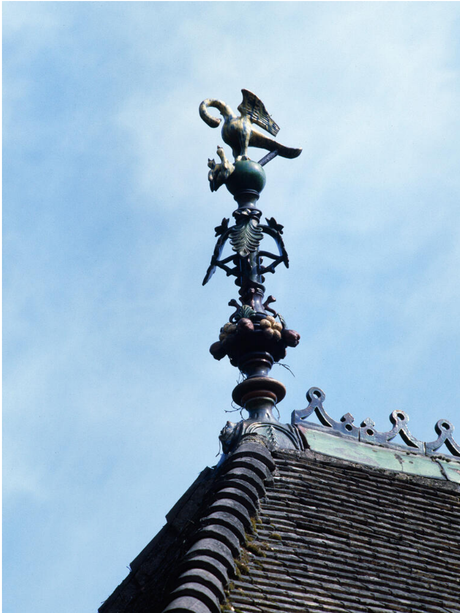
Vue d'un épi de faitage.