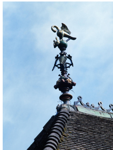
Vue d'un épi de faîtage.