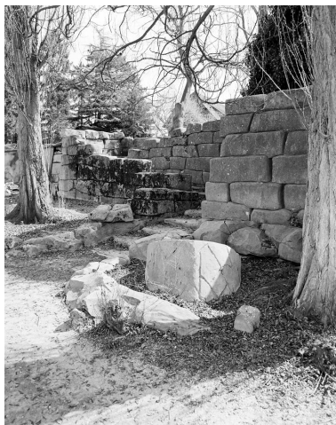
Vue du jardin du côté de l'embarcadère : des blocs en béton imitent un opus cyclopéen.