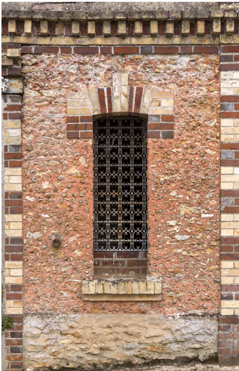
Maison d'Octave Allaire, fenêtre du garage