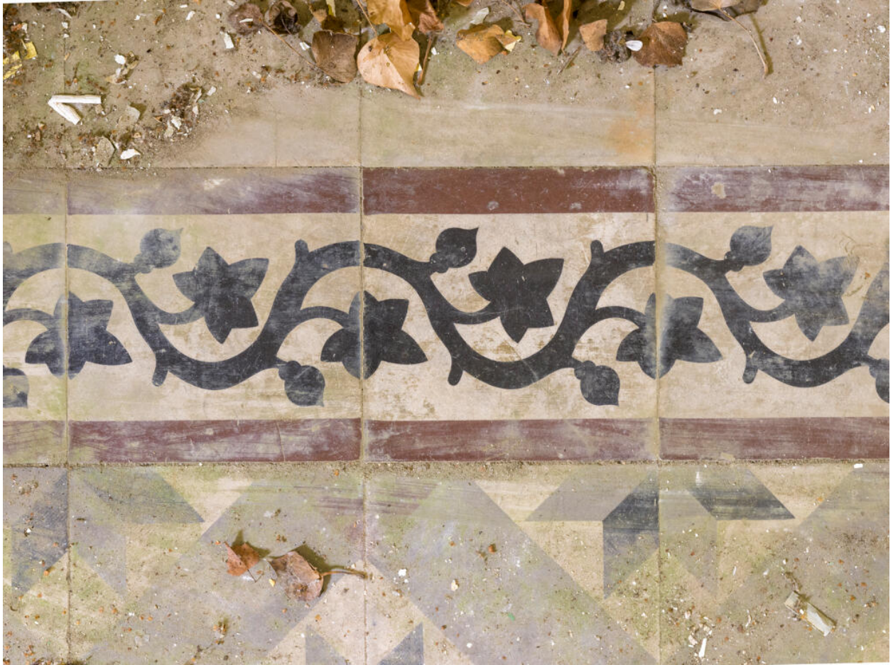
Maison d'Octave Allaire, frise ornementale à rinceau végétal ornant le sol des pièces du rez-de-chaussée en carreaux de ciment