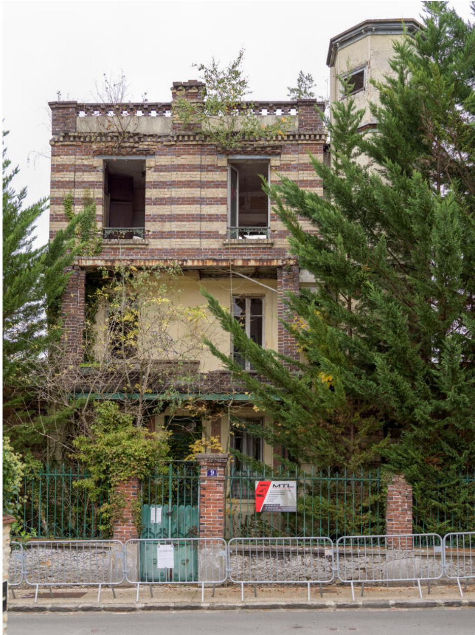
Maison d'Octave Allaire, façade principale vue depuis la rue