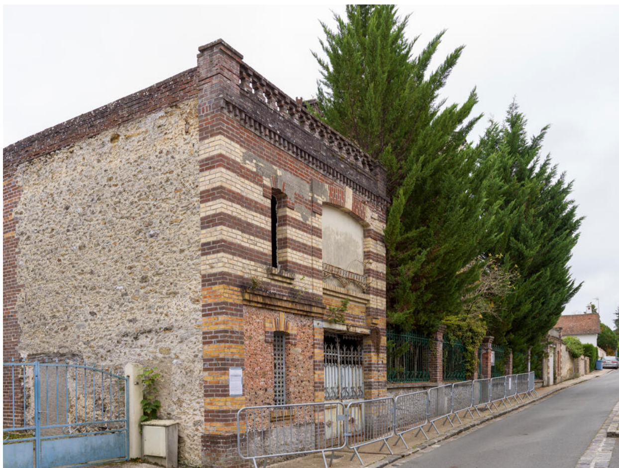
Maison d'Octave Allaire, dépendance ayant vraisemblablement servi de garage