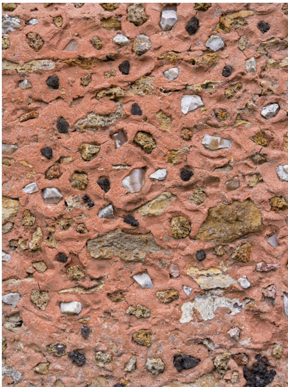
Maison d'Octave Allaire, rocaillage d'un mur. Le mortier coloré est incrusté de fragments de silex, de meulière et de mâchefer.