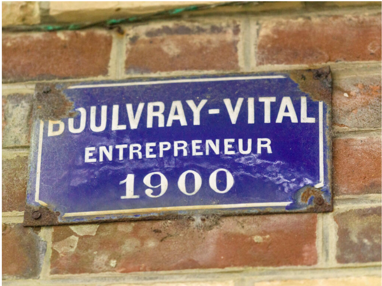
Maison d'Octave Allaire, plaque de l'entrepreneur Vital Boulvray qui a construit la maison en 1900.