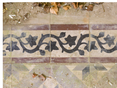
Maison d'Octave Allaire, frise ornementale à rinceau végétal ornant le sol des pièces du rez- de-chaussée en carreaux de ciment IVR11_20257800229NUC4A