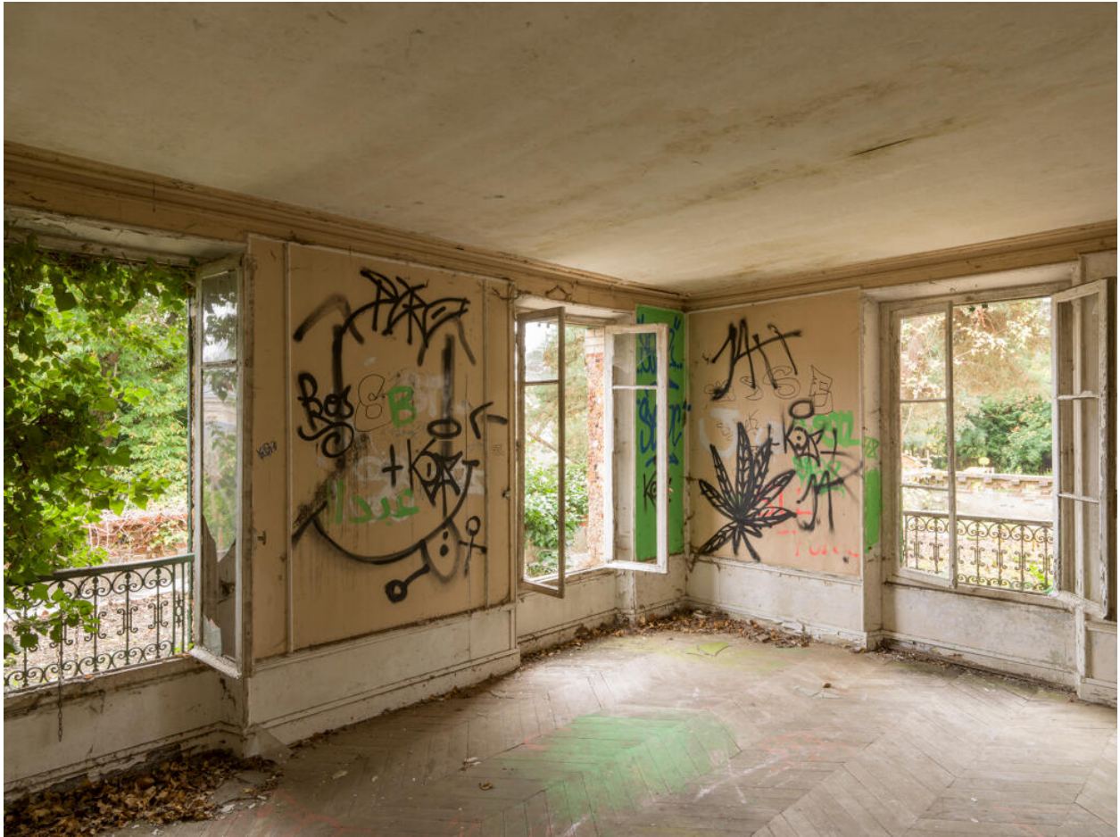
Maison d'Octave Allaire, chambre au premier étage