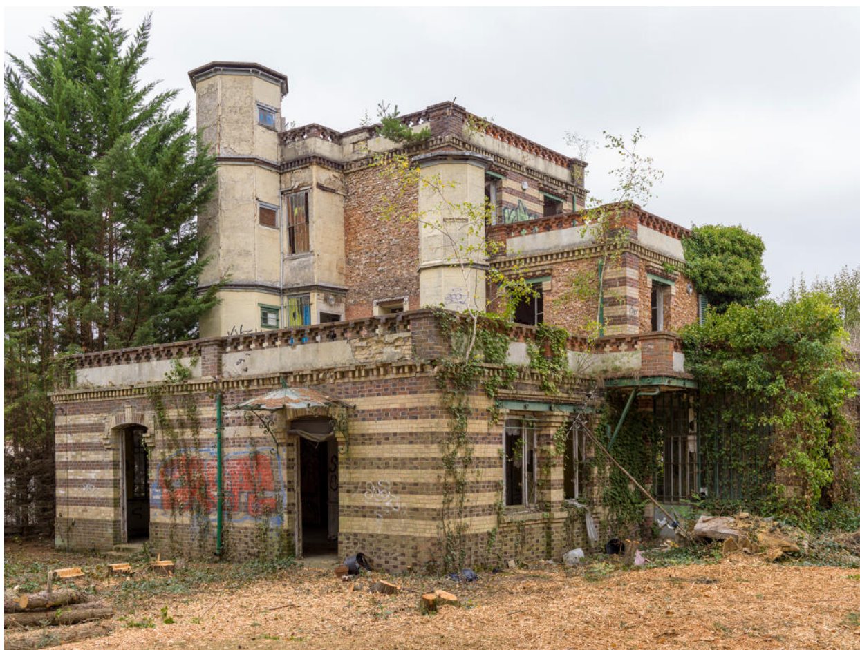
Maison d'Octave Allaire, vue générale depuis le jardin