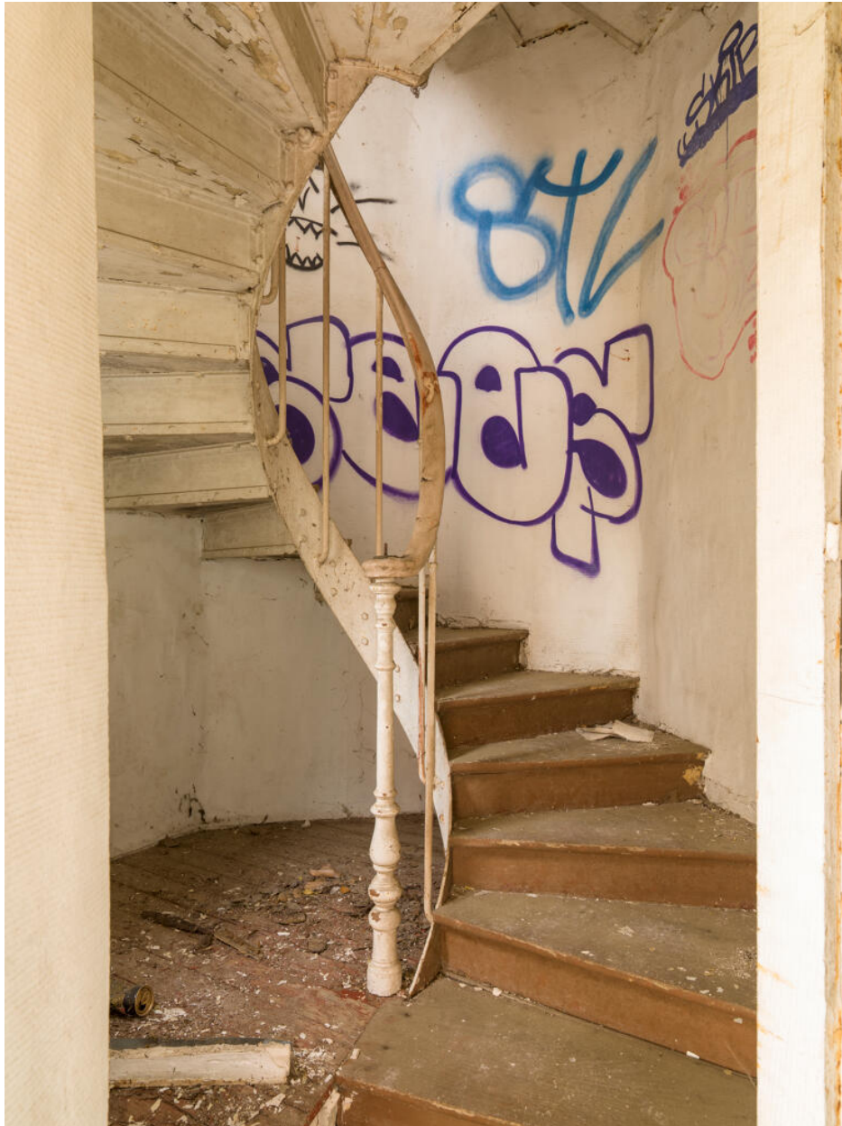
Maison d'Octave Allaire, départ de l'escalier reliant le premier et le second étage