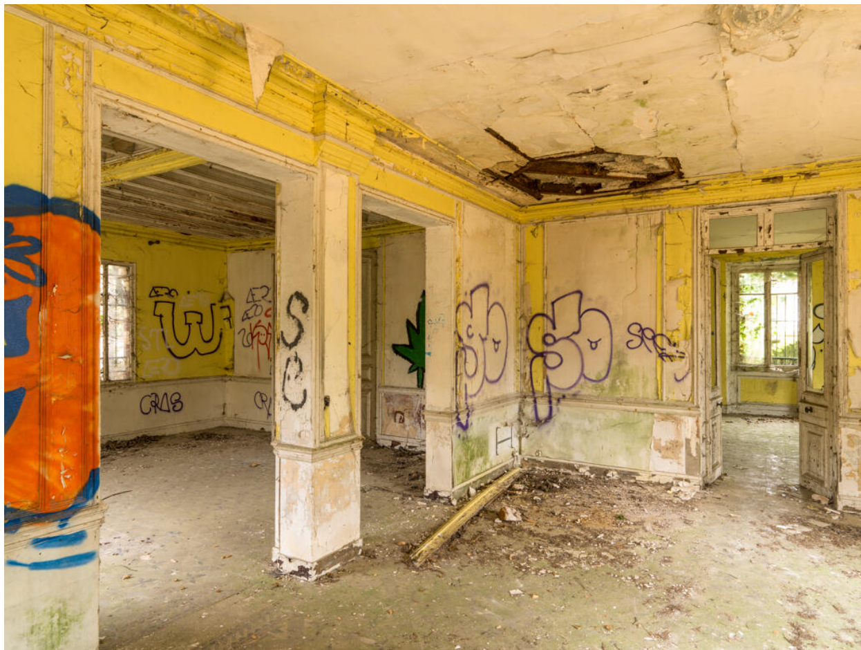
Maison d'Octave Allaire, pièce non-identifiée du rez-de-chaussée