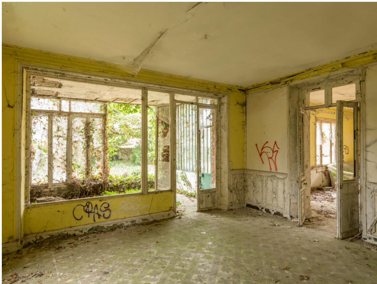
Maison d'Octave Allaire, pièce non-identifiée du rez-de-chaussée ouvrant sur une véranda