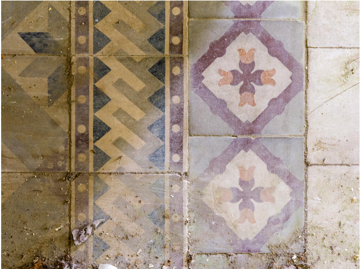
Maison d'Octave Allaire, carreaux de ciments du sol des pièces du rez-de-chaussée à décor de frises géométrique et florale