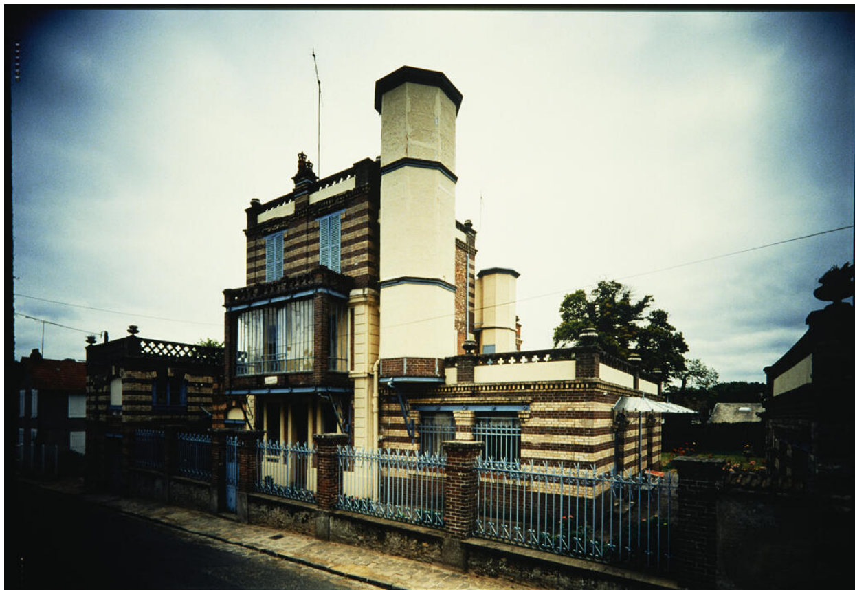
Maison d'Octave Allaire, façade principale, vue depuis la rue