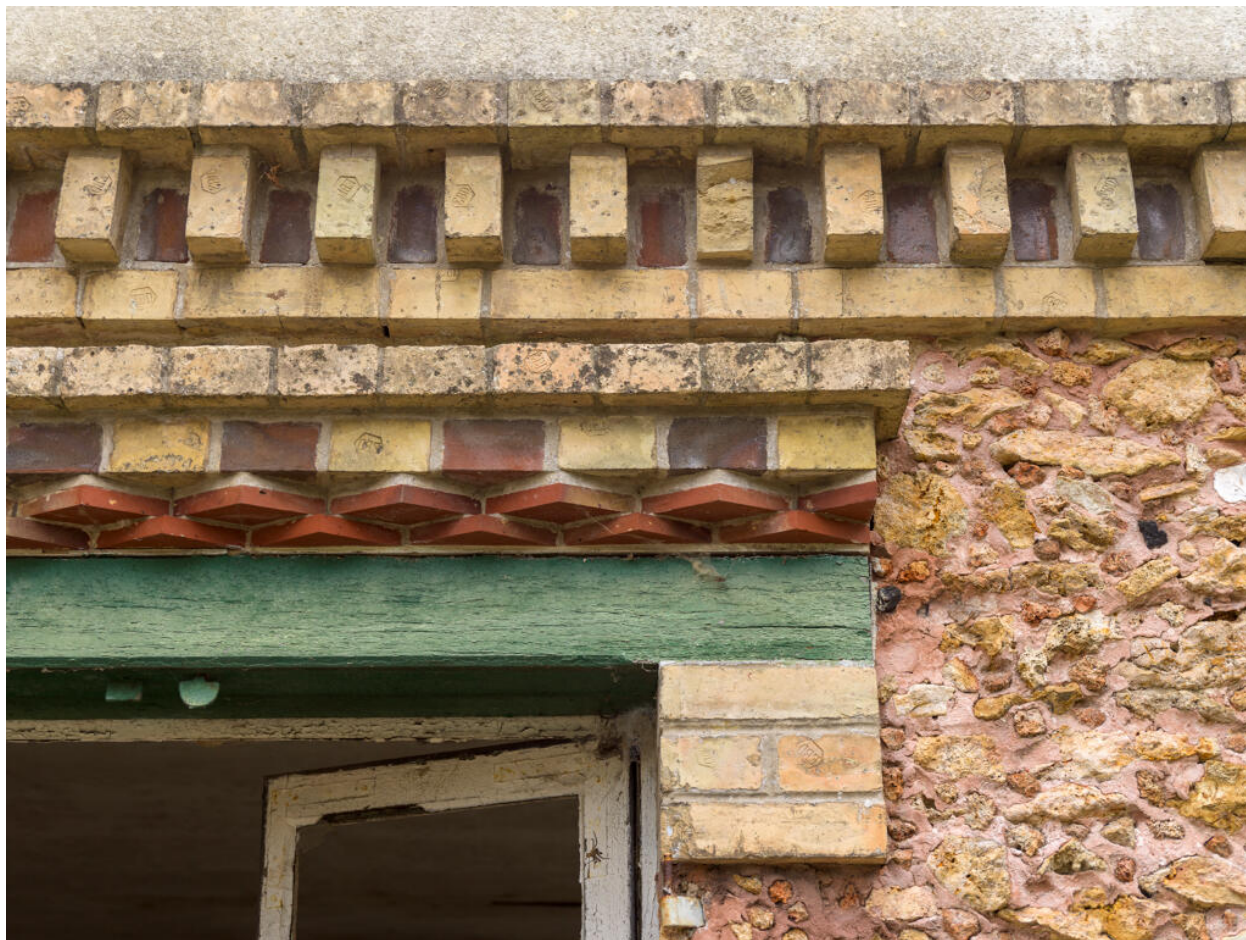
Maison d'Octave Allaire, détail de la modénature, alternant les mises en #uvre de la brique