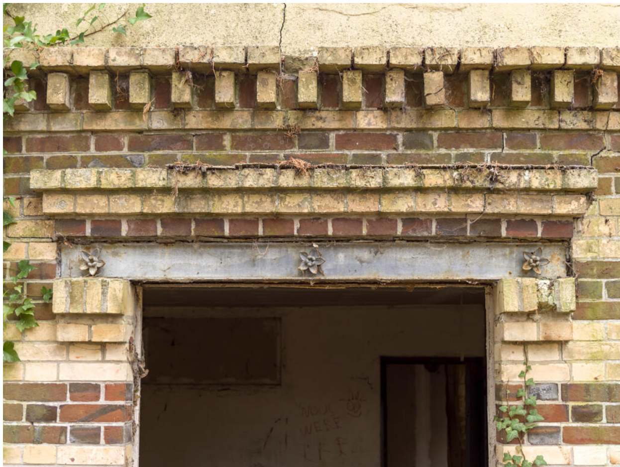
Maison d'Octave Allaire, couvrement d'une fenêtre : linteau métallique à fleurons, corniche et denticules en brique.