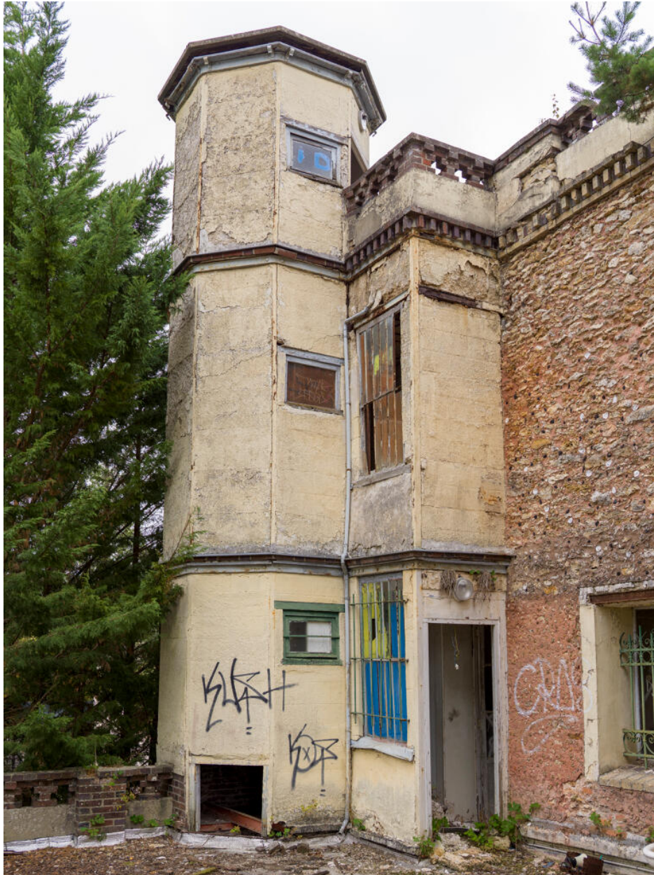
Maison d'Octave Allaire, tourelle d'escalier hors-#uvre desservant les étages.