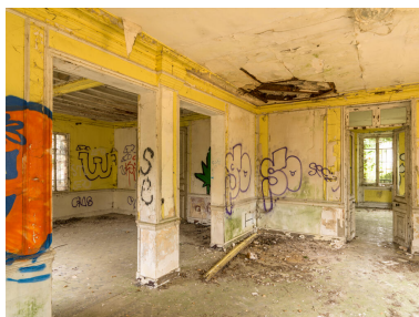
Maison d'Octave Allaire, pièce non-identifiée du rez-de-chaussée IVR11_20257800219NUC4A