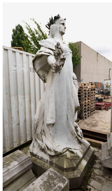
Vue de profil de la statue. IVR11_20099500637NUC4A