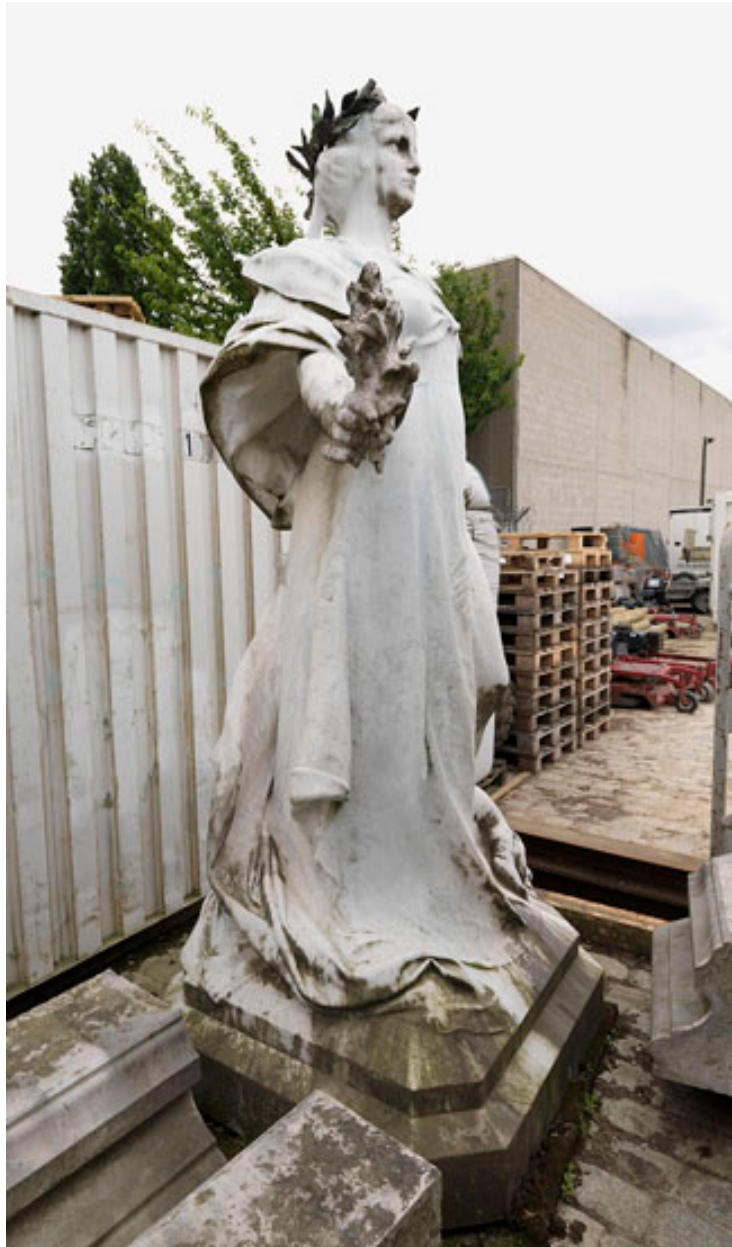
Vue de profil de la statue.