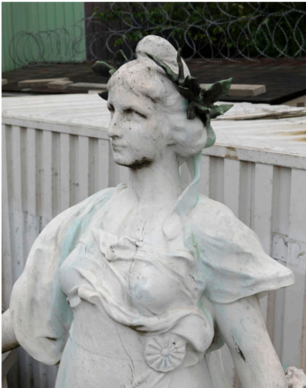
Détail du buste de la statue.