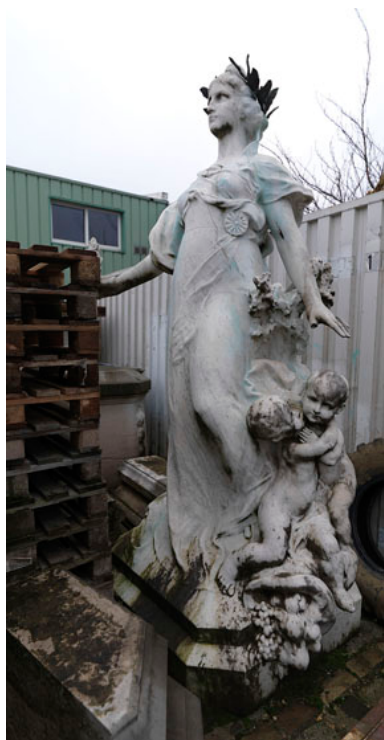
Vue d'ensemble de la statue.