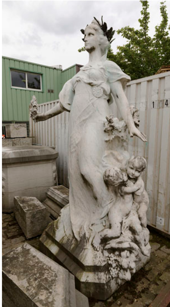
Vue de trois quarts de la statue de la République.