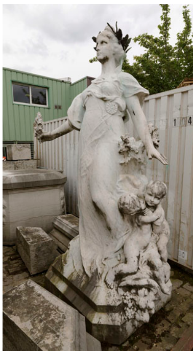
Vue de trois quarts de la statue de la République. IVR11_20099500636NUC4A