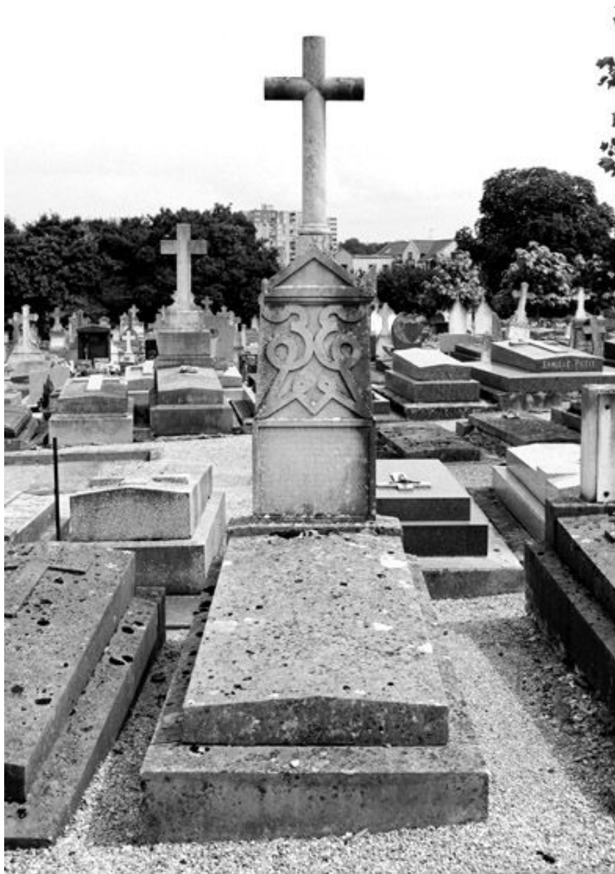
Vue d'ensemble de la tombe du sténographe Camille Louis Ludmann, décédé en 1879.