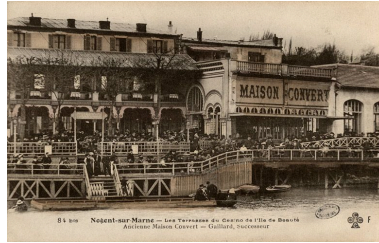
Carte postale. Vue des terrasses en bord de Marne. IVR11_20049400803NUCAB