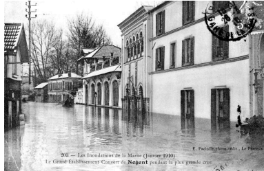
Face antérieure. Au centre: première salle de bad de style mauresque. Au fond: salle de bal ajoutée en 1908. Carte postale, 1910. IVR11_19859400229XB