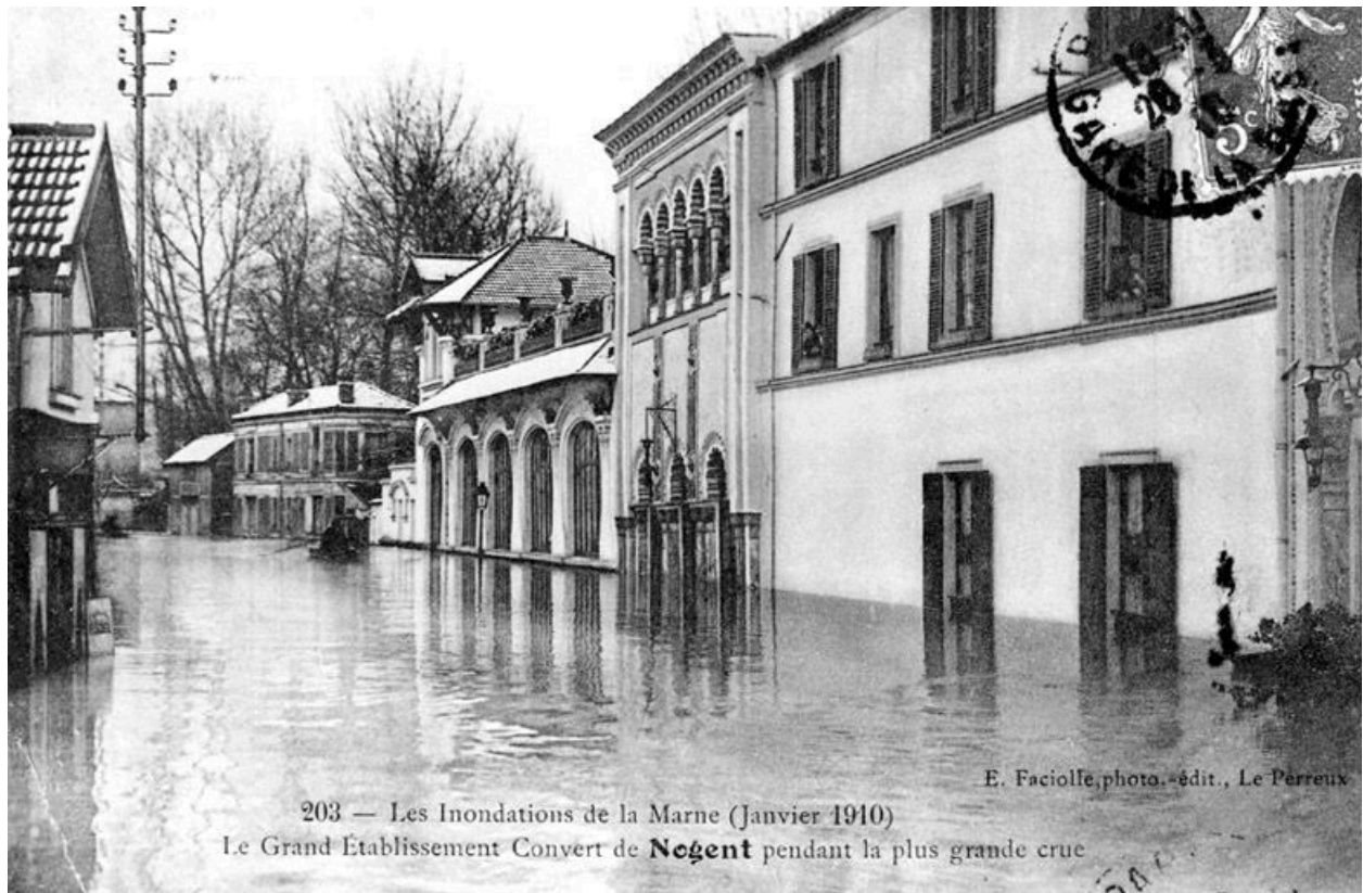
Face antérieure. Au centre: première salle de bad de style mauresque. Au fond: salle de bal ajoutée en 1908. Carte postale, 1910. (AD Val-de-Marne)