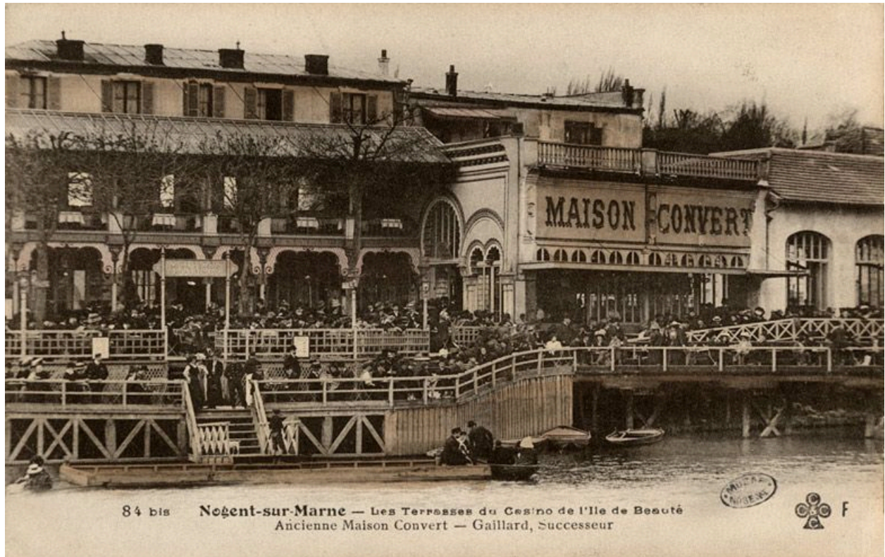
Carte postale. Vue des terrasses en bord de Marne.