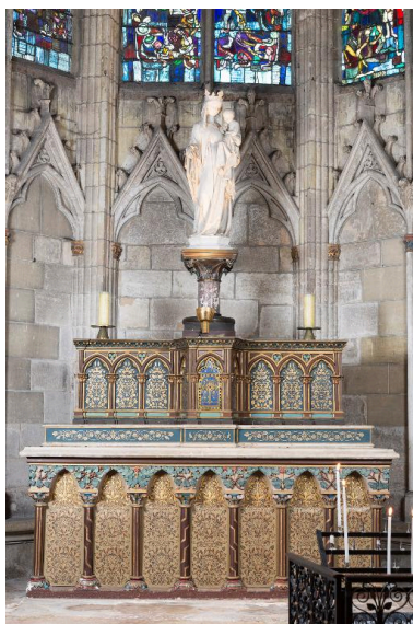
Détail de l'autel et de la statue IVR11_20187800326NUC4A