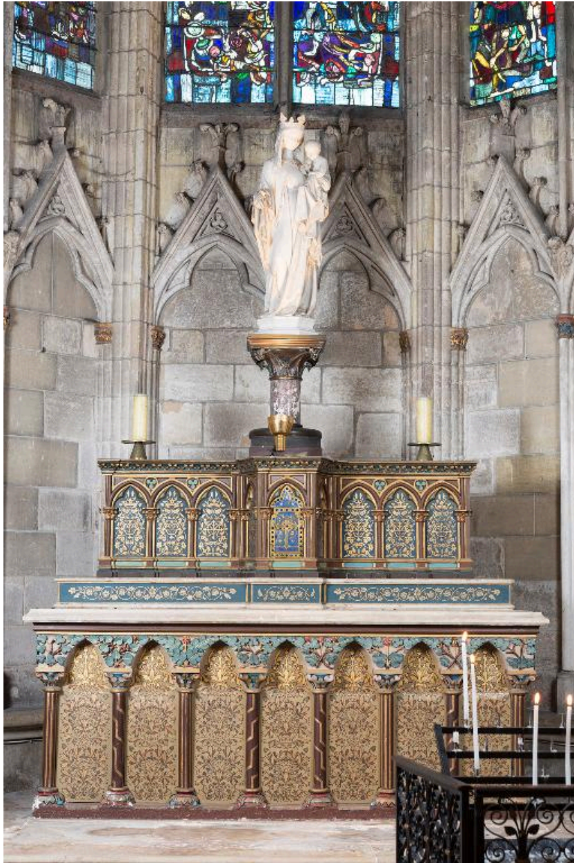
Détail de l'autel et de la statue