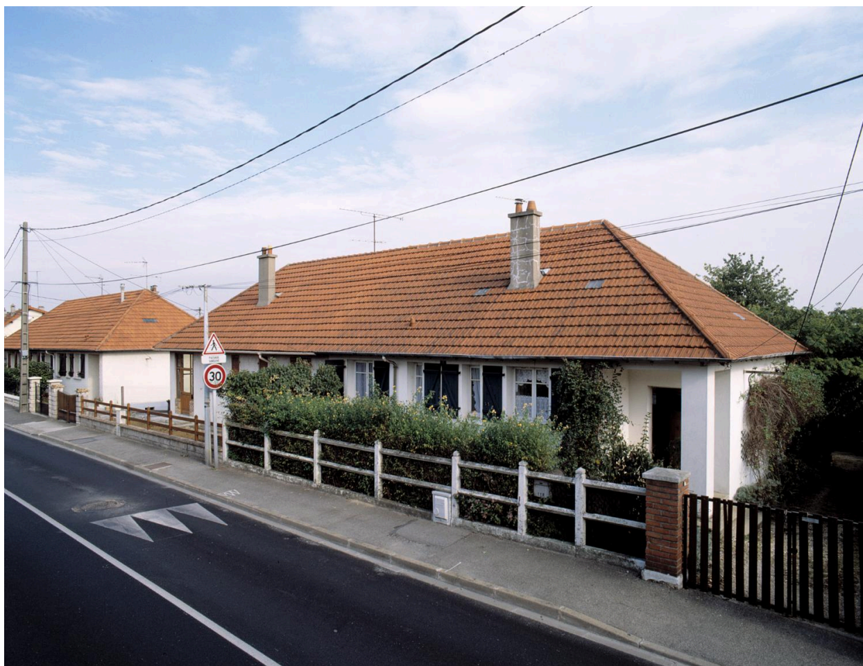
Vue de deux pavillons le long de l'avenue Jules-Vallès (n° 118 et 120).