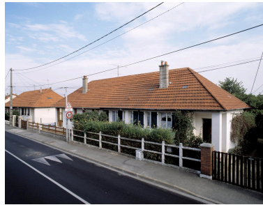
Vue de deux pavillons le long de l'avenue Jules-Vallès (n° 118 et 120).