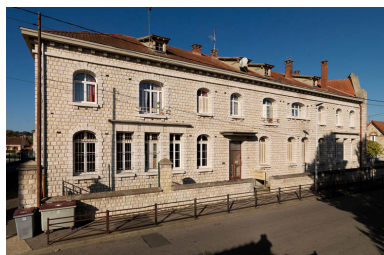
Construction de 1934 en meulière blanche de style arts déco. A l'est, la porte en ferronnerie géométrique est surmontée d'un auvent léger de ciment moulé..