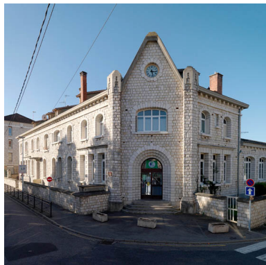
Construction de 1934 en meulière blanche de style arts déco. Façade en pan coupé formant pignon, encadrée par deux piles monumentales surmontées de pinacles à redents.