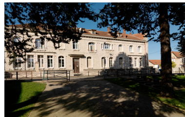
Construction de 1934 en meulière blanche de style arts déco. A l'est, la porte en ferronnerie géométrique est surmontée d'un auvent léger de ciment moulé.. IVR11_20117700489NUC4A