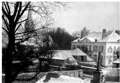
Vue de situation. Photographie. (Soc. hist. du Vieux Nogent) IVR11_19859400861XB