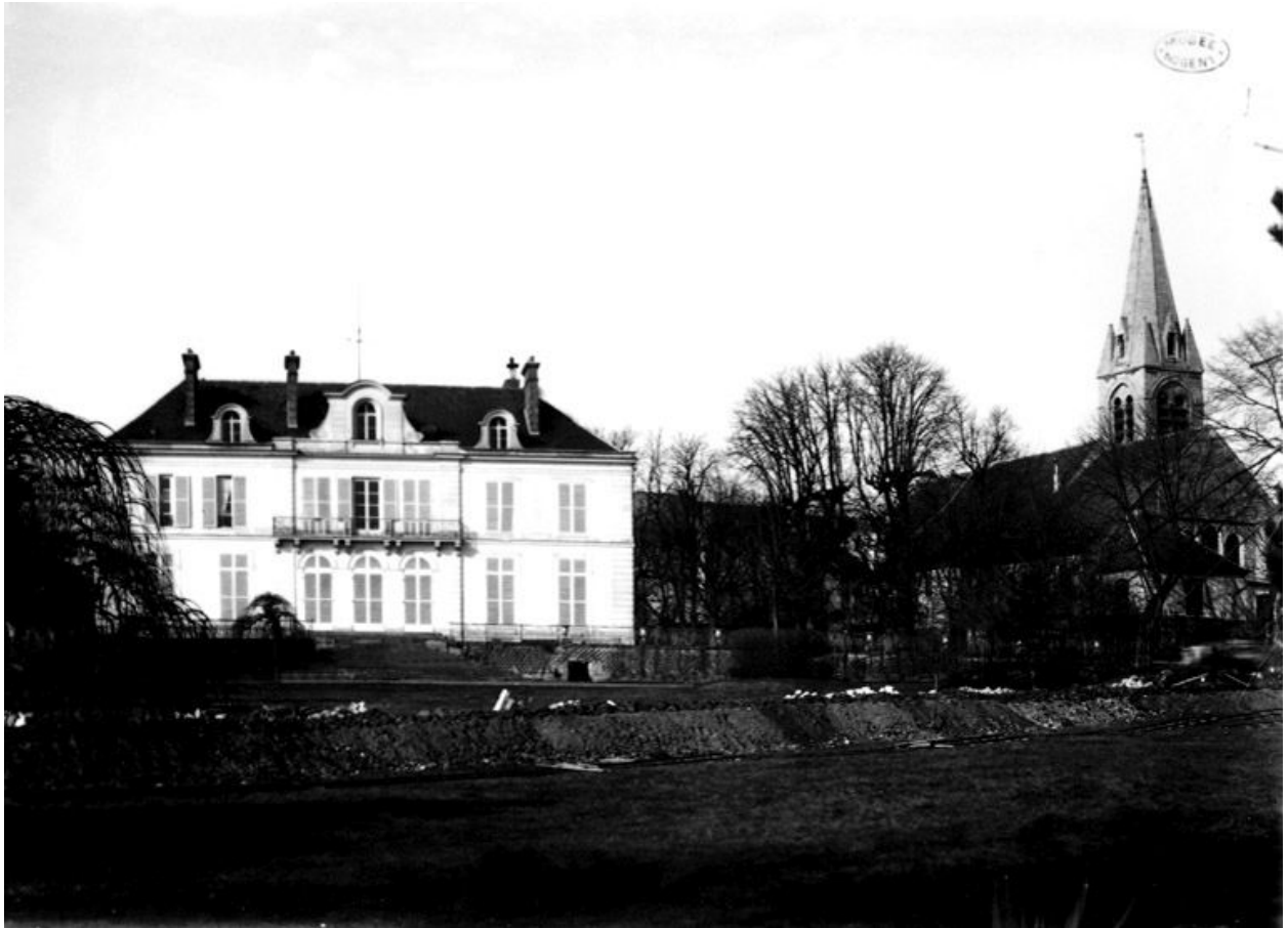
Façade postérieure. Photographie, avant 1896.