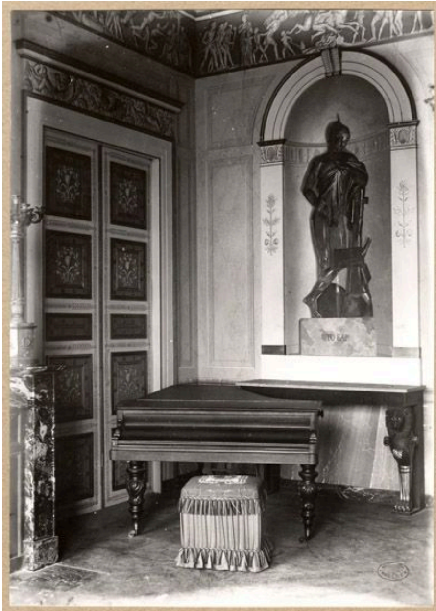
Vue d'intérieur. Cette photographie prise par Jeanne Smith est reproduite par Antoine Dufournet dans son ouvrage sur Nogent. Il indique ""décoration de Fragonard le Jeune (style Empire)"". (Musée Nogent-sur-Marne)