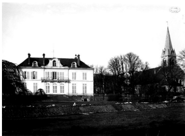
Façade postérieure. Photographie, avant 1896. IVR11_19859400862XB