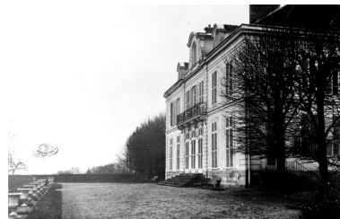
Façade postérieure. Carte postale. IVR11_19859400860XB