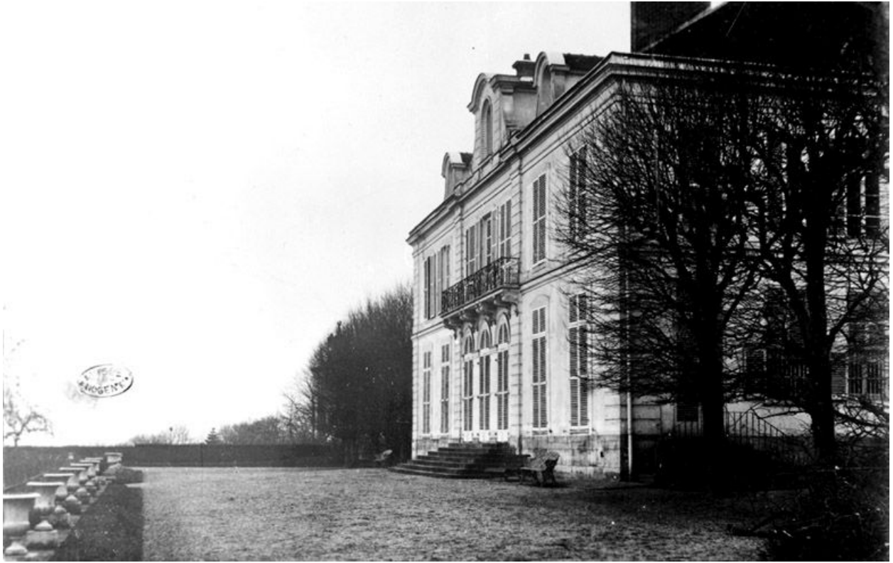
Façade postérieure. Carte postale.