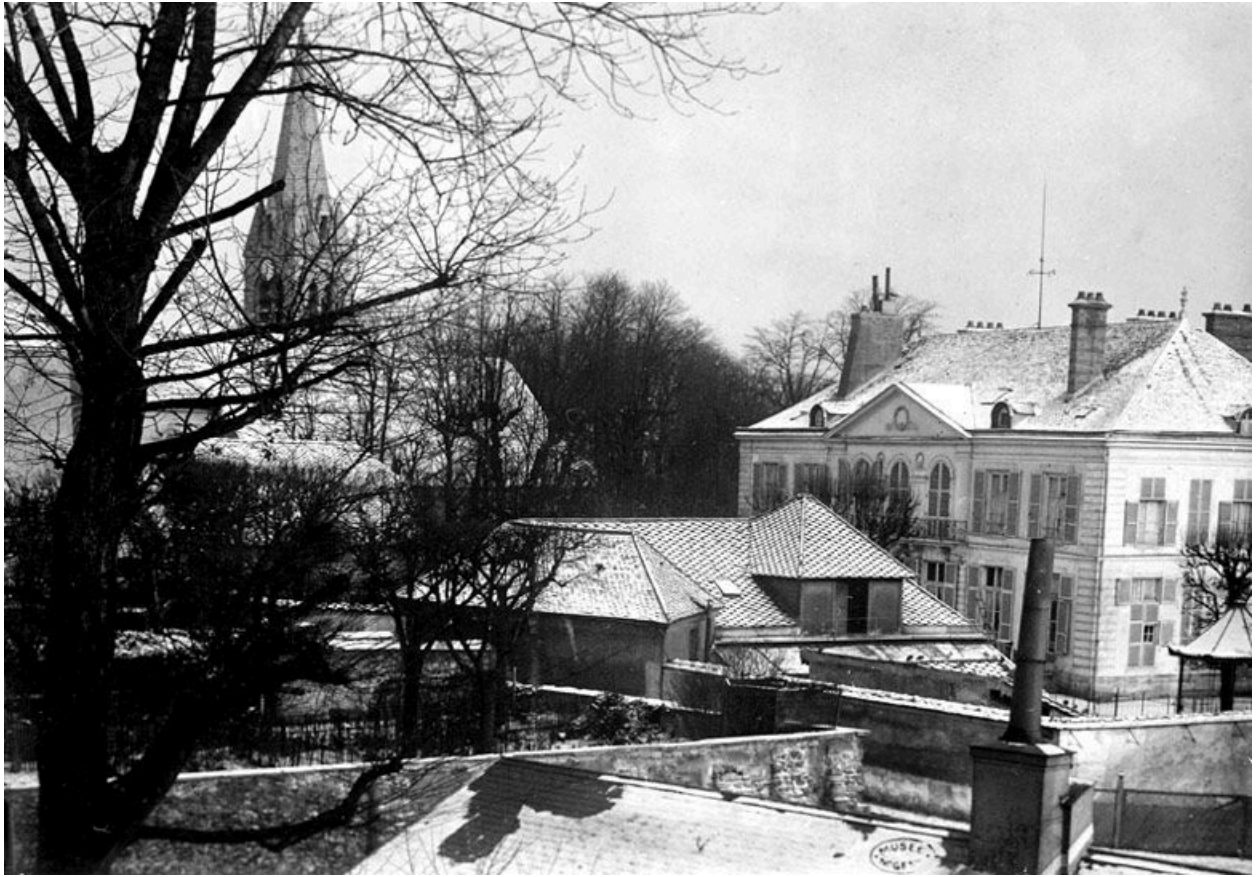
Vue de situation. Photographie.