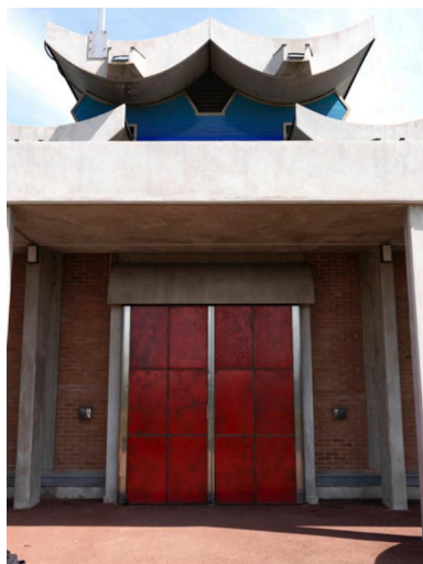
Vue d'un des panneaux de céramique, surmontant à l'extérieur une porte d'entrée à la salle omniculture.