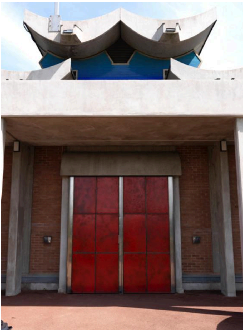
Vue d'un des panneaux de céramique, surmontant à l'extérieur une porte d'entrée à la salle omniculture.