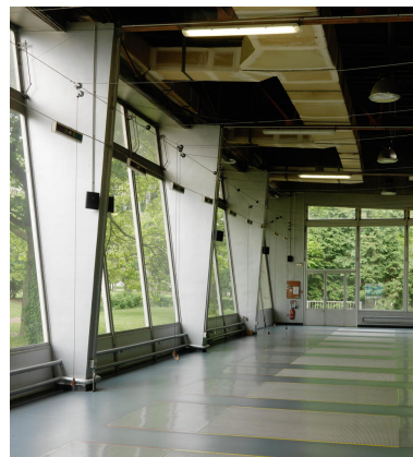
Salle d'escrime (ancienne salle de restaurant) : détail des travées vitrées des murs ouest et nord. Restaurant Sud, actuellement édifice sportif dit Espace Sud