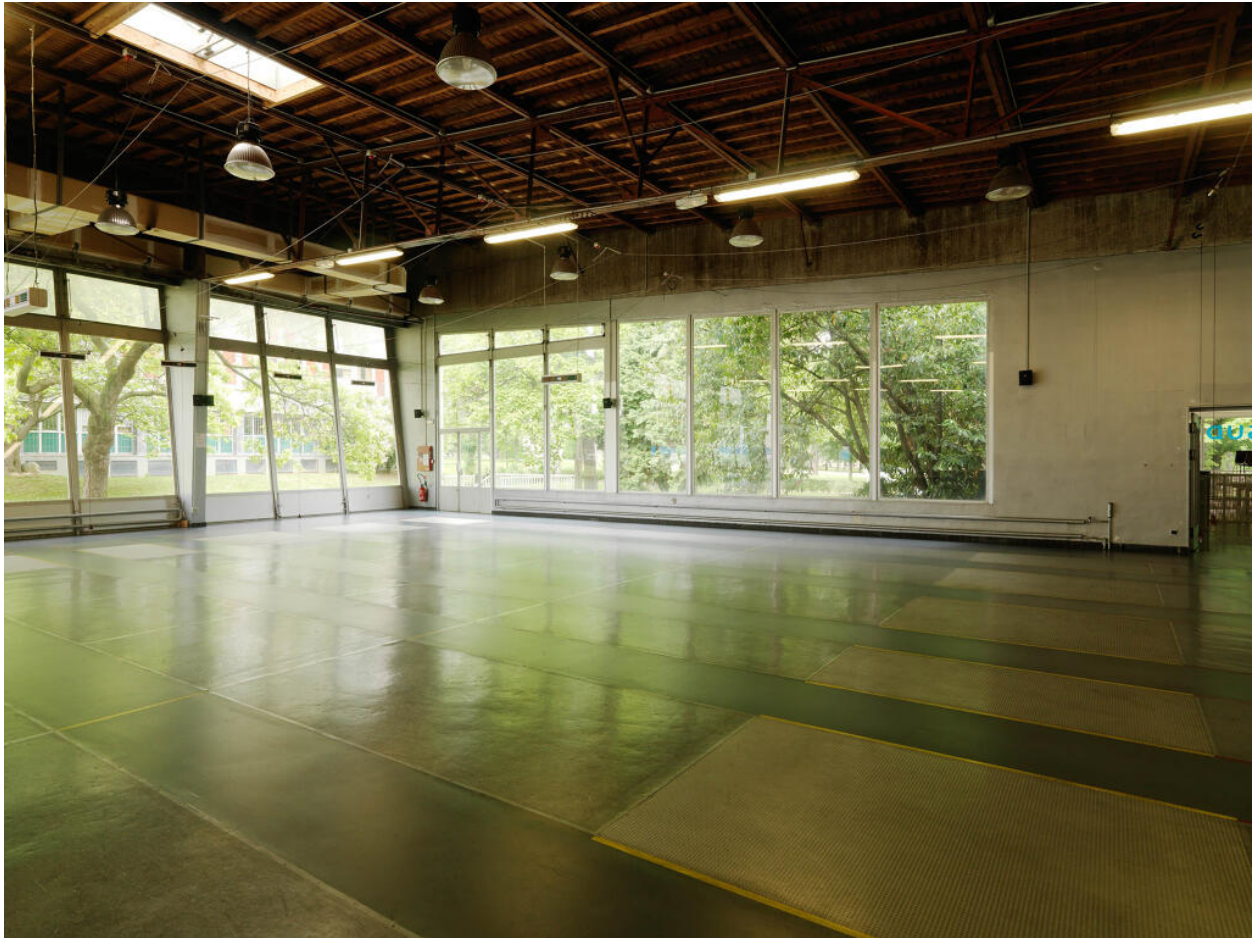
La salle de restaurant transformée en salle d'escrime. Restaurant Sud, actuellement édifice sportif dit Espace Sud