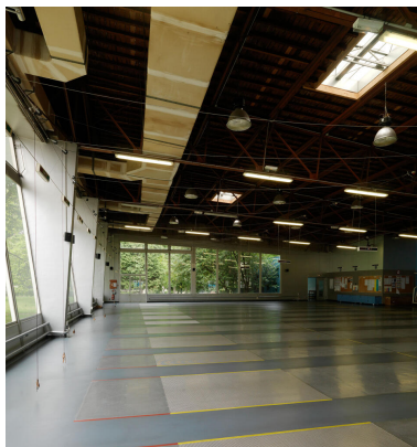
Vue de la salle d'escrime (ancienne salle de restaurant) en direction du nord. Au sol, les tapis métalliques conducteurs. Restaurant Sud, actuellement édifice sportif dit Espace Sud IVR11_20117500661NUC4A