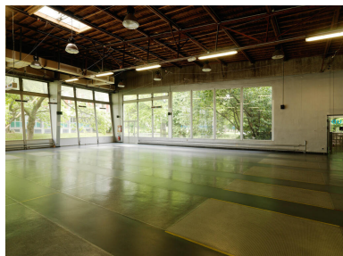
La salle de restaurant transformée en salle d'escrime. Restaurant Sud, actuellement édifice sportif dit Espace Sud IVR11_20117500659NUC4A