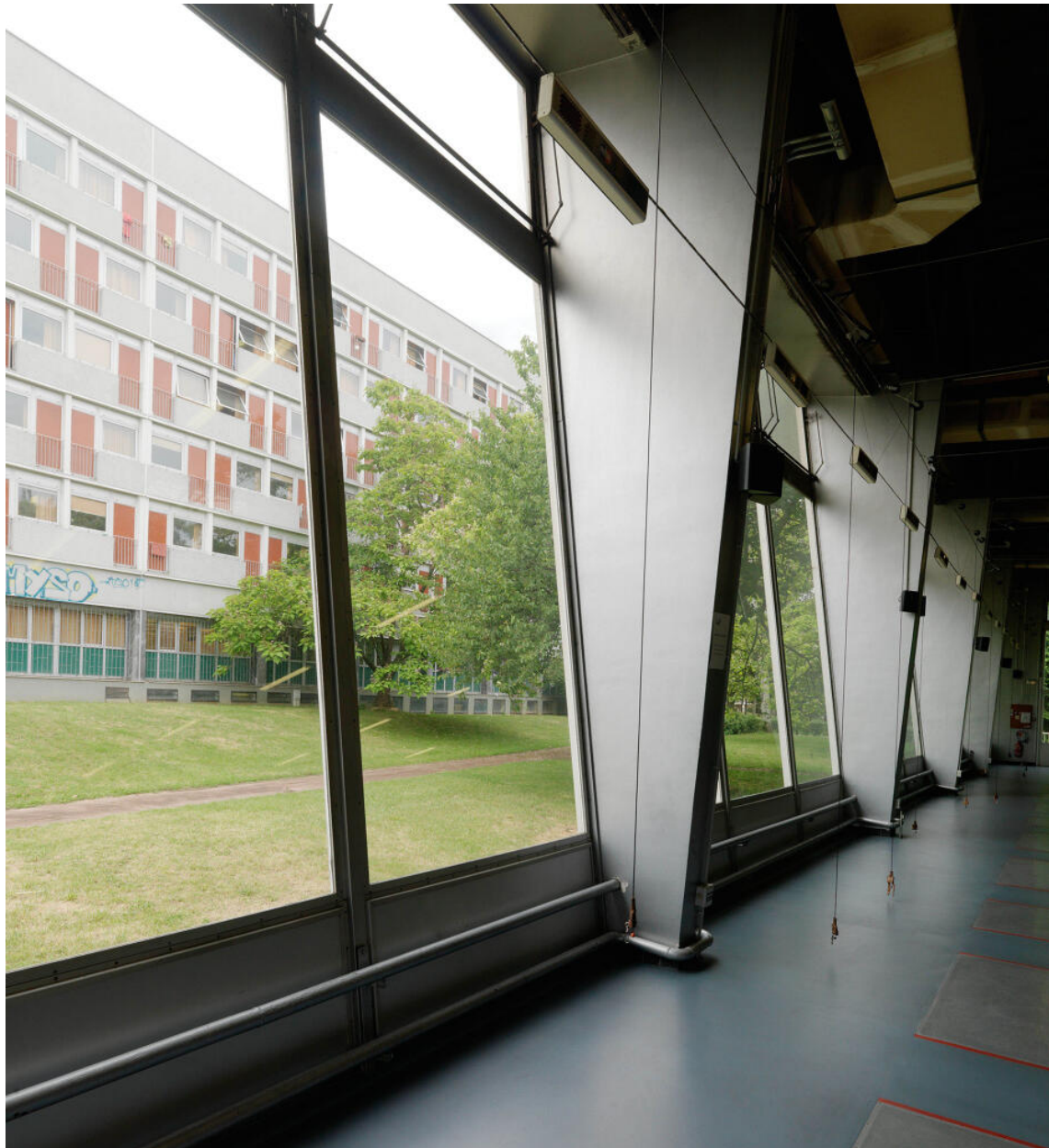
La salle d'escrime (ancienne salle de restaurant) : détail des travées vitrées du mur ouest. Elles donnent sur la Maison du Liban. Restaurant Sud, actuellement édifice sportif dit Espace Sud