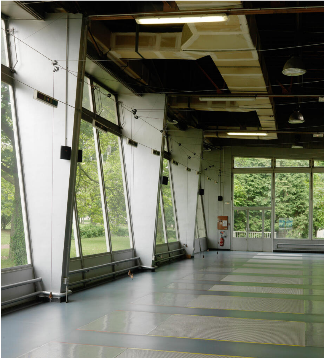
Salle d'escrime (ancienne salle de restaurant) : détail des travées vitrées des murs ouest et nord. Restaurant Sud, actuellement édifice sportif dit Espace Sud