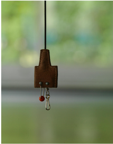
La salle d'escrime : gros plan sur un fil de corps. Restaurant Sud, actuellement édifice sportif dit Espace Sud IVR11_20117500669NUC4A