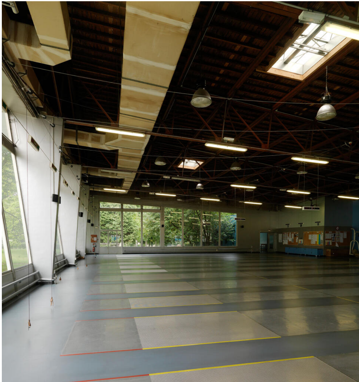
Vue de la salle d'escrime (ancienne salle de restaurant) en direction du nord. Au sol, les tapis métalliques conducteurs. Restaurant Sud, actuellement édifice sportif dit Espace Sud