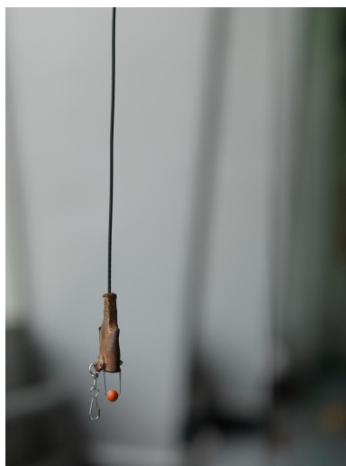
Salle d'escrime (ancienne salle de restaurant) : un fil de corps. Restaurant Sud, actuellement édifice sportif dit Espace Sud IVR11_20117500663NUC4A