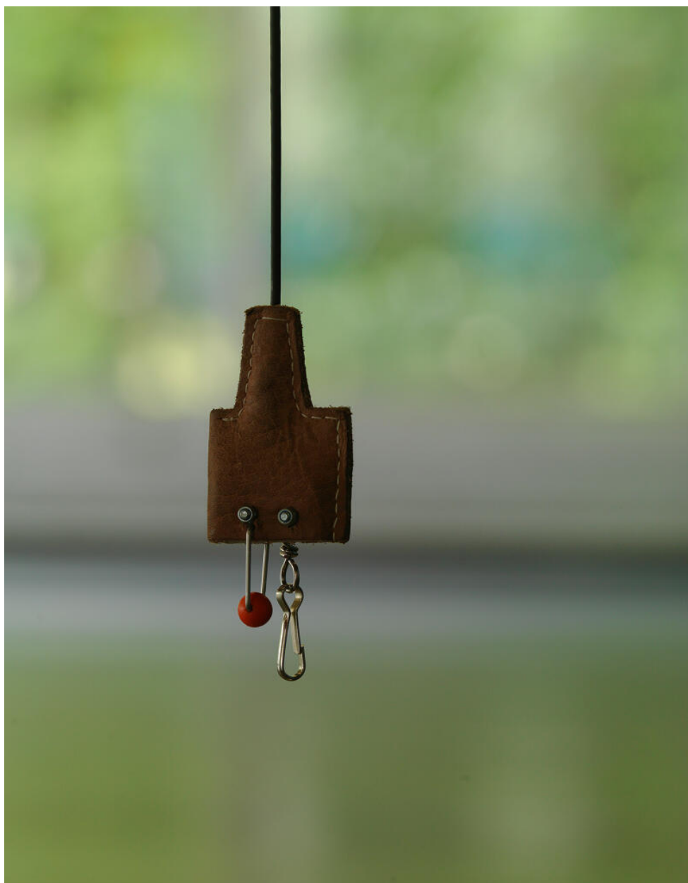
La salle d'escrime : gros plan sur un fil de corps. Restaurant Sud, actuellement édifice sportif dit Espace Sud