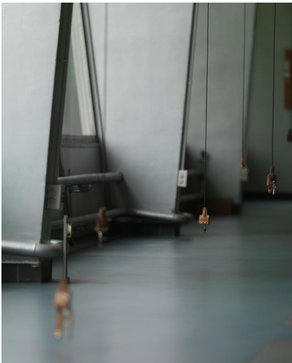
La salle d'escrime (ancienne salle de restaurant) : rangée de fils de corps. Restaurant Sud, actuellement édifice sportif dit Espace Sud