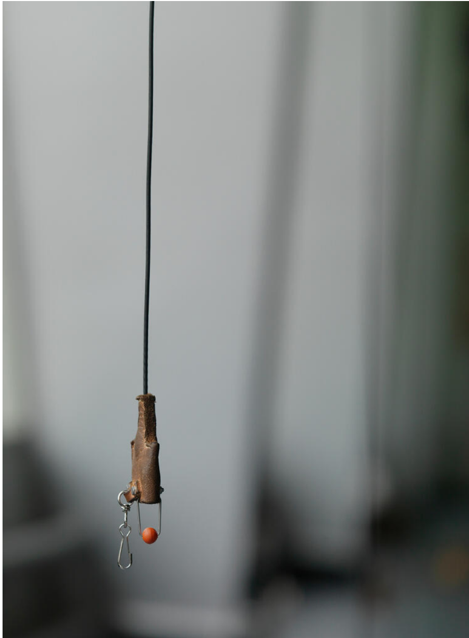
Salle d'escrime (ancienne salle de restaurant) : un fil de corps. Restaurant Sud, actuellement édifice sportif dit Espace Sud