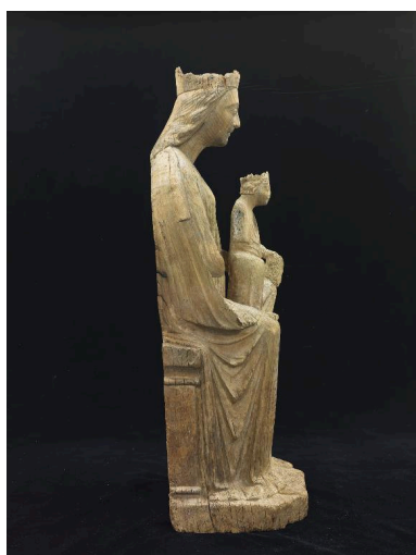
Vue du profil de droite. IVR11_20187800696NUC4A