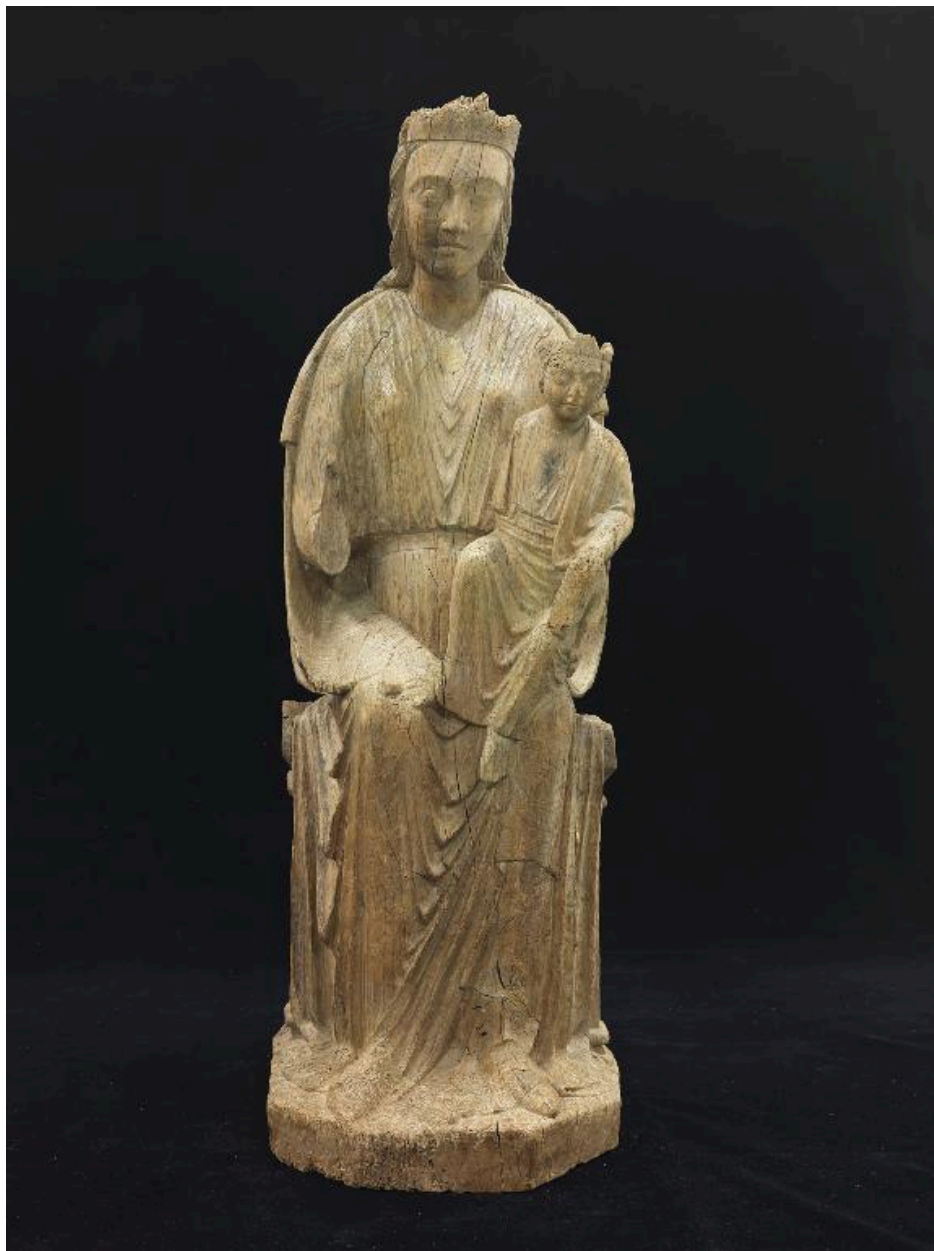
Vue d'ensemble de la statue aujourd'hui au musée de l'Hôtel-Dieu.