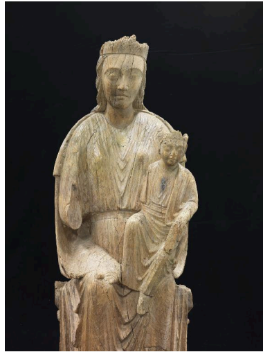
Détail de la partie supérieure. IVR11_20187800693NUC4A