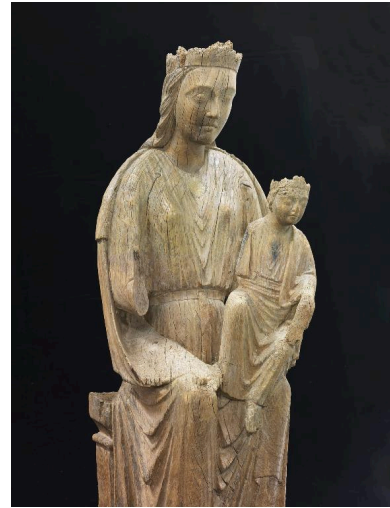
Vue rapprochée de la Vierge et de l'Enfant. IVR11_20187800694NUC4A