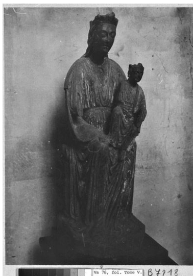
Vue d'ensemble. (BNF. Topo Va 78, fol. tome V. B 7218). Photographie. IVR11_20157800183Z