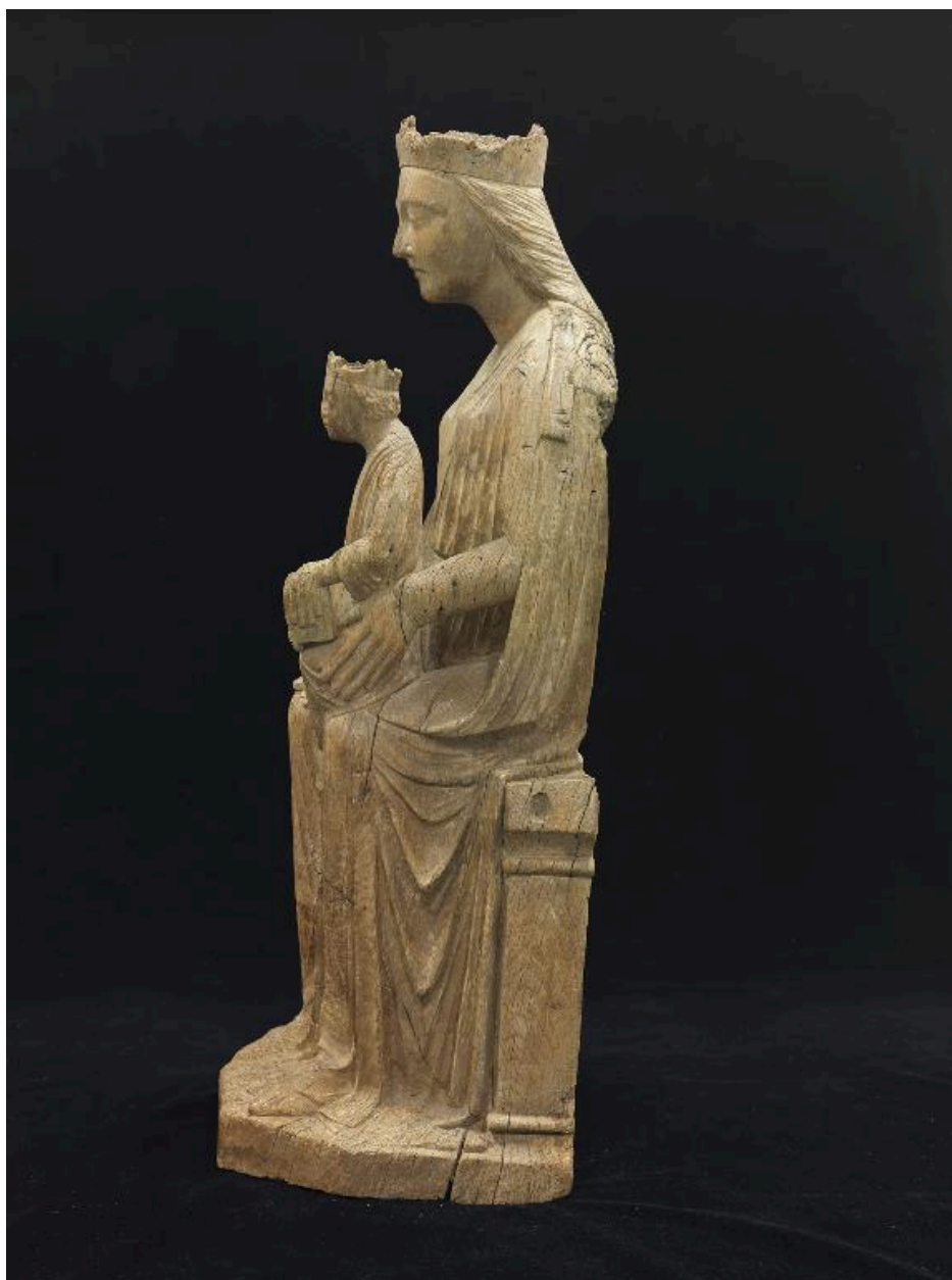
Vue du profil de gauche.