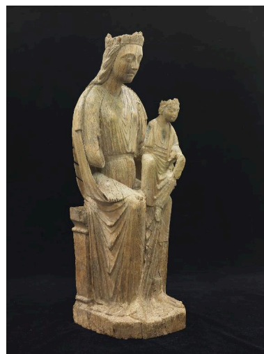
Vue de trois-quart. IVR11_20187800697NUC4A