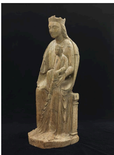
Vue de trois-quarts. IVR11_20187800699NUC4A