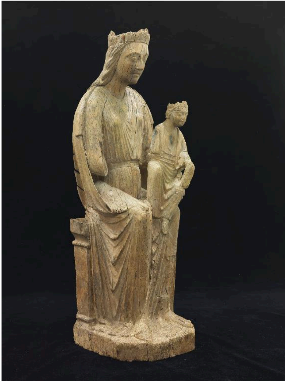
Vue de trois-quart.