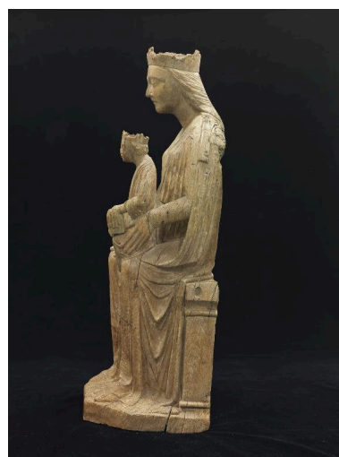
Vue du profil de gauche. IVR11_20187800700NUC4A