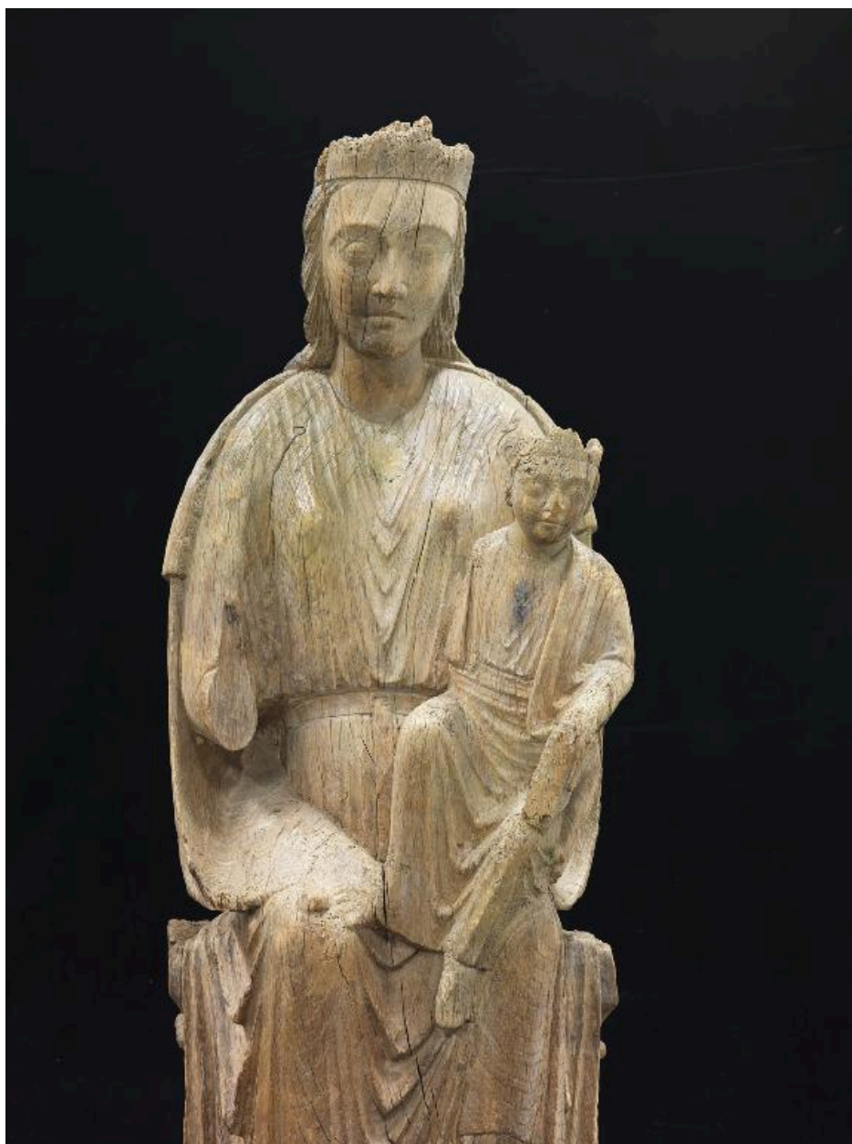
Détail de la partie supérieure.