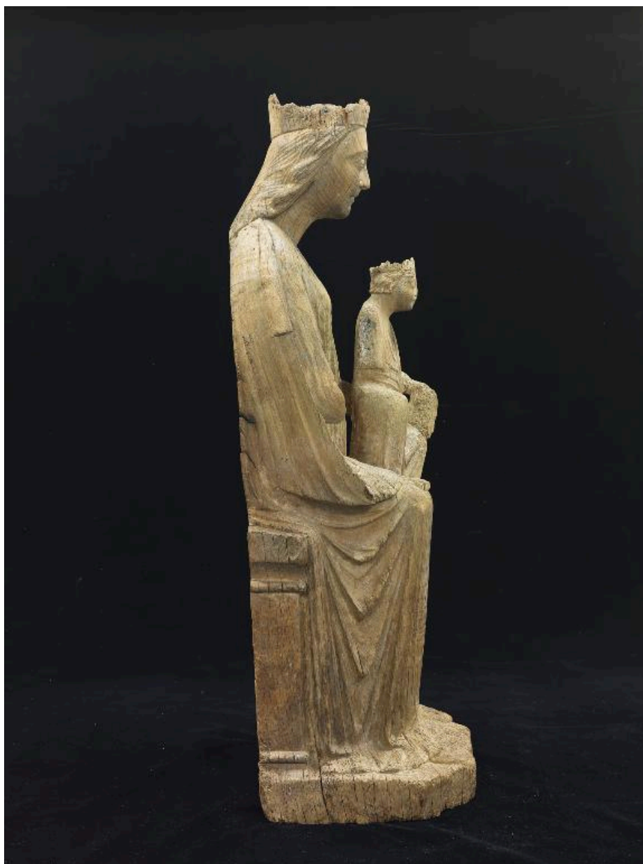
Vue du profil de droite.