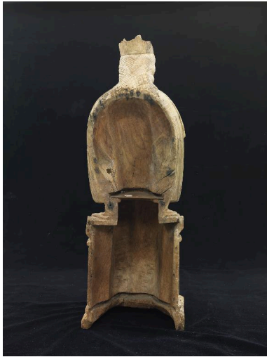
Vue du revers creux. IVR11_20187800695NUC4A