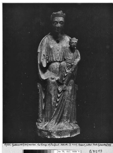
Vue d'ensemble prise en 1927 (BNF. Topo Va 78, fol. tome V. B 7219). Photographie. IVR11_20157800184Z