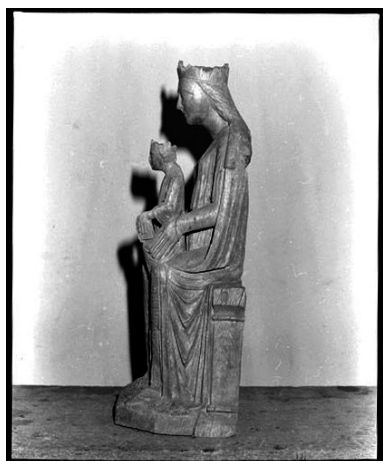
Vue du profil de gauche. IVR11_19777800716X