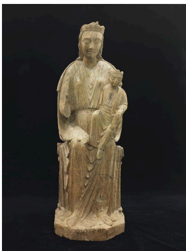
Vue d'ensemble de la statue aujourd'hui au musée de l'Hôtel-Dieu. IVR11_20187800698NUC4A