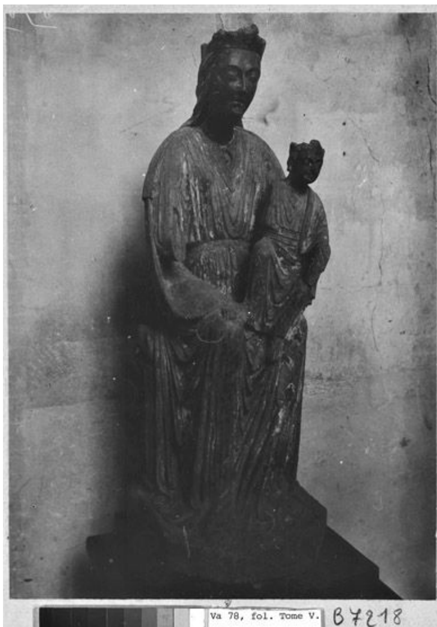
Vue d'ensemble. (BNF. Topo Va 78, fol. tome V. B 7218). Photographie.