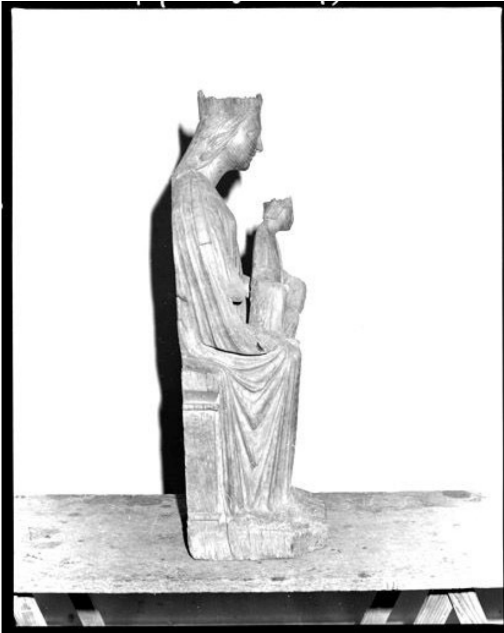
Vue du profil de droite.