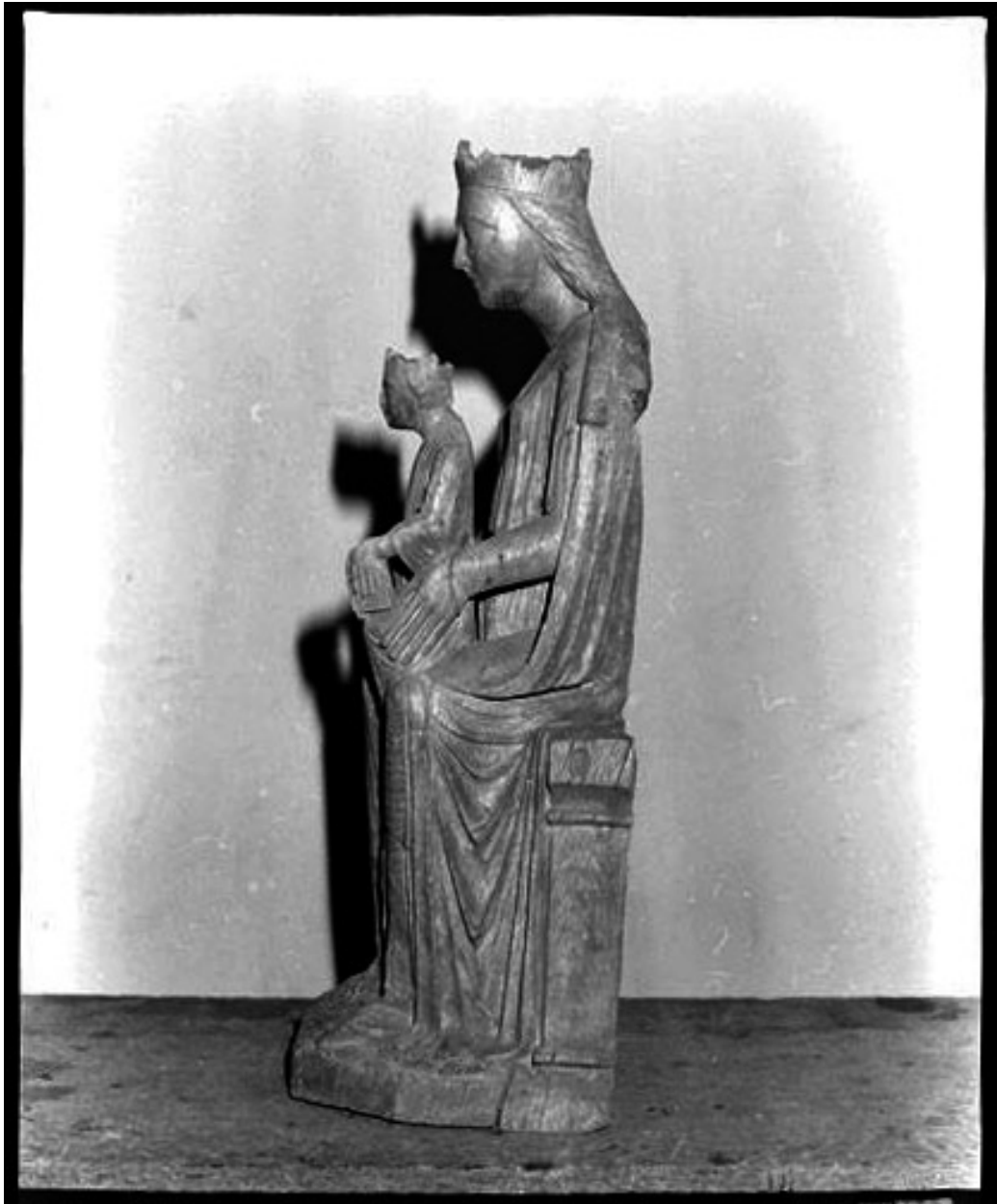
Vue du profil de gauche.