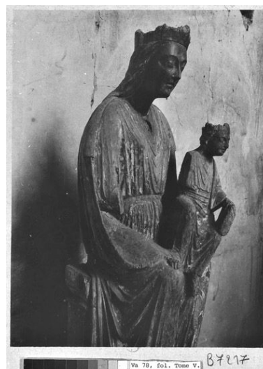
Détail de la partie supérieure. (BNF. Topo Va 78, fol. tome V. B 7217). Photographie. IVR11_20157800182Z