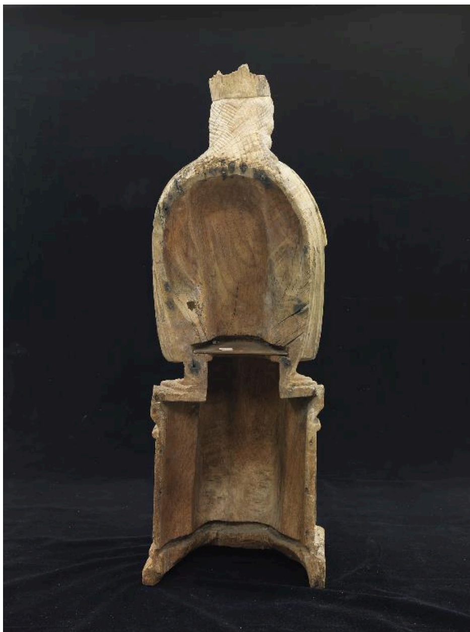
Vue du revers creux.