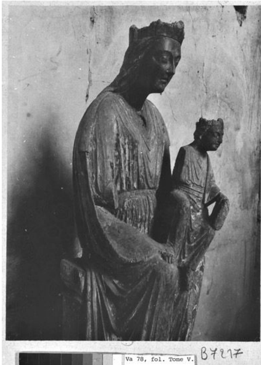
Détail de la partie supérieure. (BNF. Topo Va 78, fol. tome V. B 7217). Photographie.