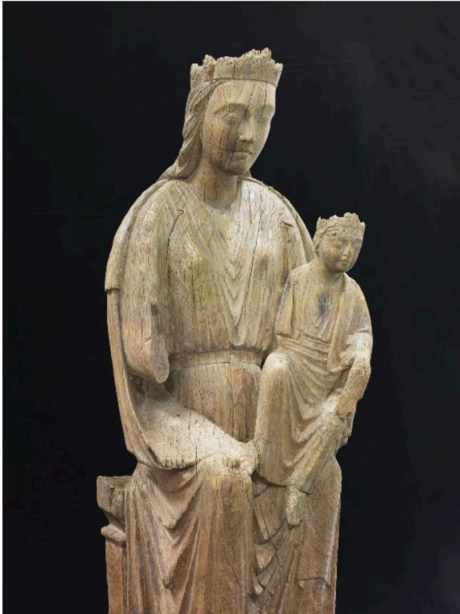
Vue rapprochée de la Vierge et de l'Enfant.