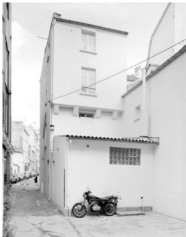
Face postérieure. IVR11_19869400308V