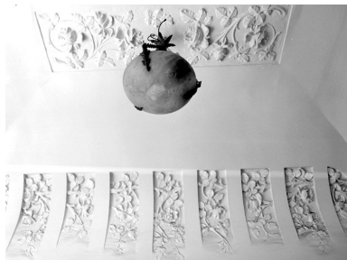
Face antérieure. IVR11_19869400309X