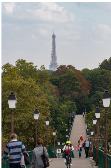
Vue de la passerelle de l'Avre IVR11_20249200435NUC4A