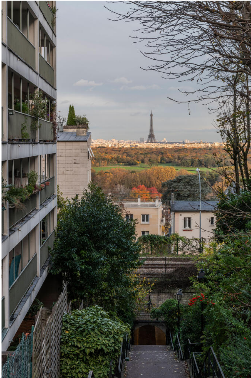
Vue vers le Bois de Boulogne, Paris et la Tour Eiffel depuis l'avenue Alphonse Moguez