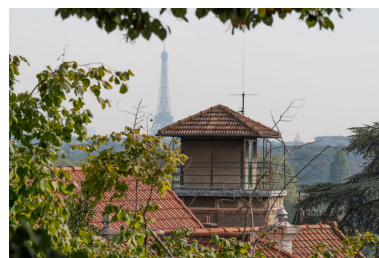
Vue vers Paris depuis la terrasse de l'église Notre-Dame des Airs