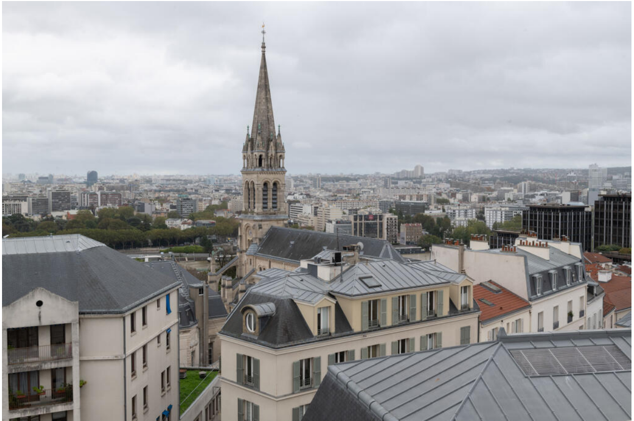
Vue de Saint-Cloud depuis l'hôpital des Quatre-Villes : église Saint-Clodoald