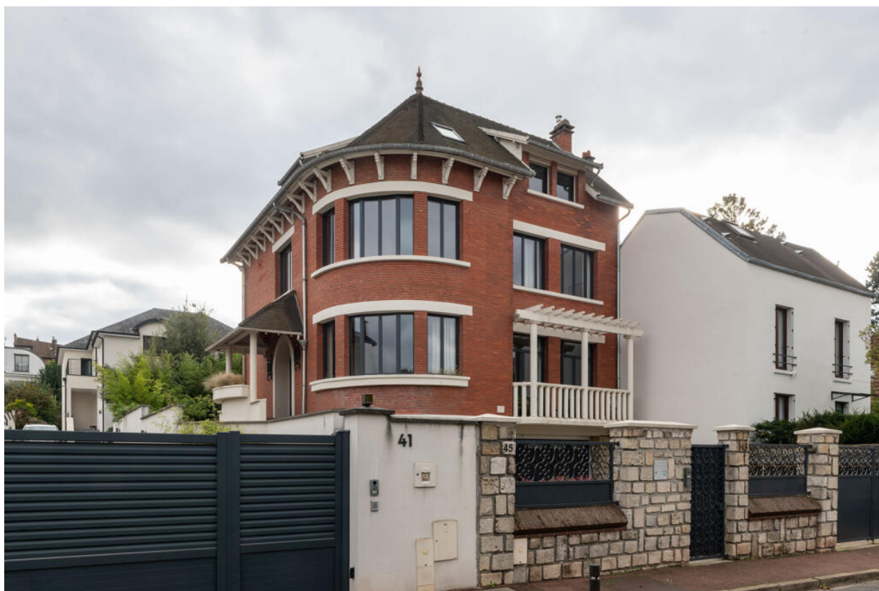
Maison construite à partir de 1951 par l'architecte René Tanalias