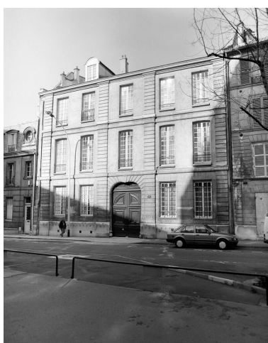
Immeuble du XVIIe siècle, façade principale IVR11_19969200759X