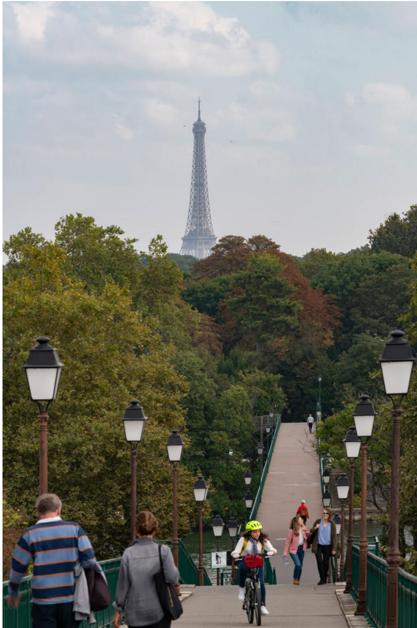
Vue de la passerelle de l'Avre