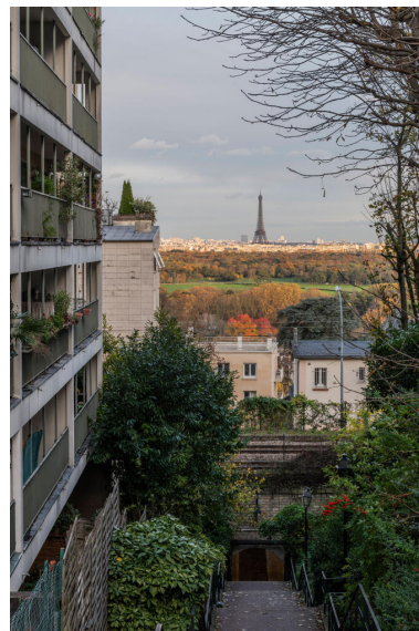
Vue vers le Bois de Boulogne, Paris et la Tour Eiffel depuis l'avenue Alphonse Moguez IVR11_20249200884NUC4A