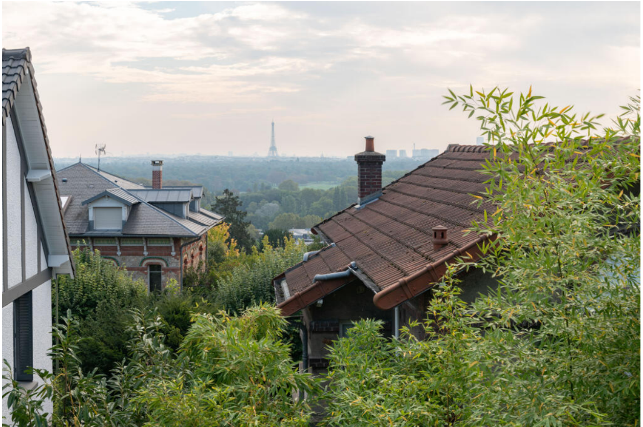
Vue vers Paris depuis la passerelle de la gare du Val d'Or