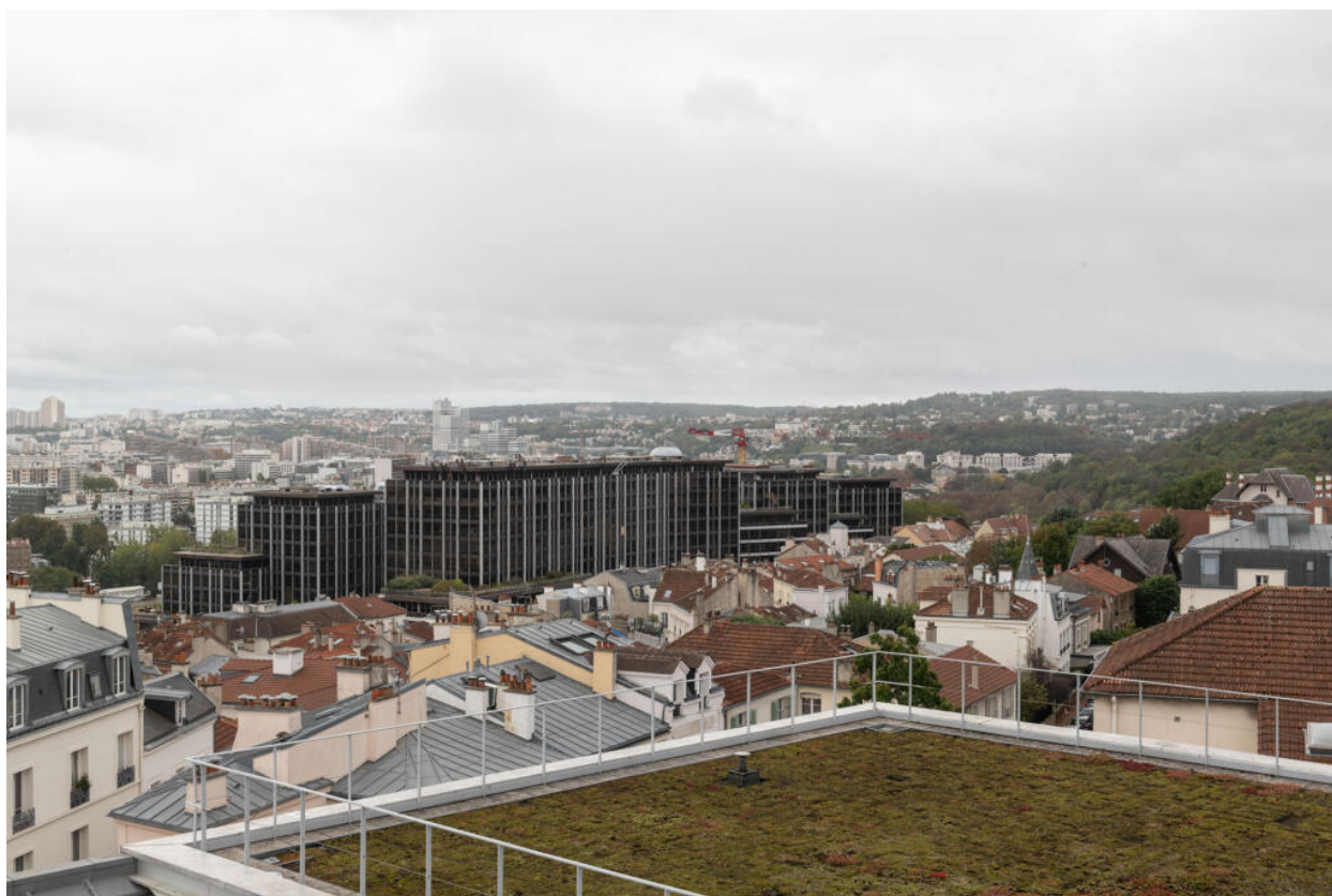
Vue de Saint-Cloud depuis l'hôpital des Quatre-Villes : les Bureaux de la Colline