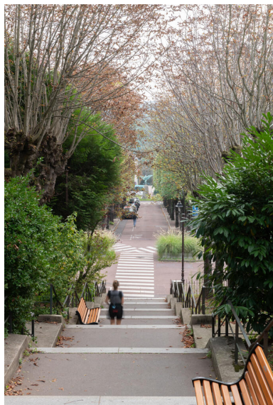
Escaliers de l'avenue de Longchamp IVR11_20249200484NUC4A