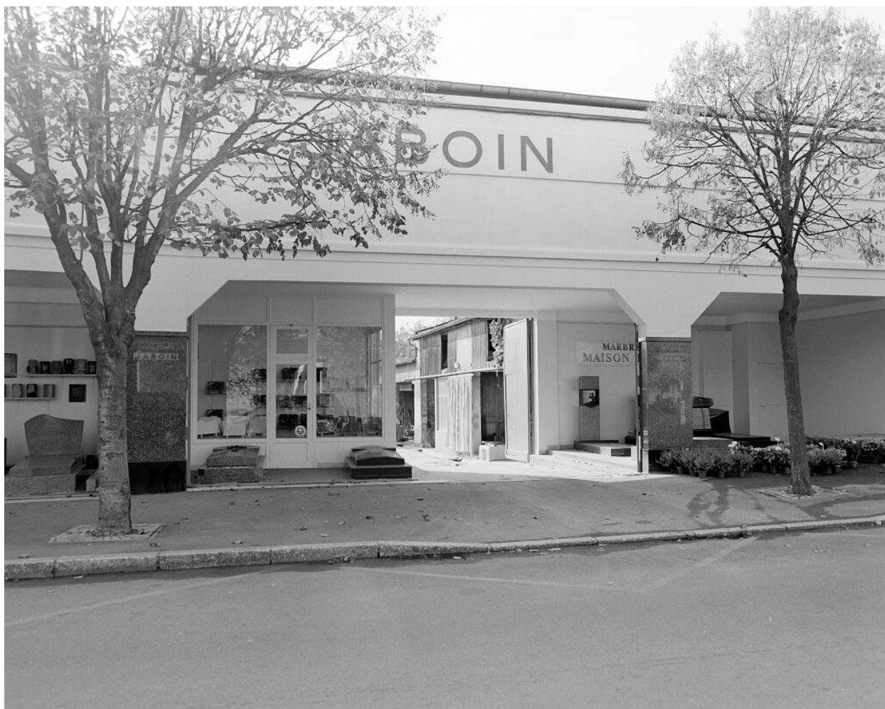
Marbrerie Jaboin, devanture construite en 1937