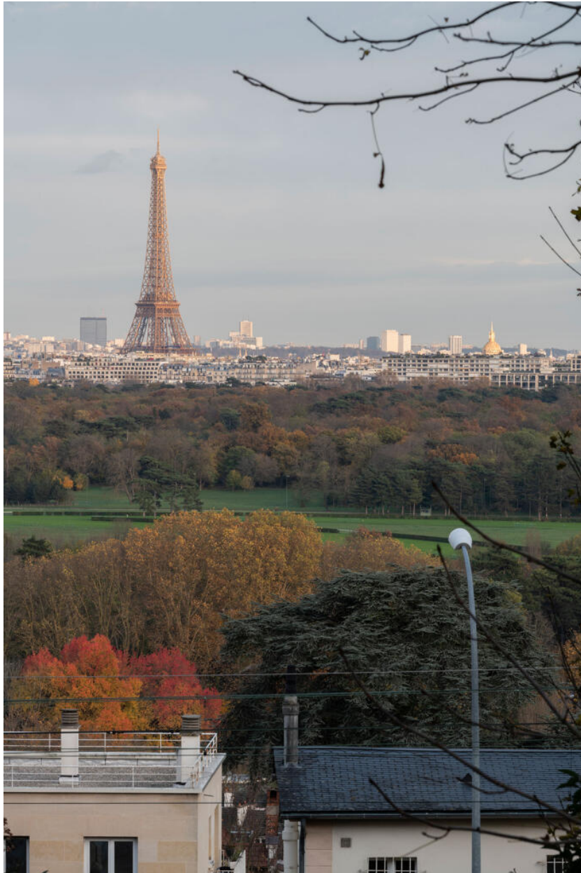
Vue vers Paris et la Tour Eiffel depuis l'avenue Alphonse Moguez