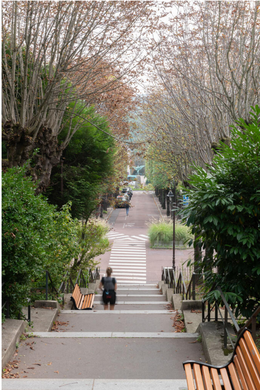
Escaliers de l'avenue de Longchamp