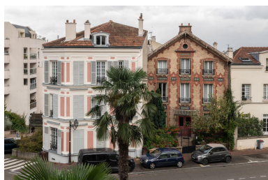
Vue de la place Charles- de-Gaulle depuis la mairie