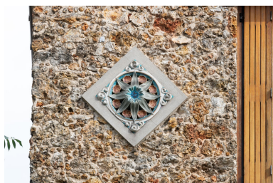
Décor en céramique : fleuron émaillé IVR11_20249200624NUC4A