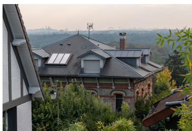
Vue vers Paris depuis la passerelle de la gare du Val d'Or IVR11_20249200467NUC4A