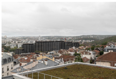
Vue de Saint-Cloud depuis l'hôpital des Quatre-Villes : les Bureaux de la Colline IVR11_20249200598NUC4A