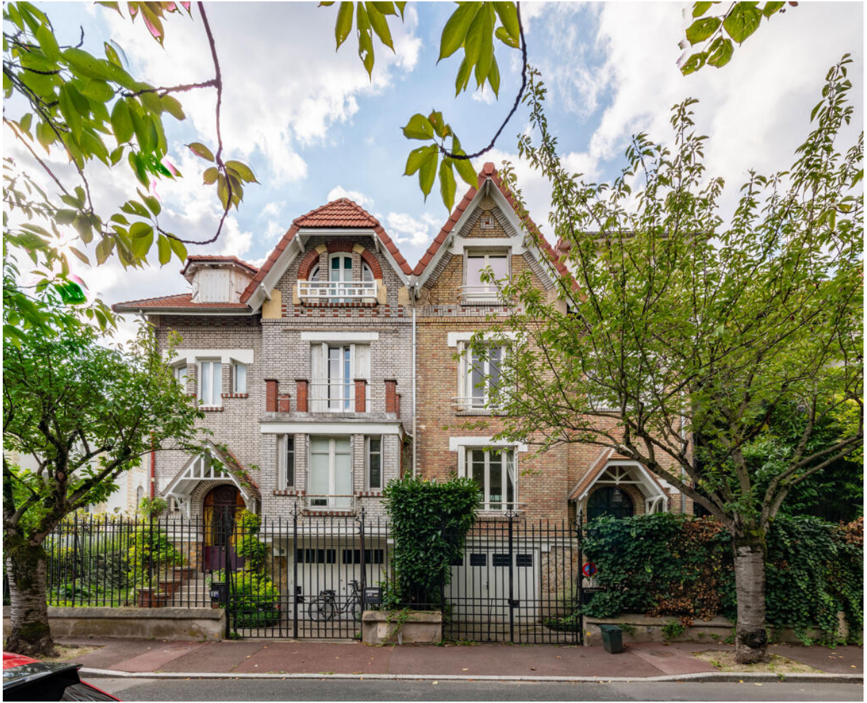
Maisons mitoyennes en brique du début du XXe siècle au coteau de Saint-Cloud