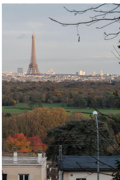
Vue vers Paris et la Tour Eiffel depuis l'avenue Alphonse Moguez IVR11_20249200885NUC4A