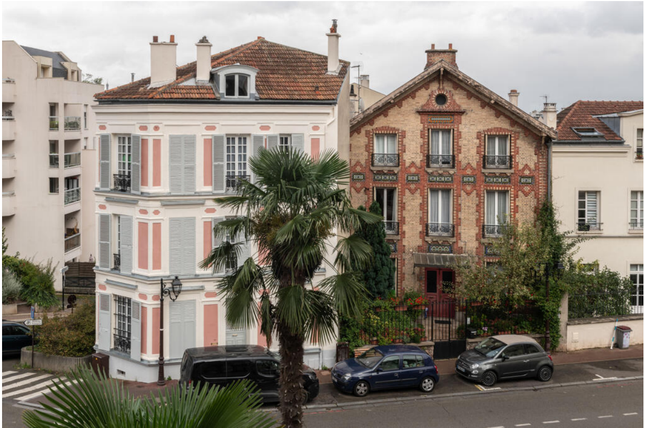
Vue de la place Charles-de-Gaulle depuis la mairie