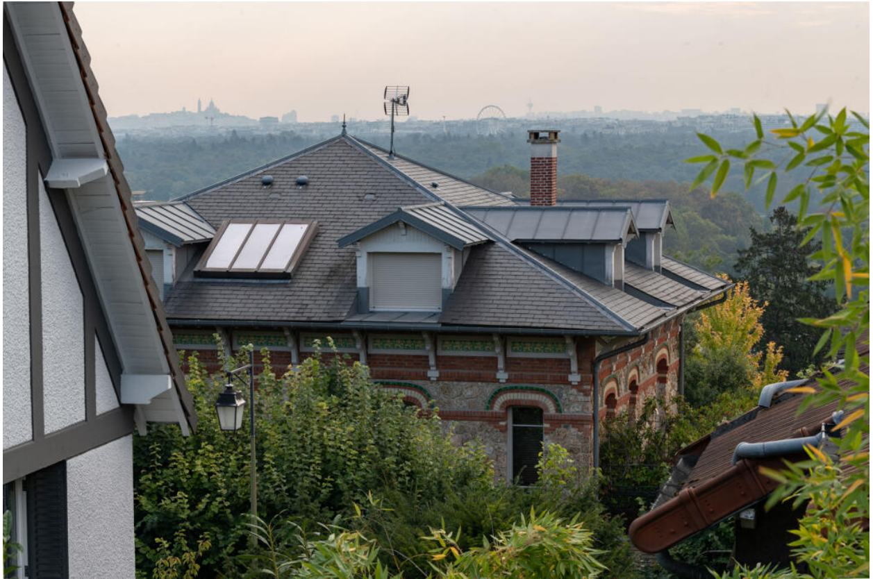
Vue vers Paris depuis la passerelle de la gare du Val d'Or