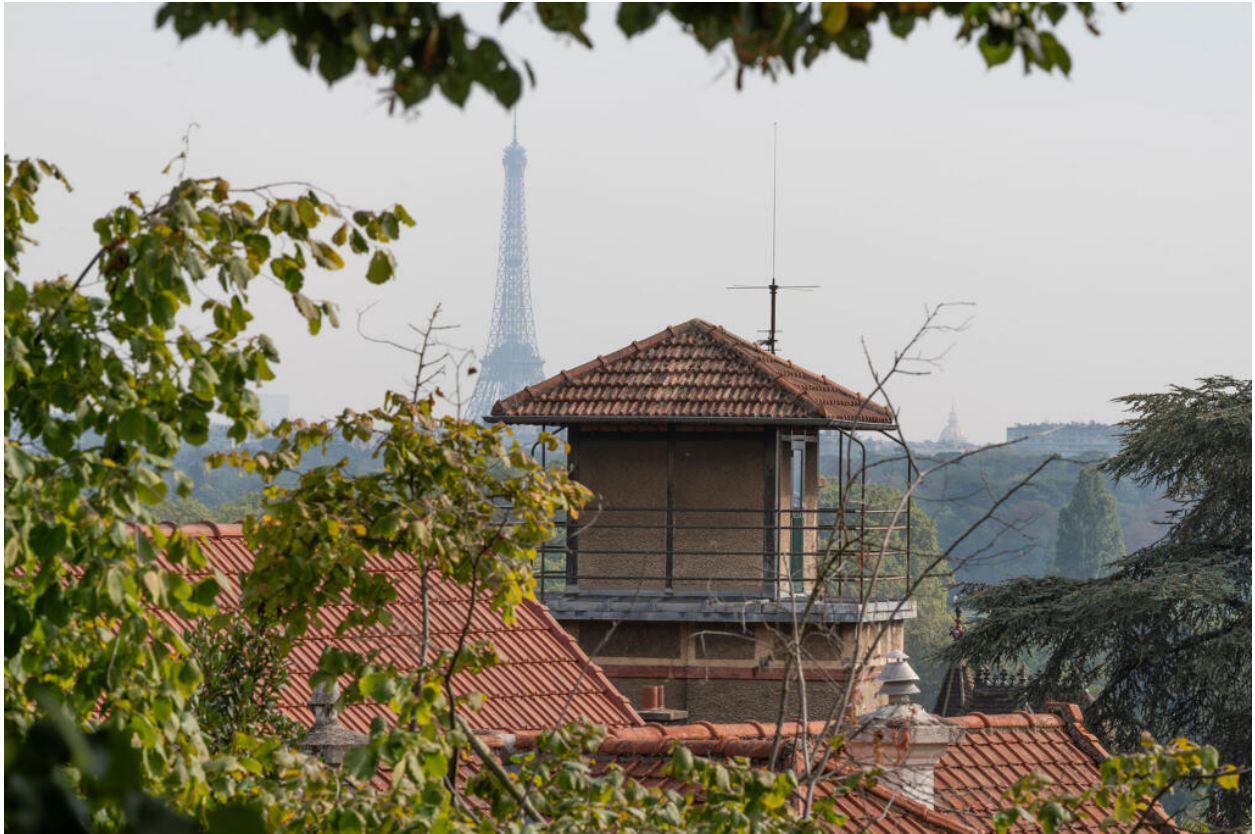
Vue vers Paris depuis la terrasse de l'église Notre-Dame des Airs