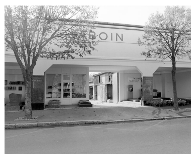
Marbrerie Jaboin, devanture construite en 1937 IVR11_19969200955X