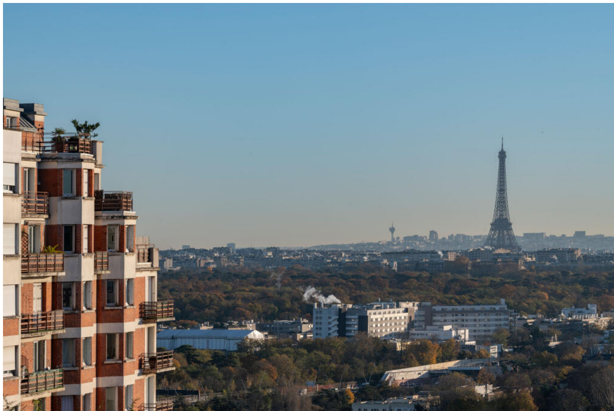
Vue vers Paris et la Tour Eiffel depuis le haut de la gare de saint-Cloud (av Pozzo di Borgo)