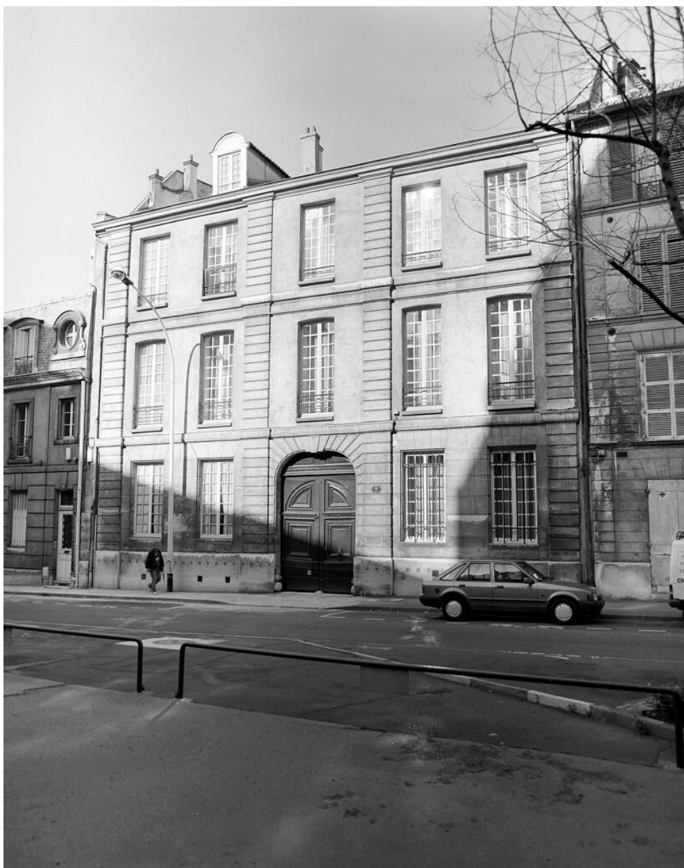
Immeuble du XVIIe siècle, façade principale