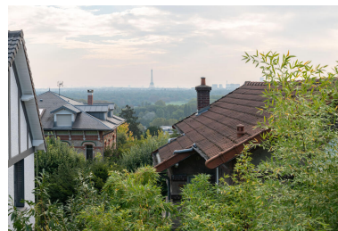
Vue vers Paris depuis la passerelle de la gare du Val d'Or IVR11_20249200466NUC4A