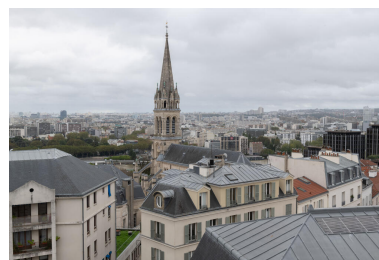
Vue de Saint-Cloud depuis l'hôpital des Quatre-Villes : église Saint-Clodoald IVR11_20249200595NUC4A