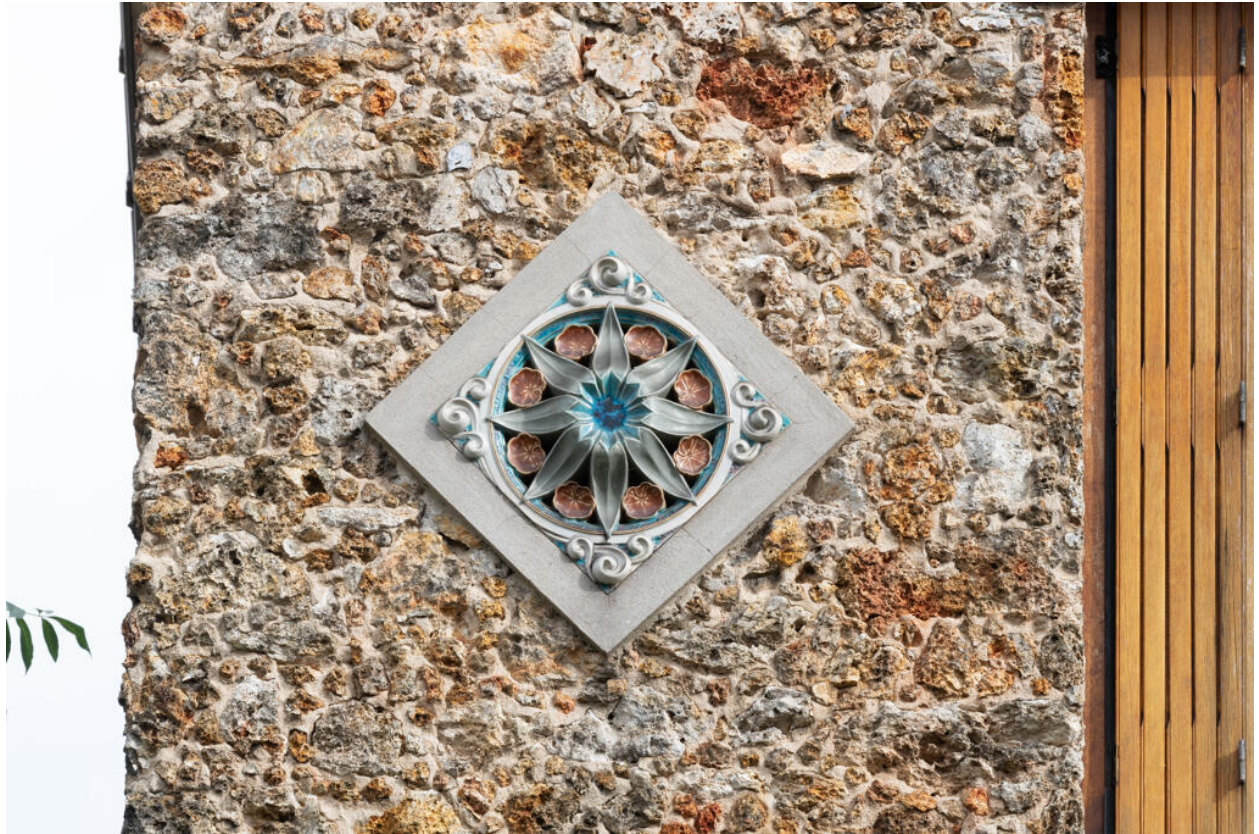
Décor en céramique : fleuron émaillé