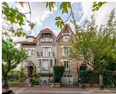
Maisons mitoyennes en brique du début du XXe siècle au coteau de Saint-Cloud IVR11_20249200450NUC4A