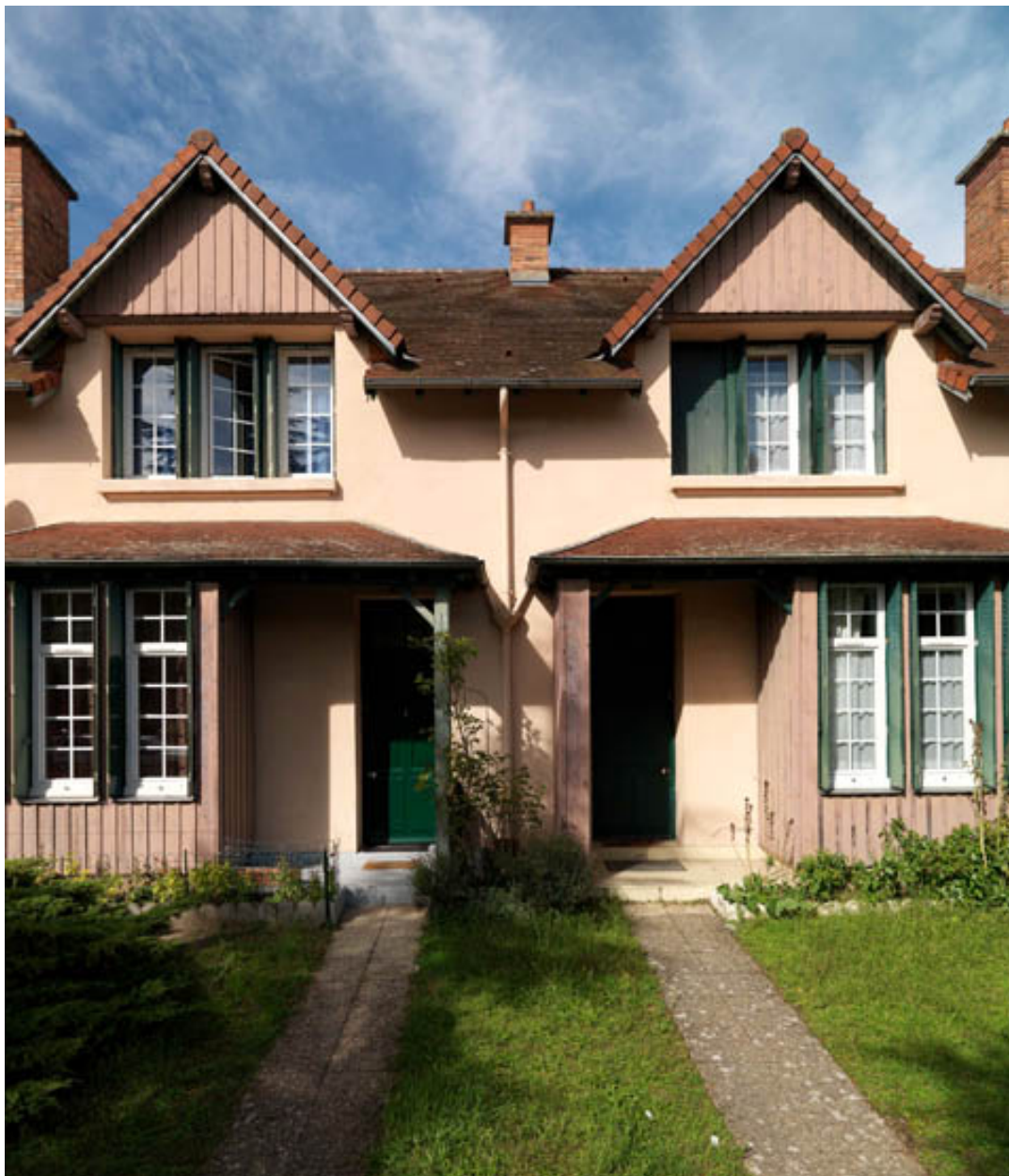
Rue de la Libération. Logements locatifs sur deux niveaux construits en 1912-1913. Décrochement des toits, tuiles plates, avancées, pignon bardés de bois.