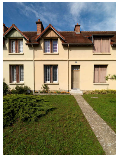
Rue de la Libération. Logements locatifs sur deux niveaux construits en 1912-1913.