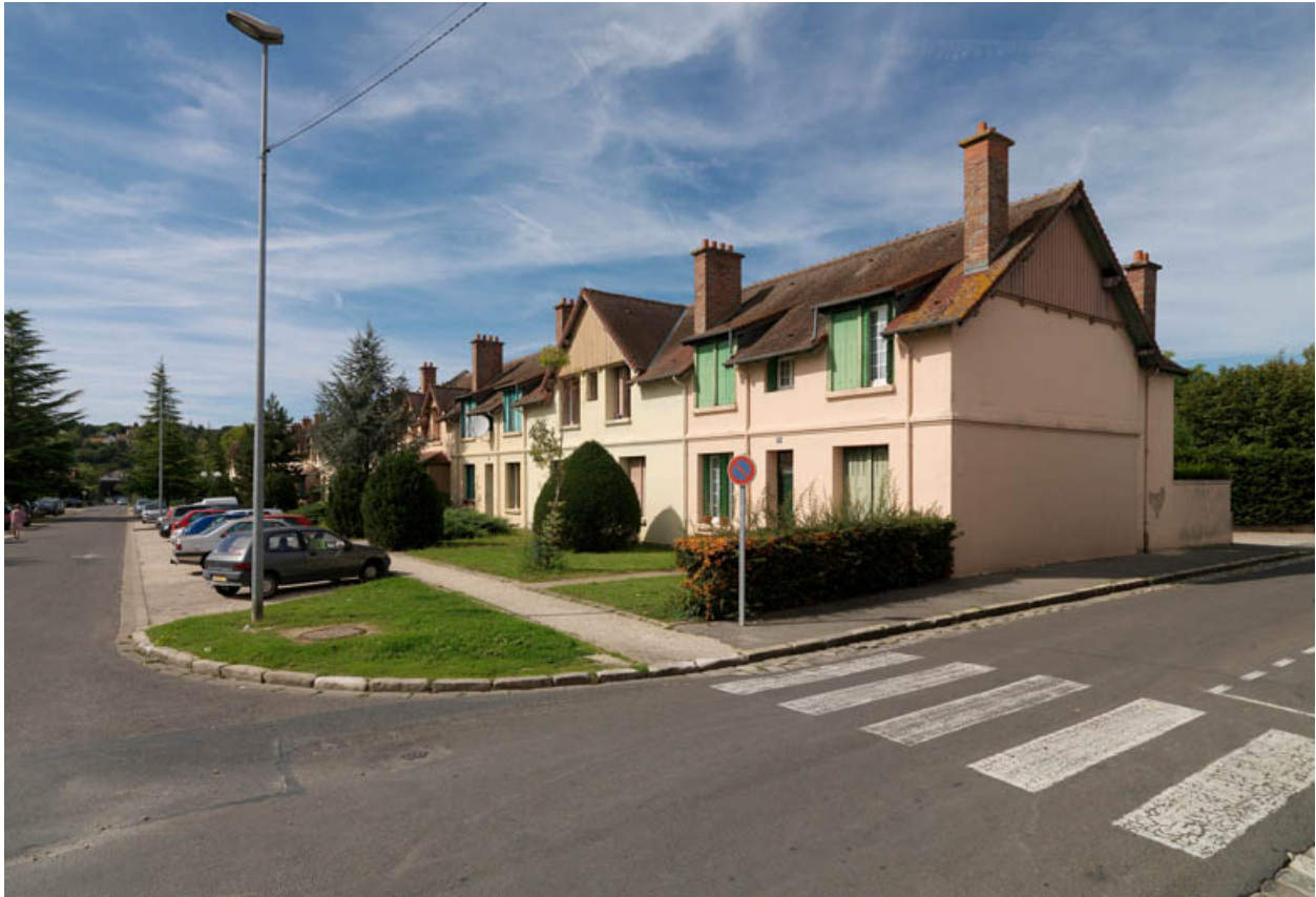
Logements locatifs sur deux niveaux construits en 1912-1913 réhabilités en 1984 par l'office HLM.