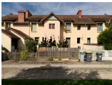
Rue de la Libération. Logements locatifs sur deux niveaux construits en 1912-1913.