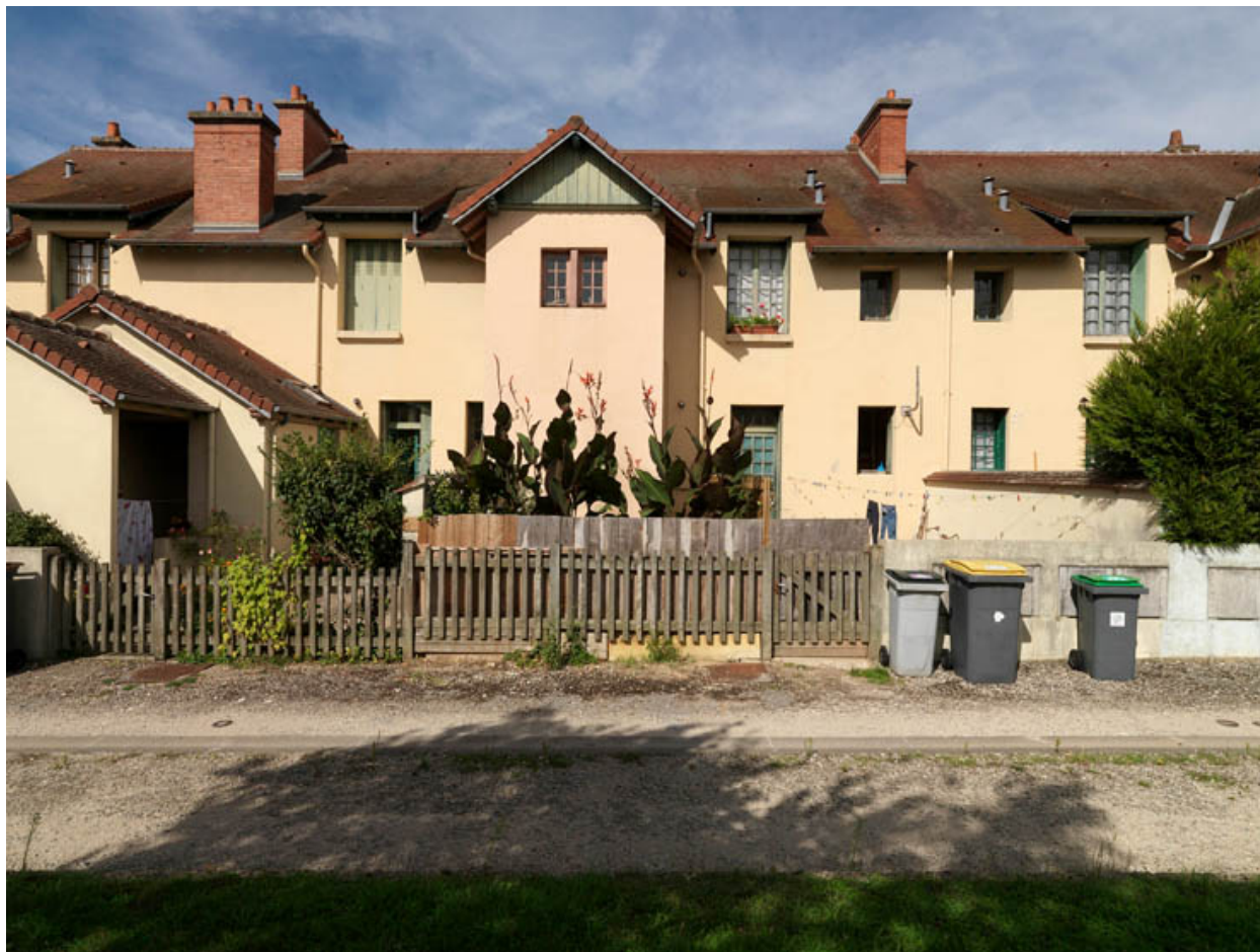
Rue de la Libération. Logements locatifs sur deux niveaux construits en 1912-1913.