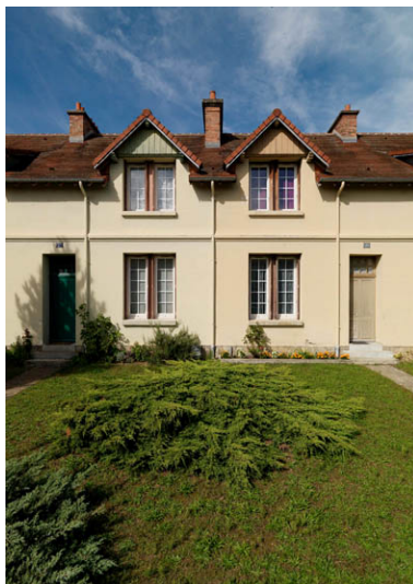
Rue de la Libération. Logements locatifs sur deux niveaux construits en 1912-1913.