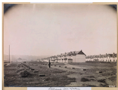
Photo ancienne de la construction du lotissement. IVR11_20117700314NUC4A