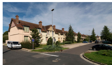
Rue de la Libération. Logements locatifs sur deux niveaux construits en 1912-1913 réhabilités en 1984 par l'office HLM.