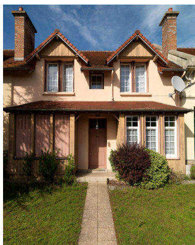
Rue de la Libération. Logements locatifs sur deux niveaux construits en 1912-1913. Décrochement des toits, tuiles plates, avancées.