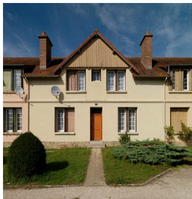
Rue de la Libération. Logements locatifs sur deux niveaux construits en 1912-1913. Décrochement des toits, tuiles plates pignon bardés de bois.