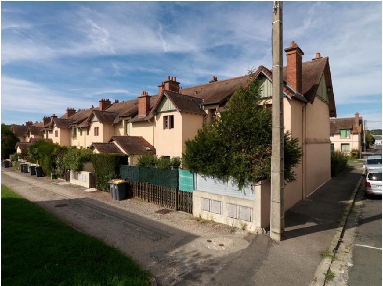
Rue de la Libération. Logements locatifs sur deux niveaux construits en 1912-1913.