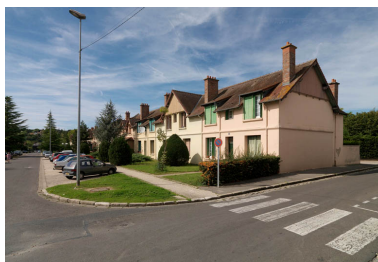
Logements locatifs sur deux niveaux construits en 1912-1913 réhabilités en 1984 par l'office HLM.