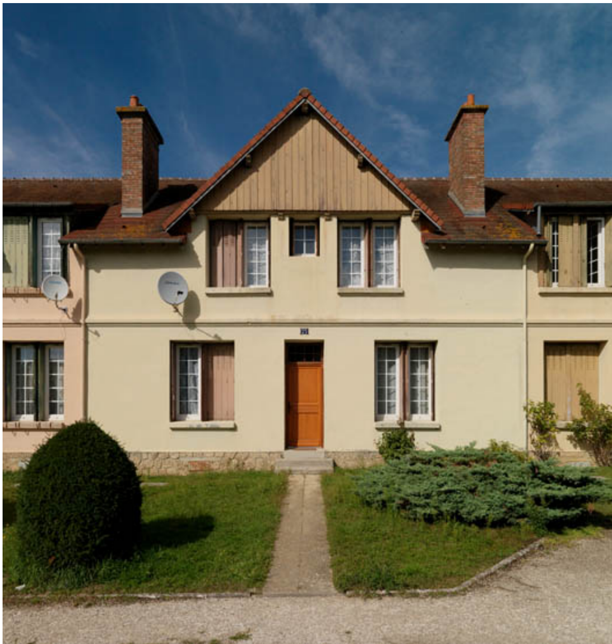
Rue de la Libération. Logements locatifs sur deux niveaux construits en 1912-1913. Décrochement des toits, tuiles plates pignon bardés de bois.