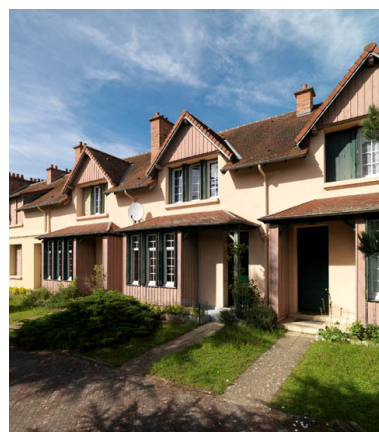
Rue de la Libération. Logements locatifs sur deux niveaux construits en 1912-1913.