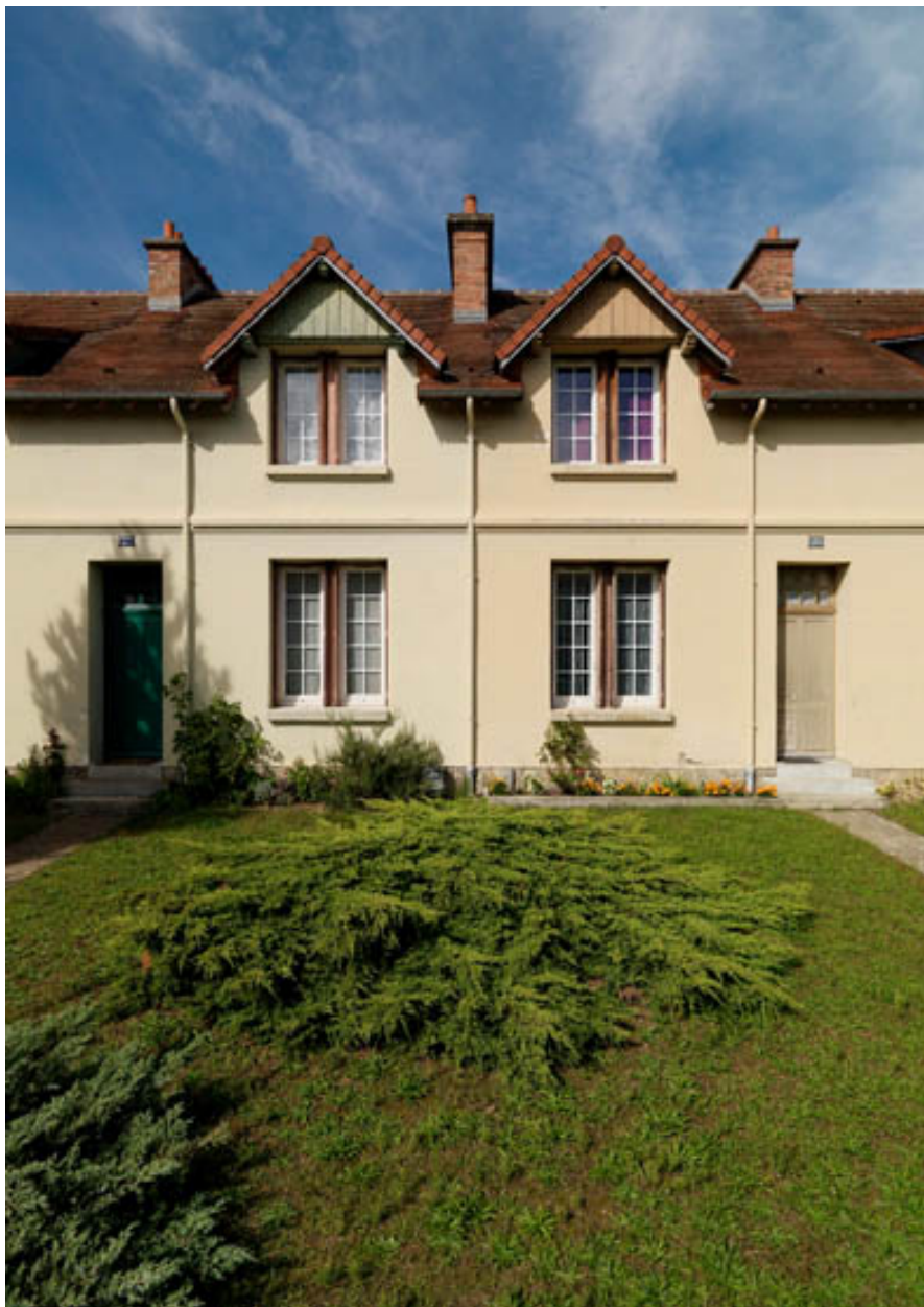
Rue de la Libération. Logements locatifs sur deux niveaux construits en 1912-1913.