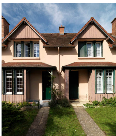
Rue de la Libération. Logements locatifs sur deux niveaux construits en 1912-1913.