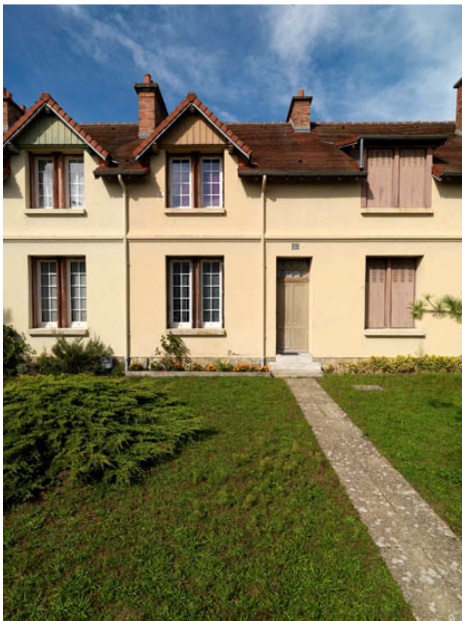
Rue de la Libération. Logements locatifs sur deux niveaux construits en 1912-1913.