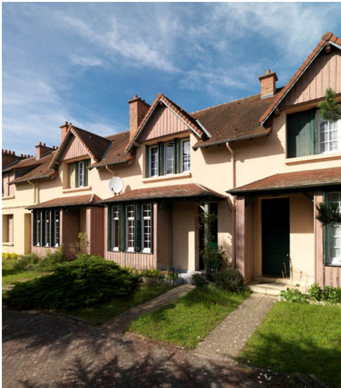
Rue de la Libération. Logements locatifs sur deux niveaux construits en 1912-1913. Décrochement des toits, tuiles plates, avancées, pignon bardés de bois.