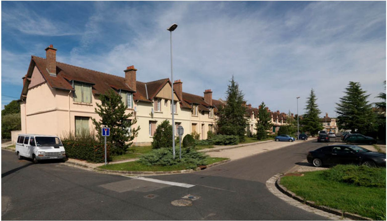
Rue de la Libération. Logements locatifs sur deux niveaux construits en 1912-1913 réhabilités en 1984 par l'office HLM.