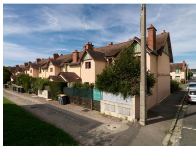
Rue de la Libération. Logements locatifs sur deux niveaux construits en 1912-1913.