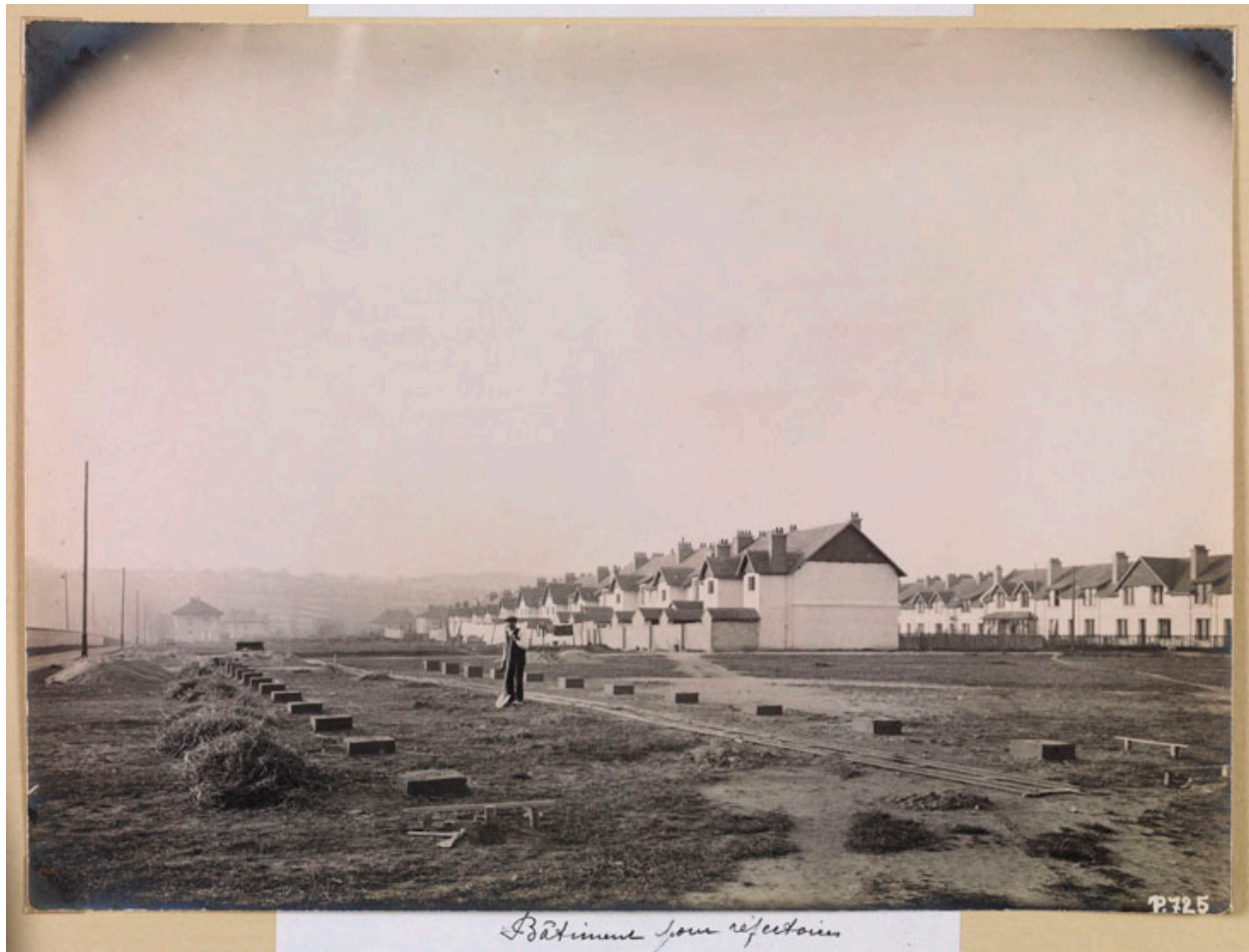
Photo ancienne de la construction du lotissement.