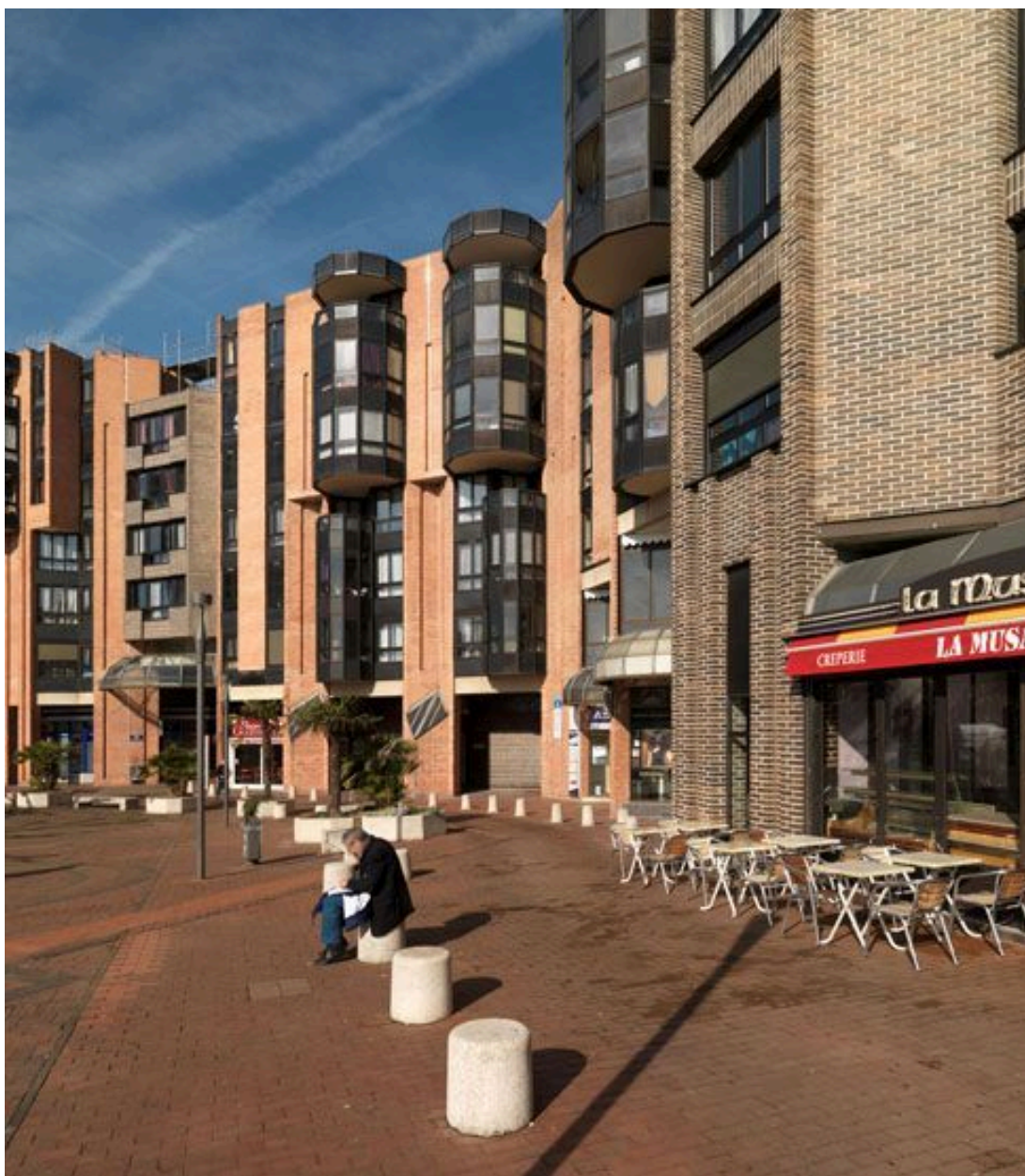
Vue d'ensemble des immeubles sur la Grand'Place.