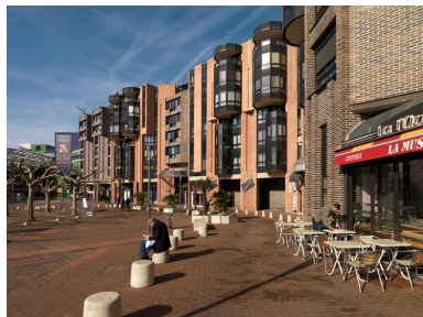
Vue d'ensemble des immeubles de la Grand'Place aux n°3, 6, 9 et 12. IVR11_20129500318NUC4A