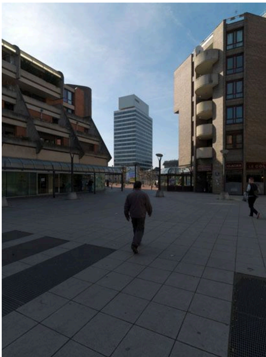
Vue d'ensemble du parvis donnant sur la Grand'Place.