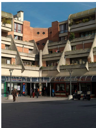
Vue d'ensemble des immeubles sur le square donnant sur la Grand'Place.