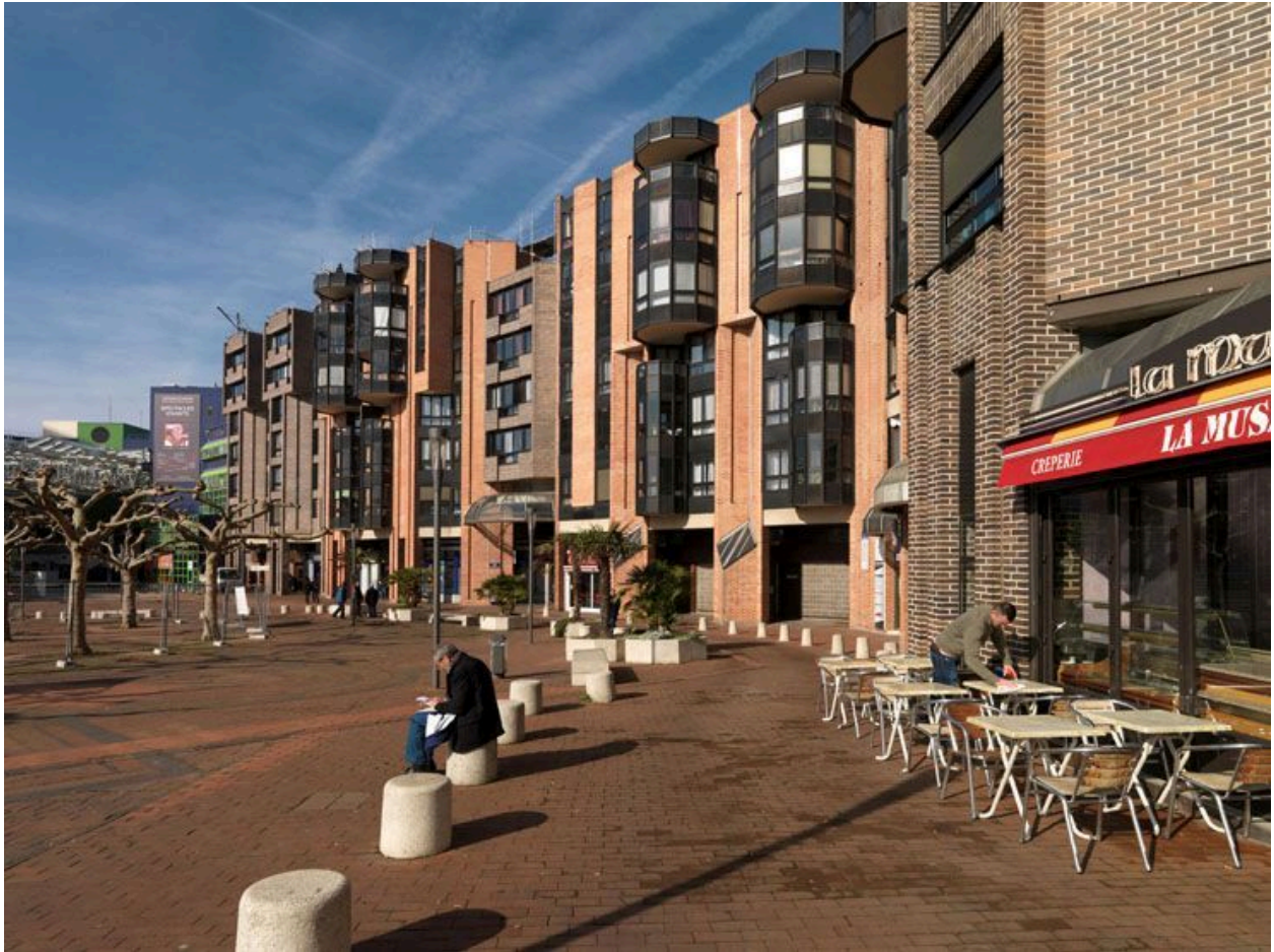
Vue d'ensemble des immeubles de la Grand'Place aux n°3, 6, 9 et 12.