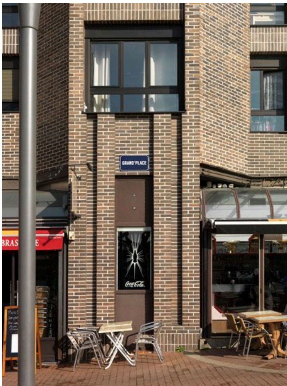
Détail d'un immeuble avec la plaque "Grand'Place."