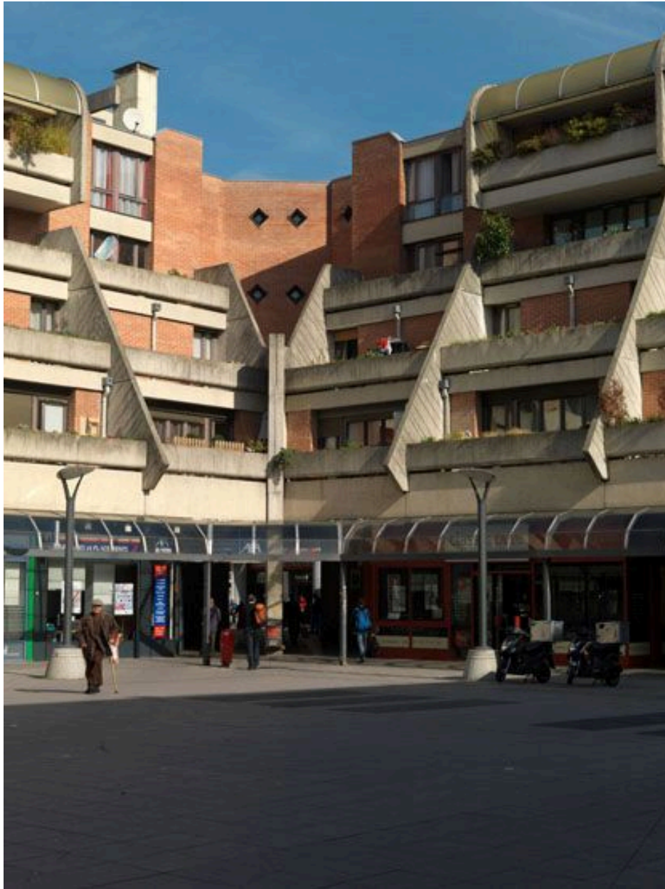
Vue d'ensemble des immeubles sur le square donnant sur la Grand'Place.