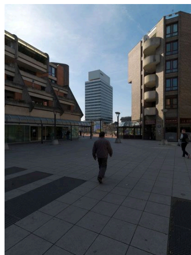
Vue d'ensemble du parvis donnant sur la Grand'Place. IVR11_20129500324NUC4A