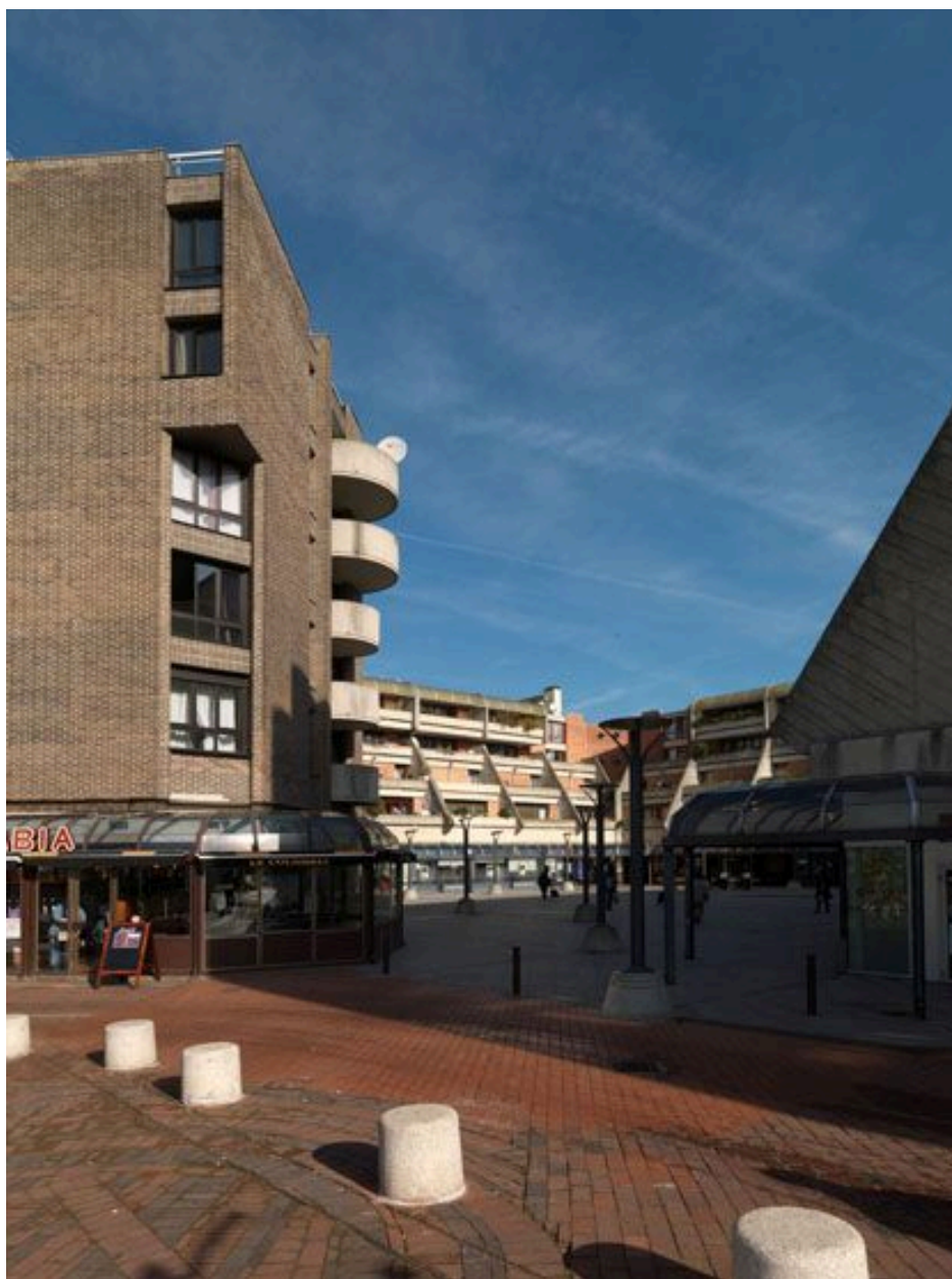
Détail du traitement de l'angle de l'immeuble bordant la Grand'Place.