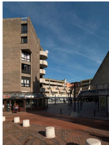
Détail du traitement de l'angle de l'immeuble bordant la Grand'Place.