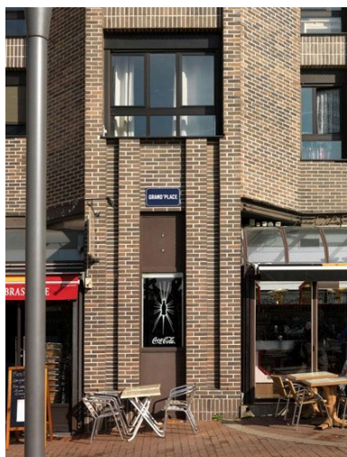
Détail d'un immeuble avec la plaque "Grand'Place". IVR11_20129500322NUC4A