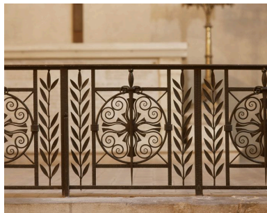
Détail d'un panneau. IVR11_20067800716XA