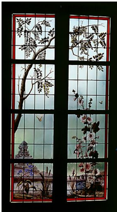
Vue d'ensemble. IVR11_19869400401XA