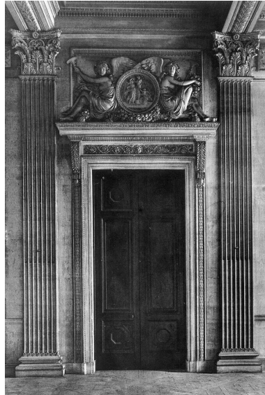
Vue d'ensemble de la porte surmontée du bas-relief des Renommées.