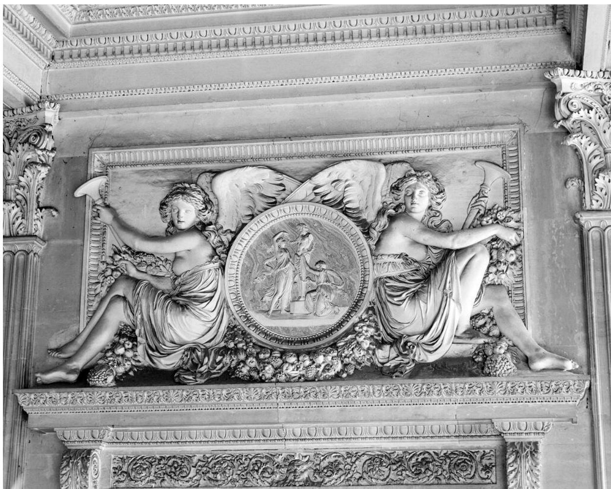
Salle à manger d'été du comte d'Artois. Bas-relief au-dessus de la porte : les renommées.