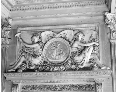
Salle à manger d'été du comte d'Artois. Bas-relief au-dessus de la porte : les renommées.