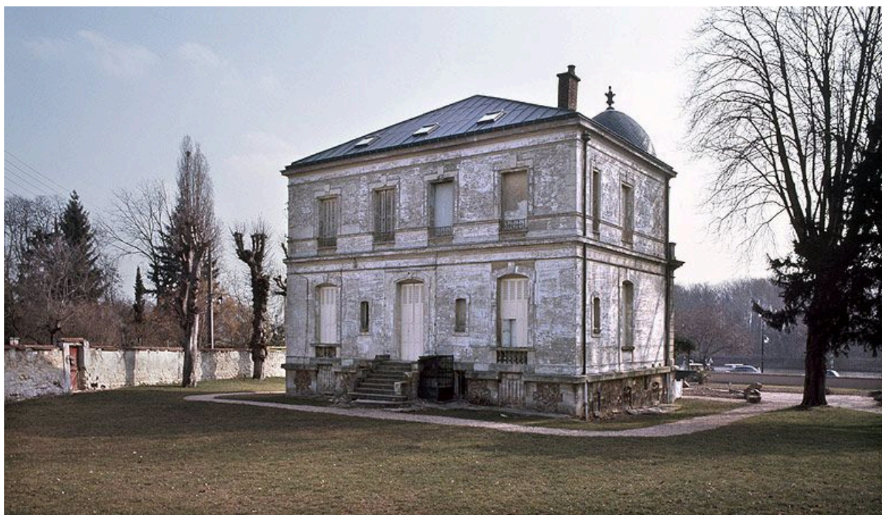
La façade postérieure.