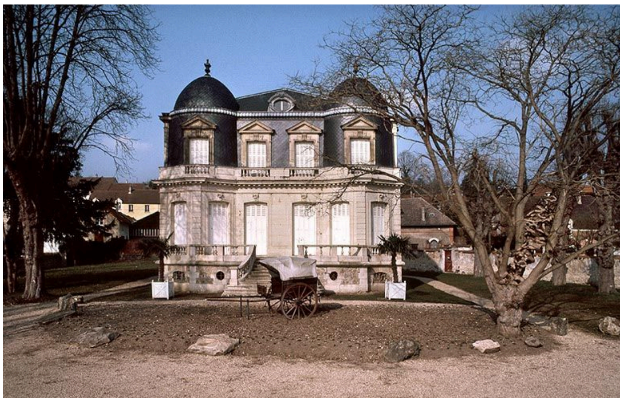
La façade principale, tournée vers la Seine.