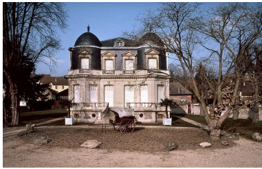
La façade principale, tournée vers la Seine.