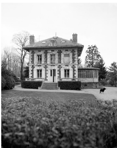
Vue d'ensemble, façade antérieure. IVR11_19907800036X