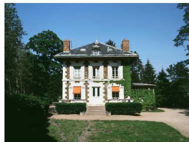
Vue d'ensemble, façade antérieure. IVR11_19997800585XA