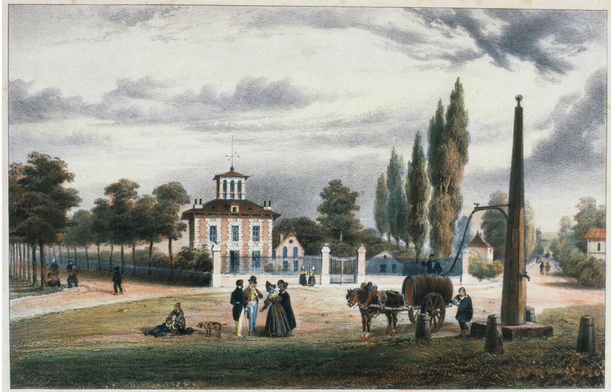
Vue d'ensemble, d'après Pingret, 1838. Lithographie. (AM Maisons-Laffitte, fonds Masson).