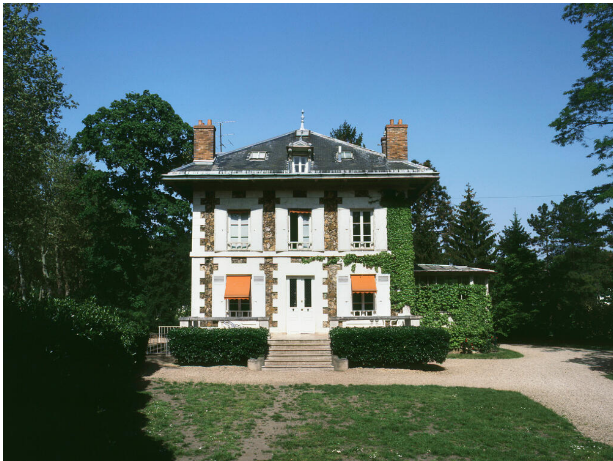
Vue d'ensemble, façade antérieure.