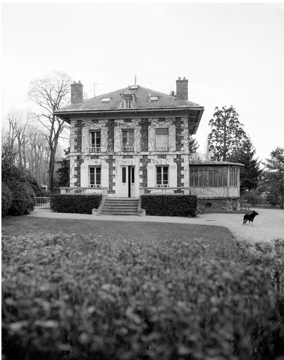
Vue d'ensemble, façade antérieure.