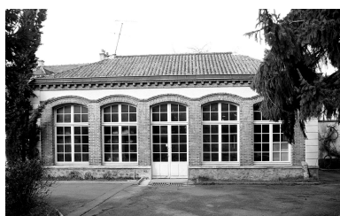
L'orangerie. IVR11_20007800123X