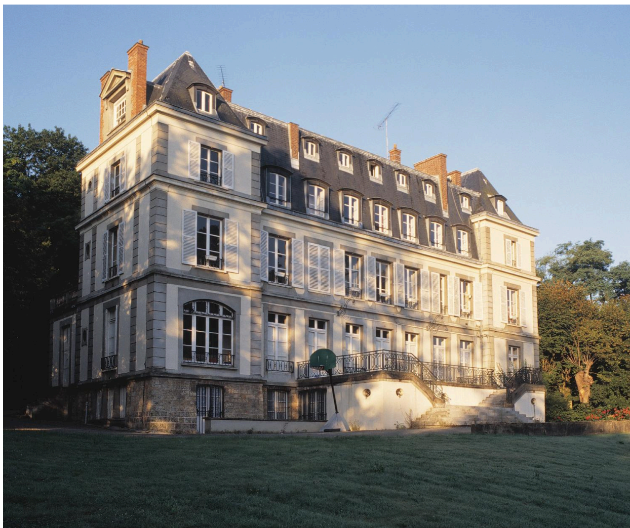
La façade sur jardin.