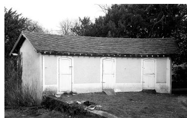
Vue de l'écurie à ânes.