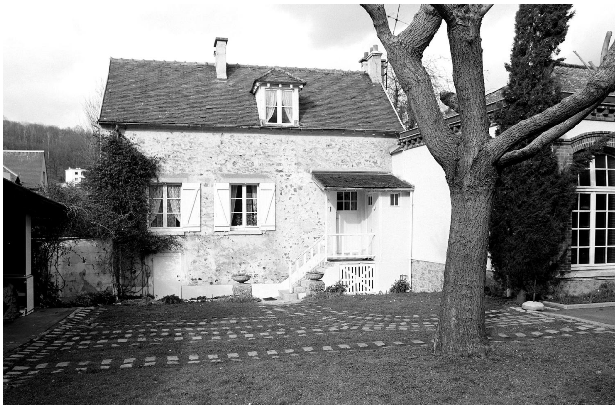
Vue de la maison de jardinier.