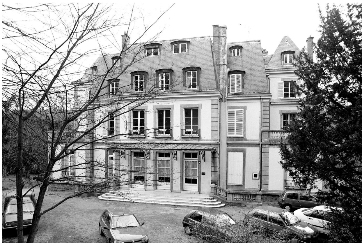
Vue de la façade antérieure.