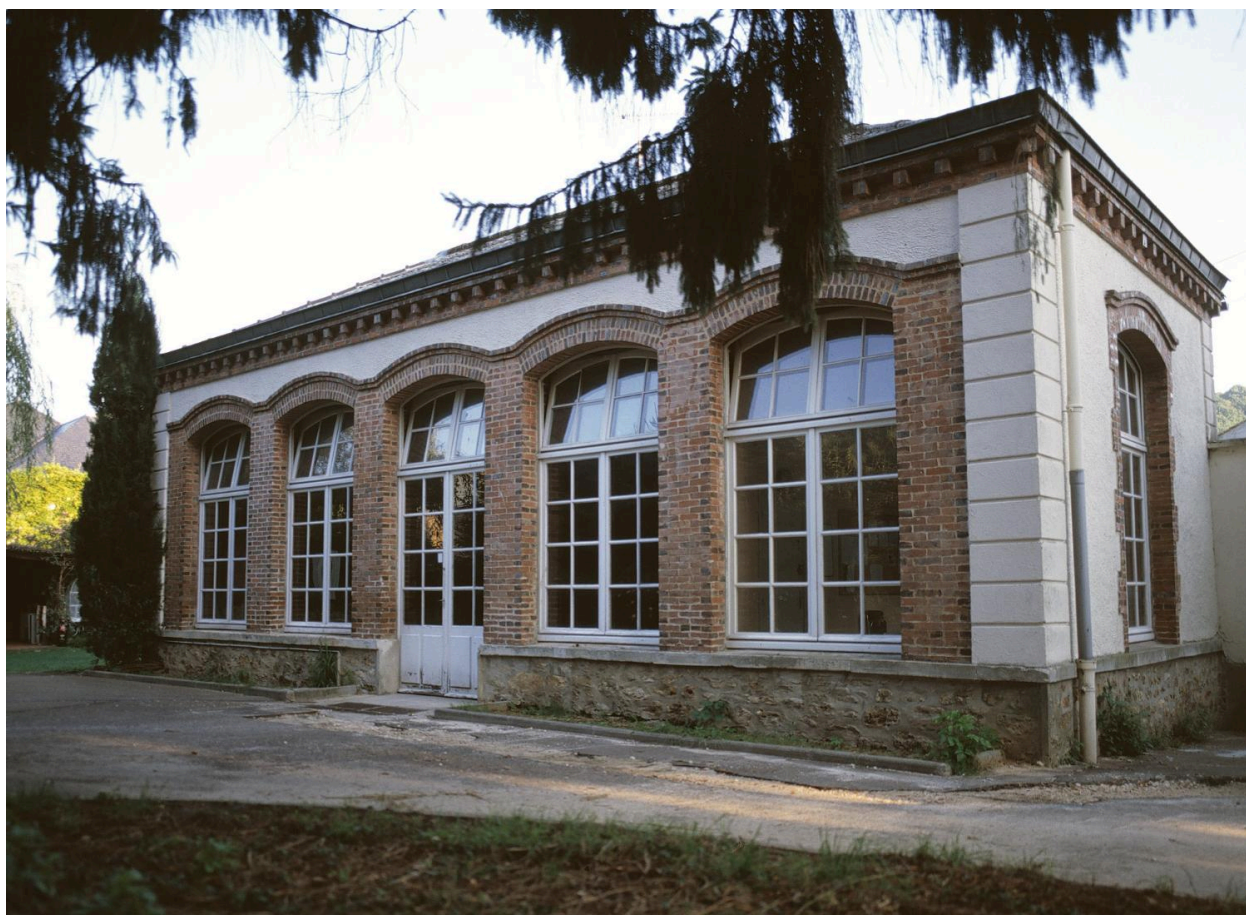
Vue de l'orangerie.