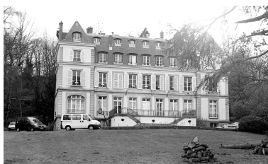
Vue de la façade sur jardin.