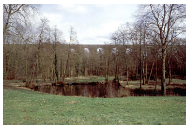
L'étang. A l'arrière plan, l'aqueduc.