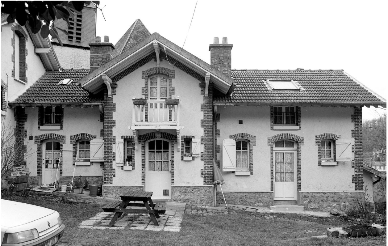
La maison du gardien.