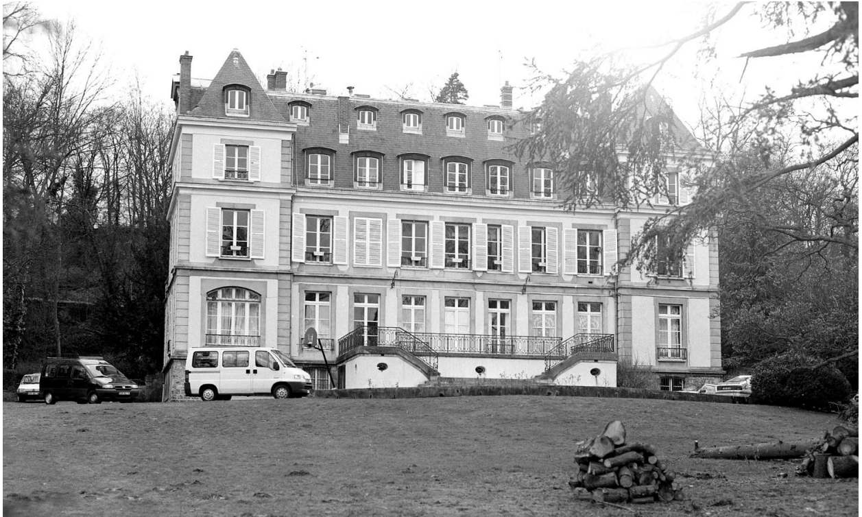
Vue de la façade sur jardin.