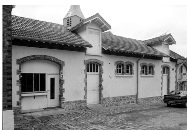
Les anciens communs du château.