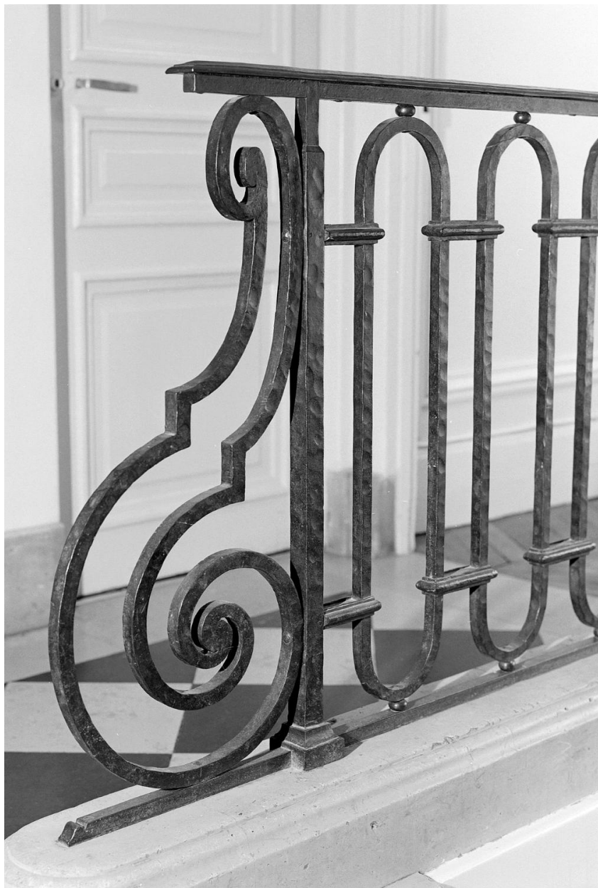
L'escalier principal : détail d'un des repos.