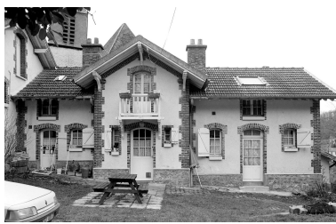
La maison du gardien.