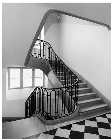
L'escalier principal. IVR11_20007800126X