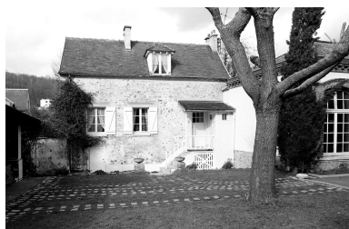
Vue de la maison de jardinier.