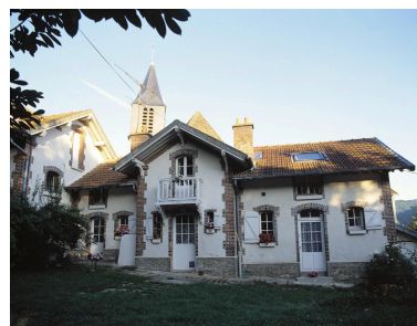
La maison du gardien.