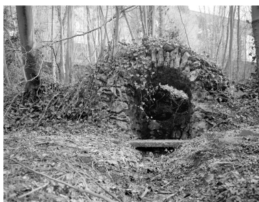
La source. IVR11_20007800132X