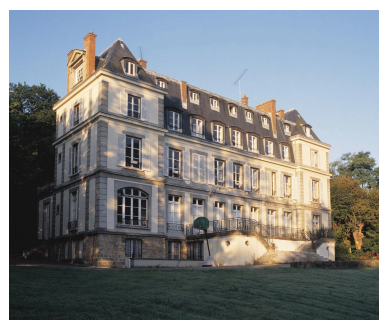
La façade sur jardin.