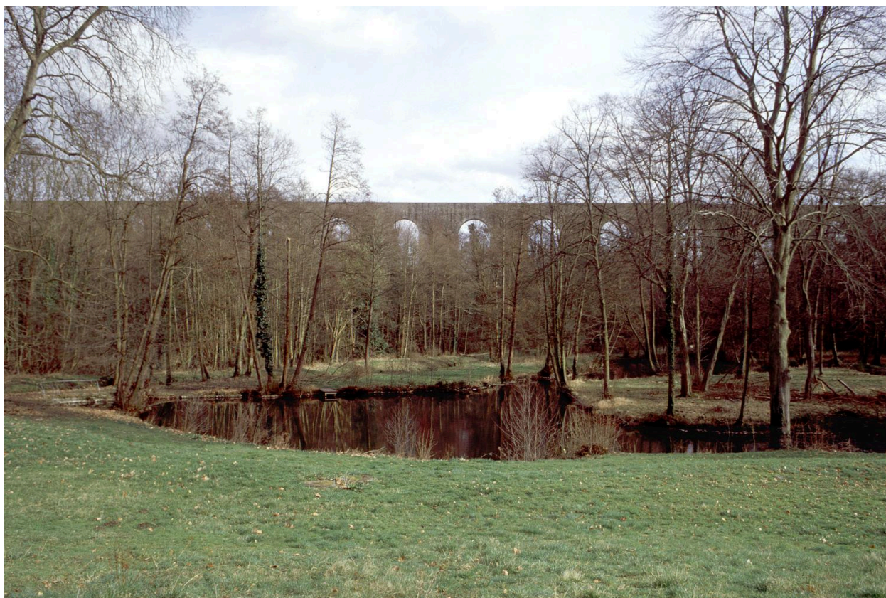
L'étang. A l'arrière plan, l'aqueduc.