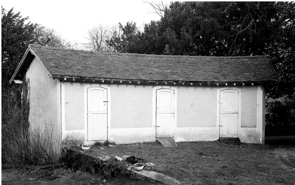
Vue de l'écurie à ânes.