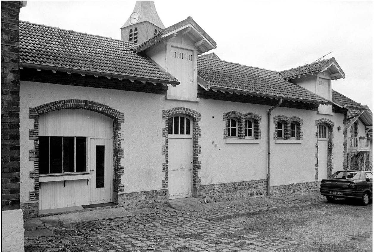
Les anciens communs du château.