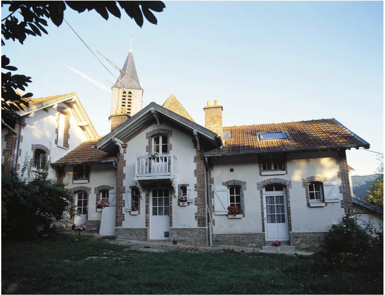
La maison du gardien.