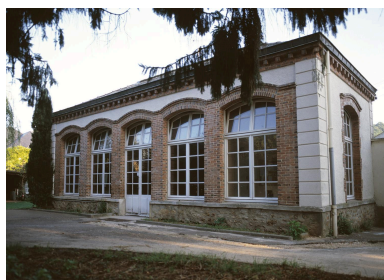
Vue de l'orangerie. IVR11_20017800024XA