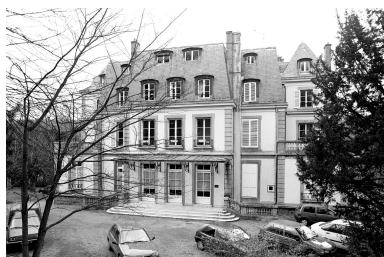
Vue de la façade antérieure. IVR11_20007800119X