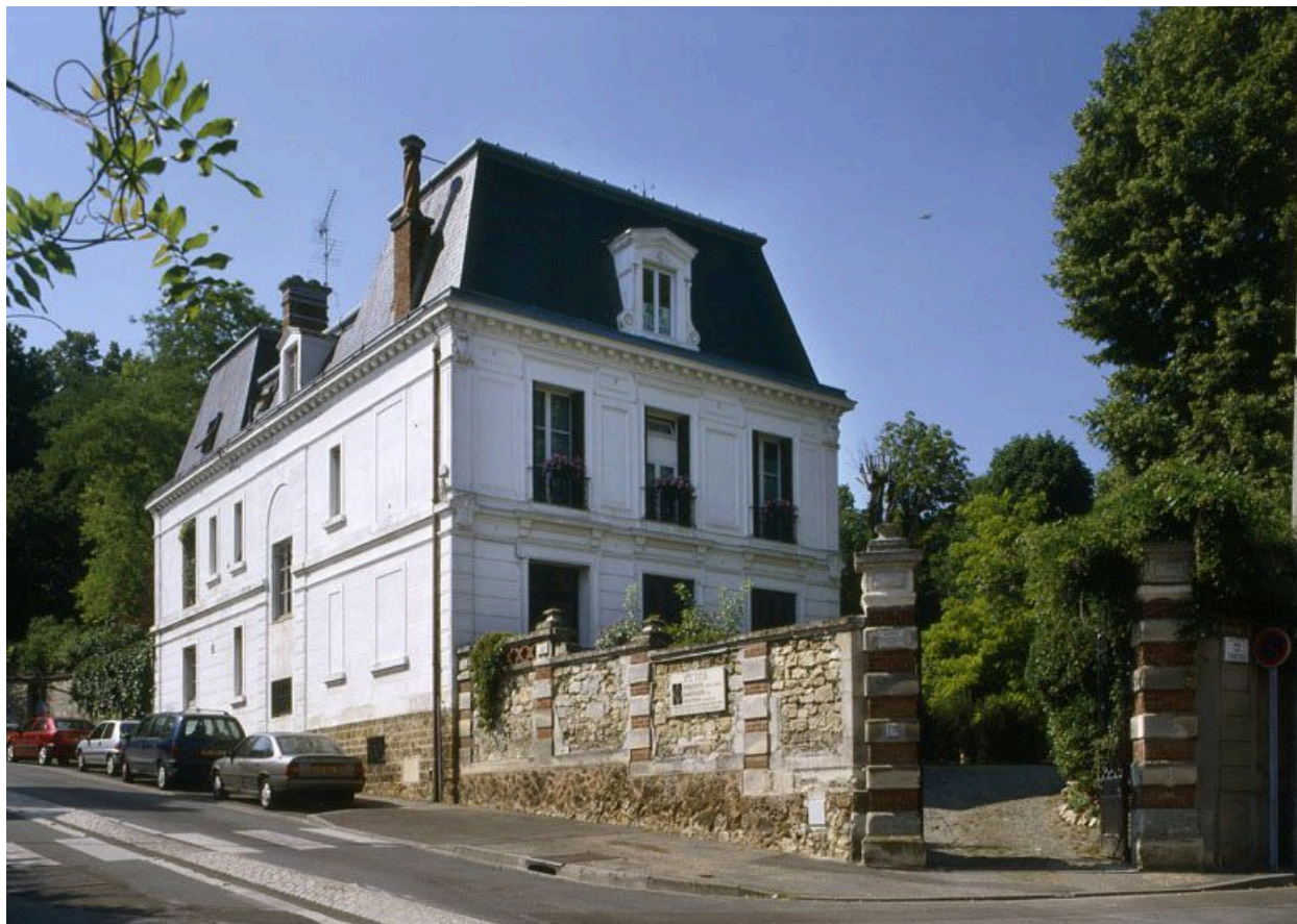
La façade sur rue.