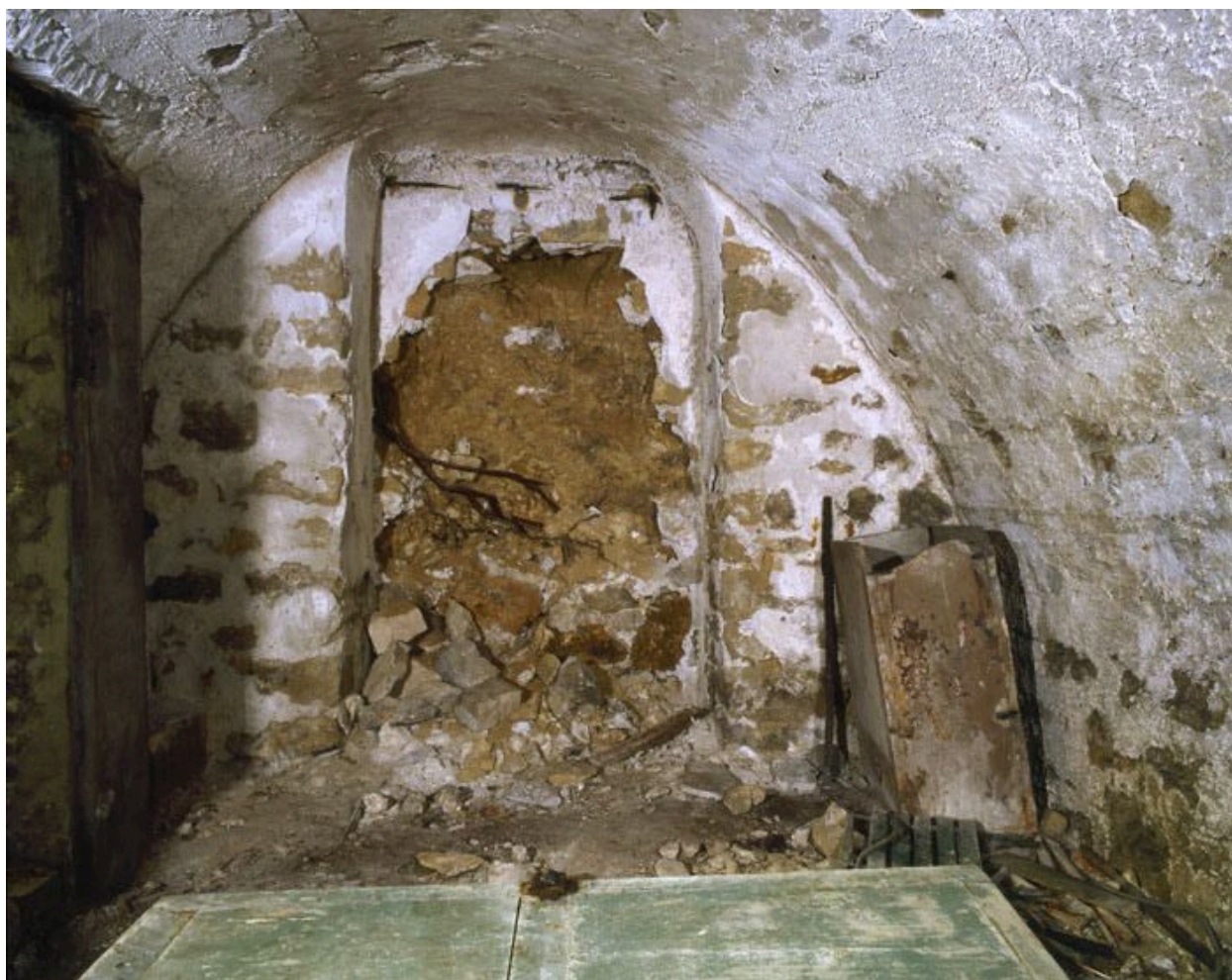
La cave voûtée partie murée.