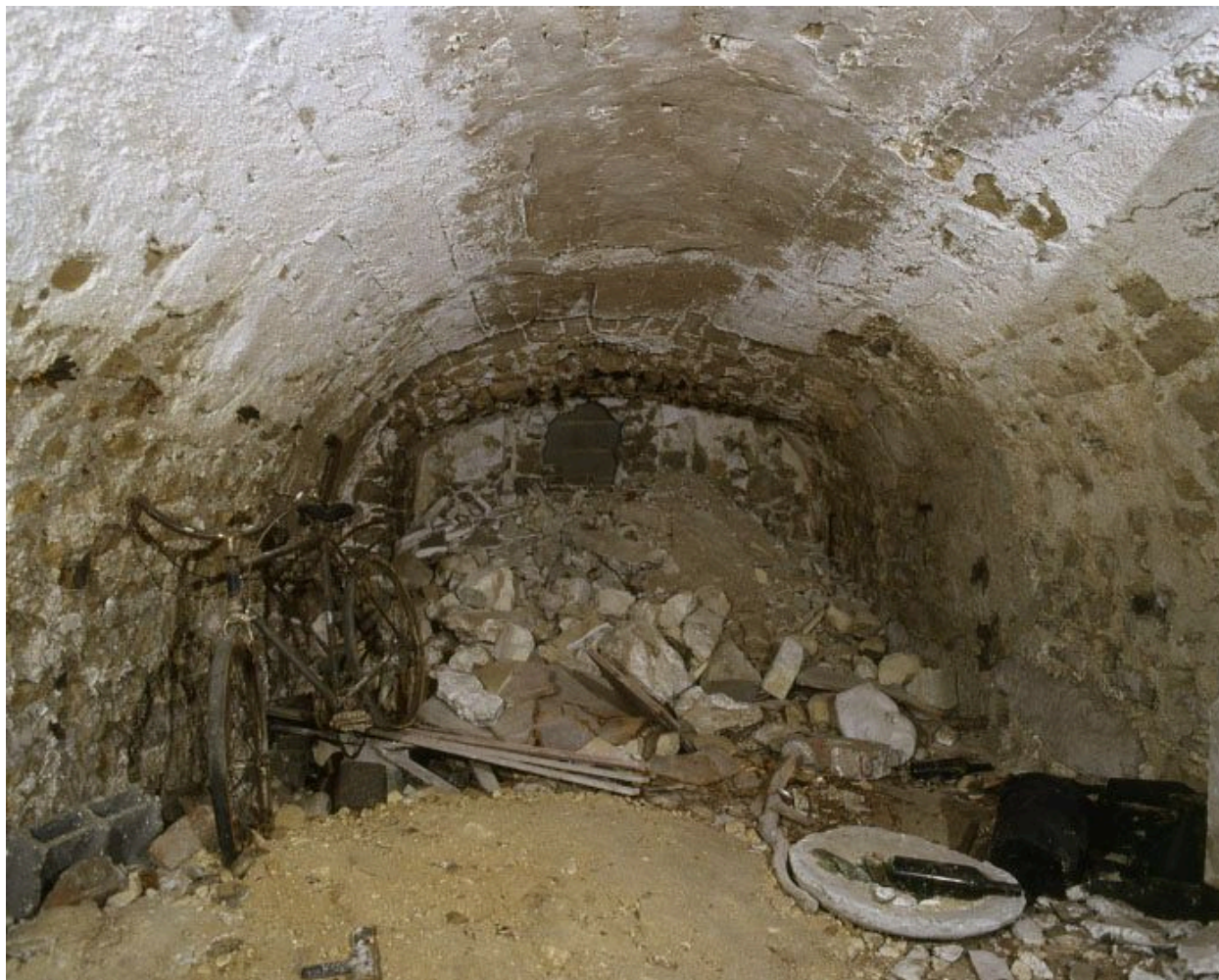
La cave voûtée dont une partie passe sous la rue des Courcieux.