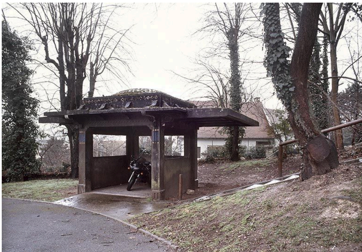
Vue d'ensemble du kiosque.