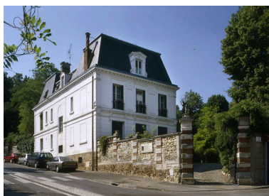
La façade sur rue. IVR11_20067800901XA

IVR11_20067801033NUCA