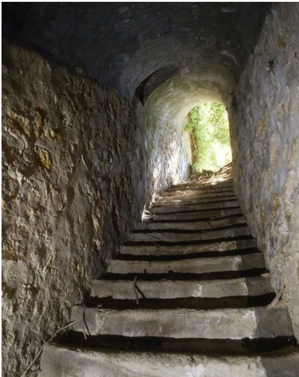
Descente de l'escalier conduisant à la cave isolée dans le jardin.