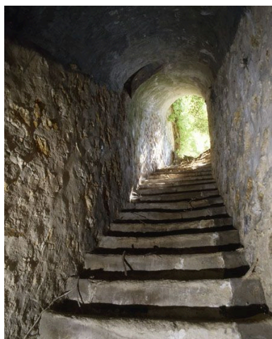
Descente de l'escalier conduisant à la cave isolée dans le jardin.

IVR11_20067800903XA