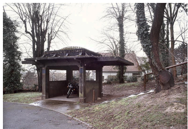
Vue d'ensemble du kiosque. IVR11_20067800138XA