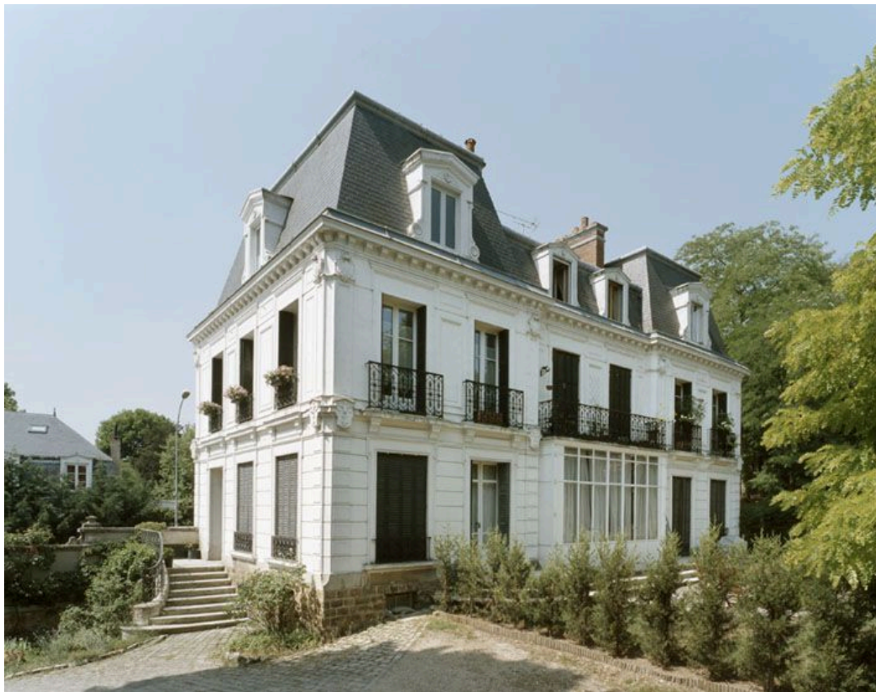
Façade principale sur le jardin.