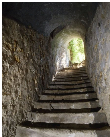
Descente de l'escalier conduisant à la cave isolée dans le jardin. IVR11_20067800903XA