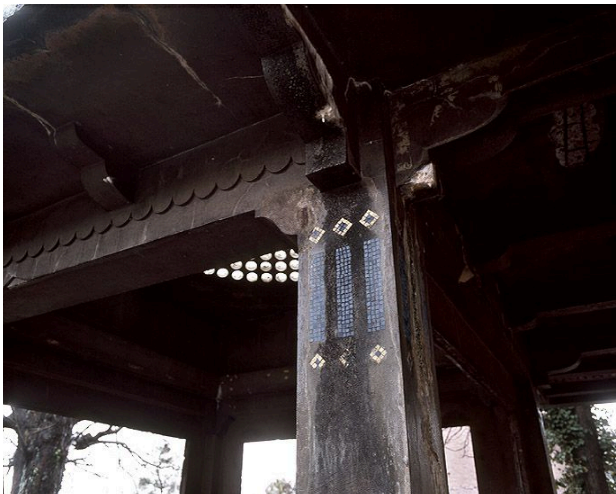
Détail du décor en mosaïque du kiosque.