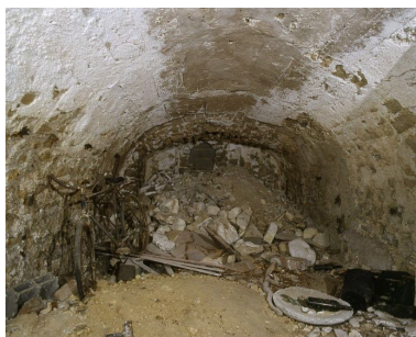
La cave voûtée dont une partie passe sous la rue des Courcieux.