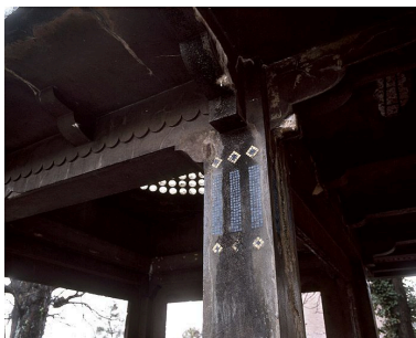
Détail du décor en mosaïque du kiosque. IVR11_20067800140XA