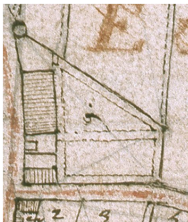
Détail du plan de la seigneurie d'Andrézy de 1731. Dessin plume. (AN, N IV Seine-et-Oise 19).

Phot. Laurent Kruszyk IVR11_20067801033NUCA