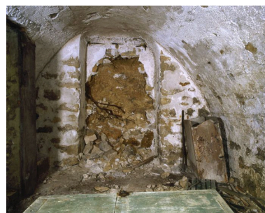
La cave voûtée partie murée.

IVR11_20067800905XA