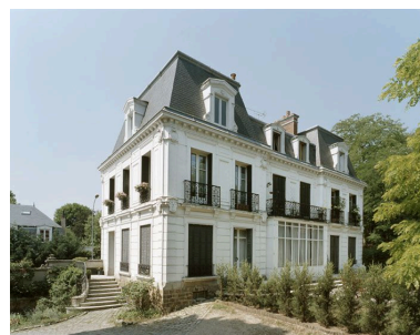
Façade principale sur le jardin. IVR11_20067800558VA