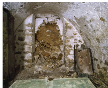
La cave voûtée partie murée. IVR11_20067800907XA