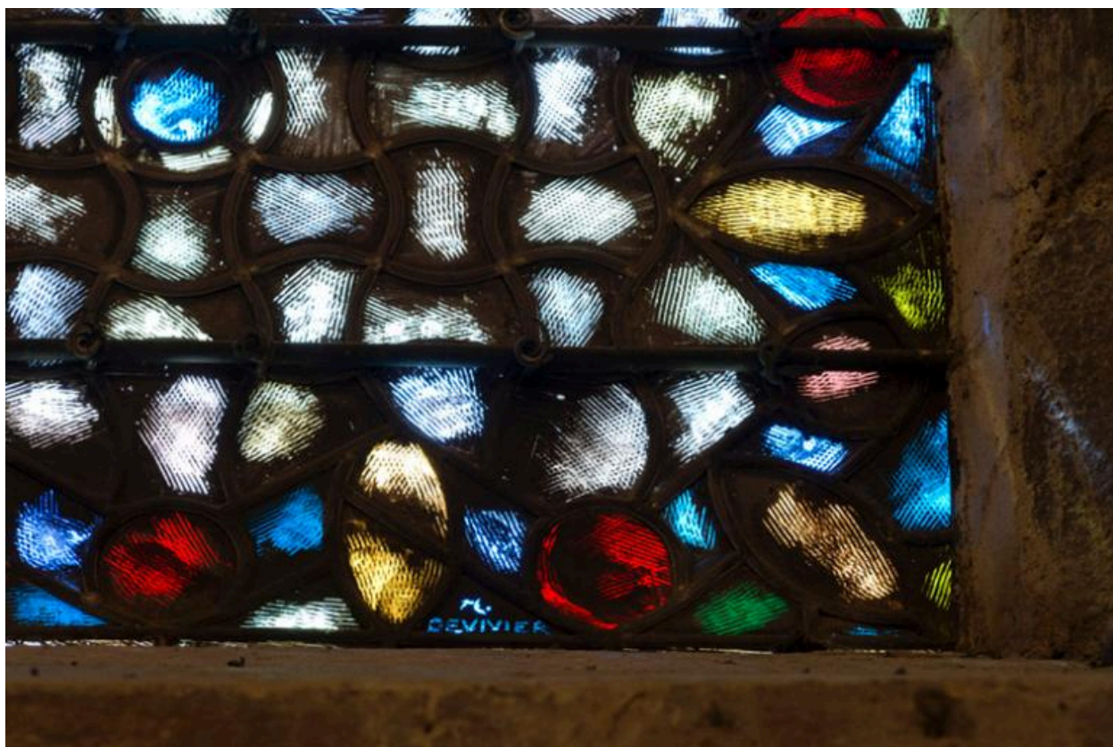
Signature du peintre verrier Devivier au bas de la verrière de la baie 6.