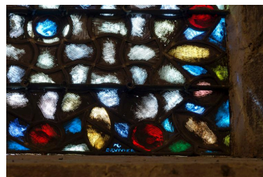
Signature du peintre verrier Devivier au bas de la verrière de la baie 6.

Phot. Laurent Kruszyk IVR11_20177800747NUC4A