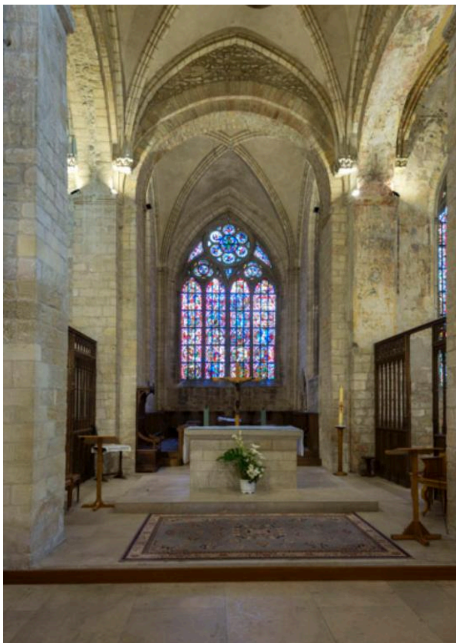
Vue d'ensemble du chœur où se concentrent les verrières.