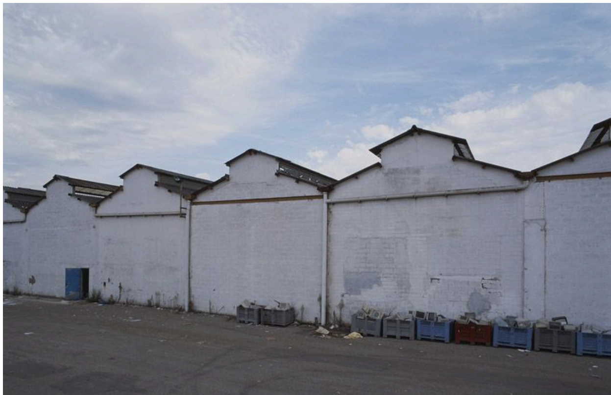
Ensemble de halles à lanterneaux accolées.