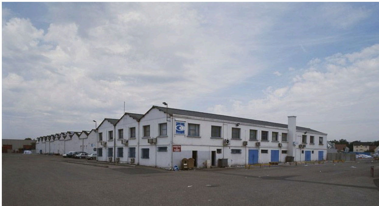
Vue d'ensemble des ateliers, aujourd'hui convertis en usine de récupération et transformation de vieux papiers.