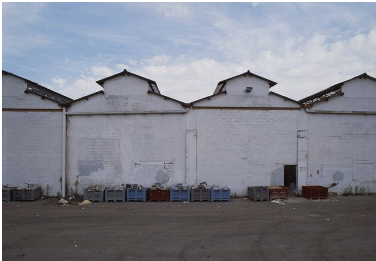
Détail de quatre halles. Les lanterneaux sont vitrés et ont une double fonction d'aération et d'éclairage.