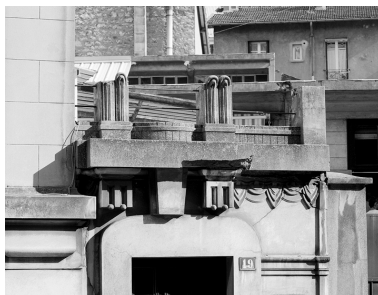
Vue de détail du décor de l'entrée des bureaux.