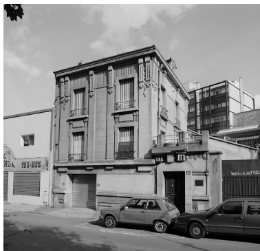
Vue générale de la maison.