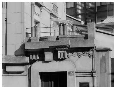
Vue de détail du décor de l'entrée des bureaux. IVR11_20019300362X