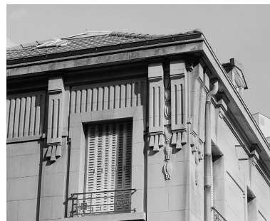
Vue de détail des ornements de la façade. IVR11_20019300361X