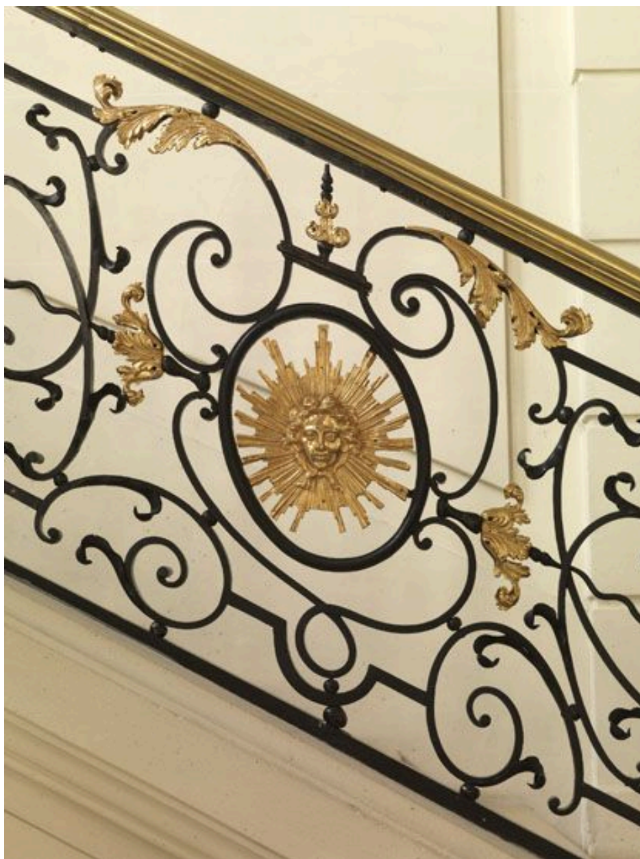
Détail du médaillon avec la représentation du Dieu Soleil en bronze.