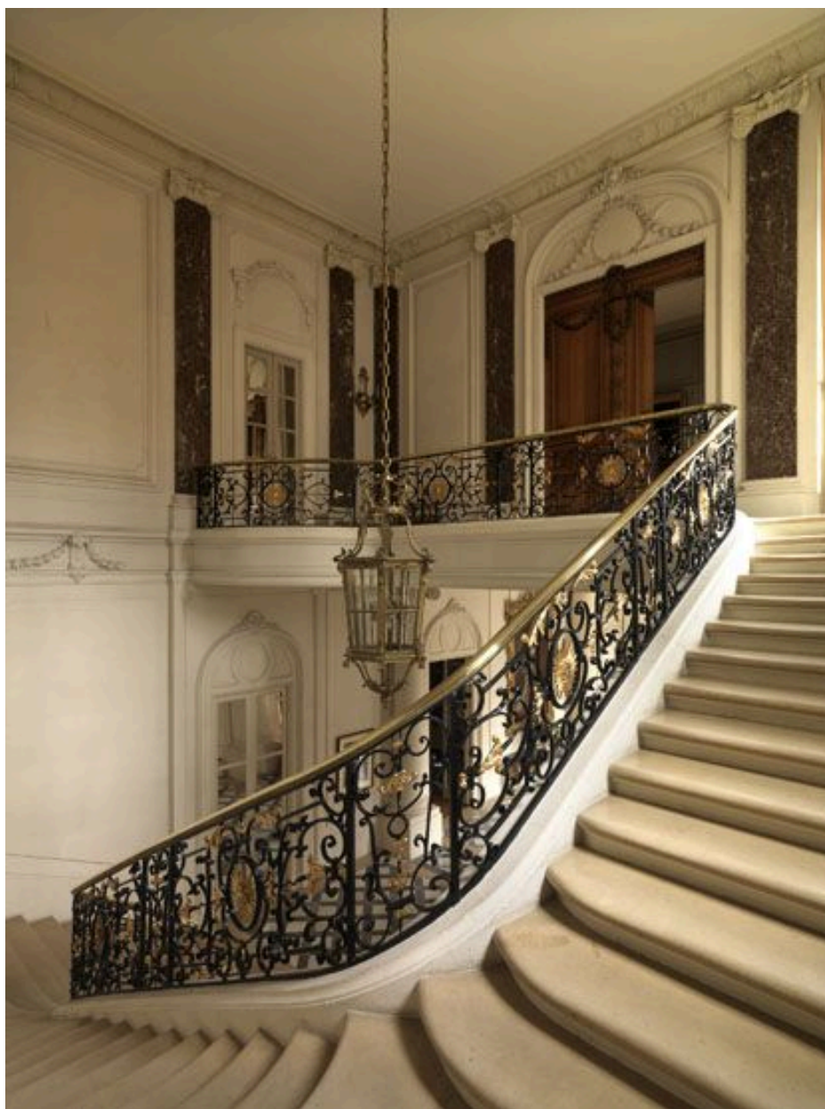
La volée et le palier du premier étage.