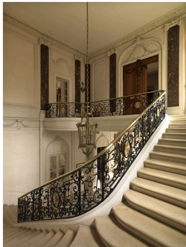
La volée et le palier du premier étage. IVR11_20097501107NUC4A