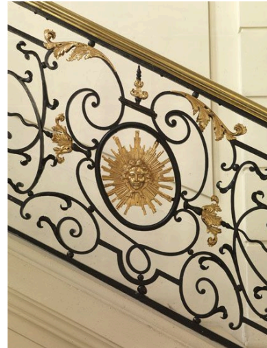
Détail du médaillon avec la représentation du Dieu Soleil en bronze. IVR11_20097501106NUC4A