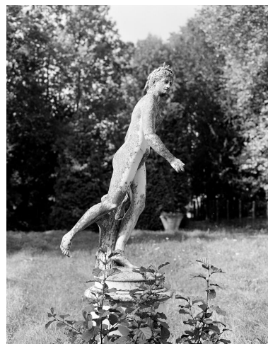
Vue latérale IVR11_19847801093X