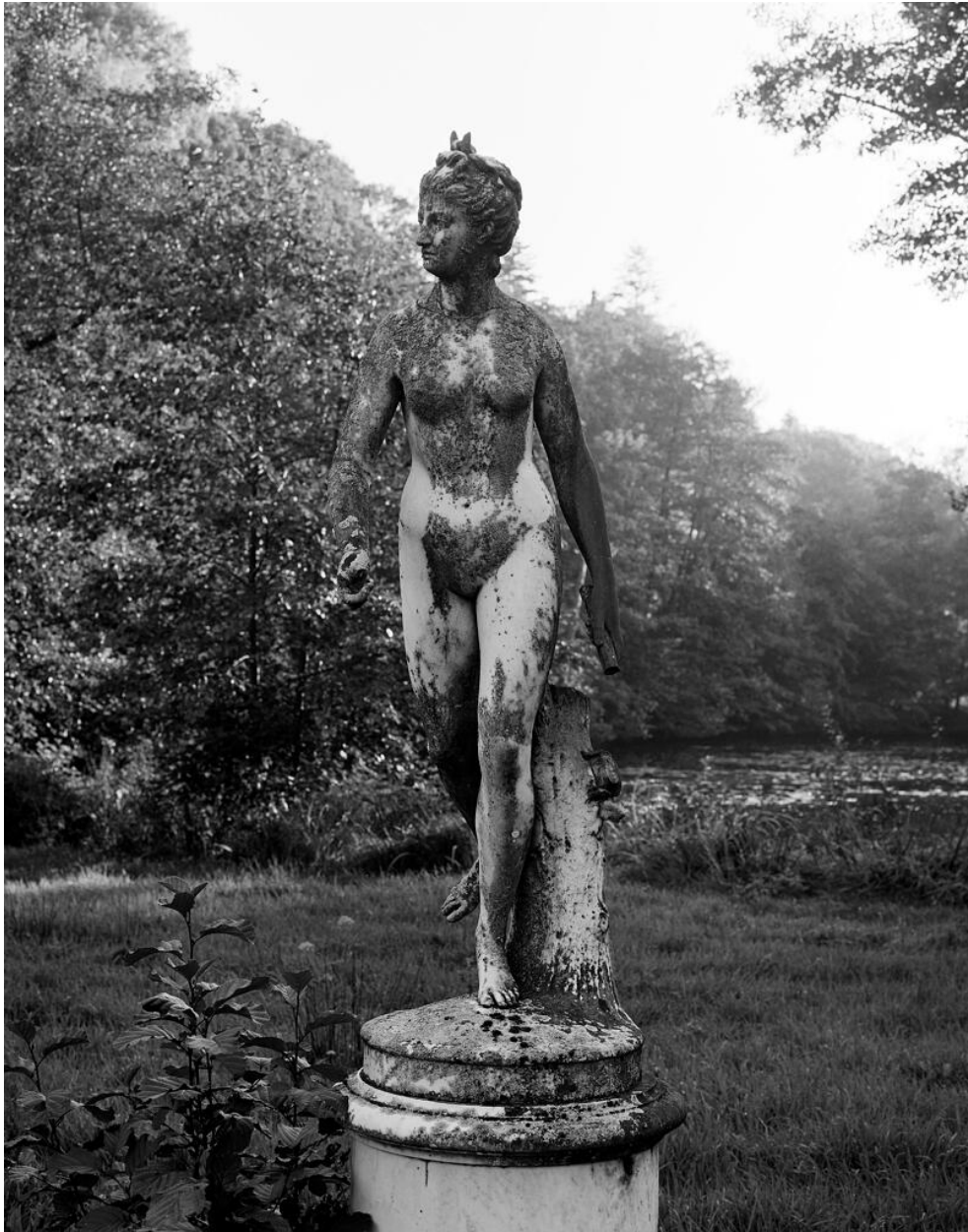
Sculpture de face