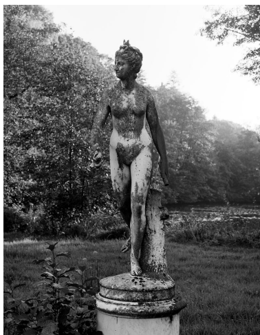
Sculpture de face IVR11_19847801094X