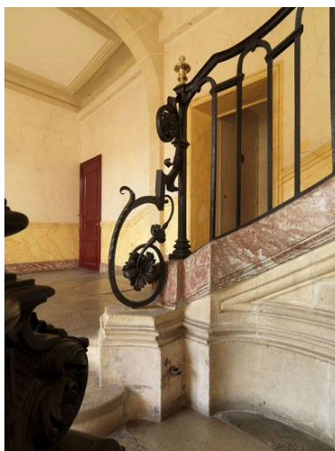
Vue latérale de la console de départ. IVR11_20097501580NUC4A