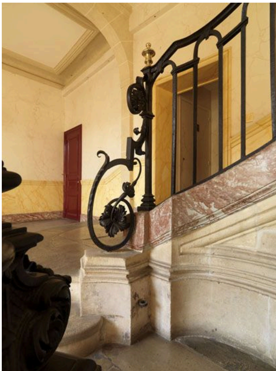
Vue latérale de la console de départ.