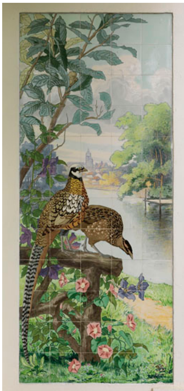
Vue d'ensemble du panneau.