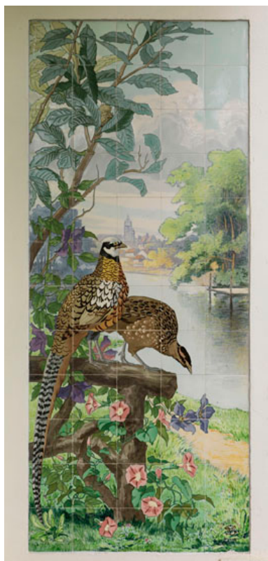
Vue d'ensemble du panneau. IVR11_20099500634NUC4A