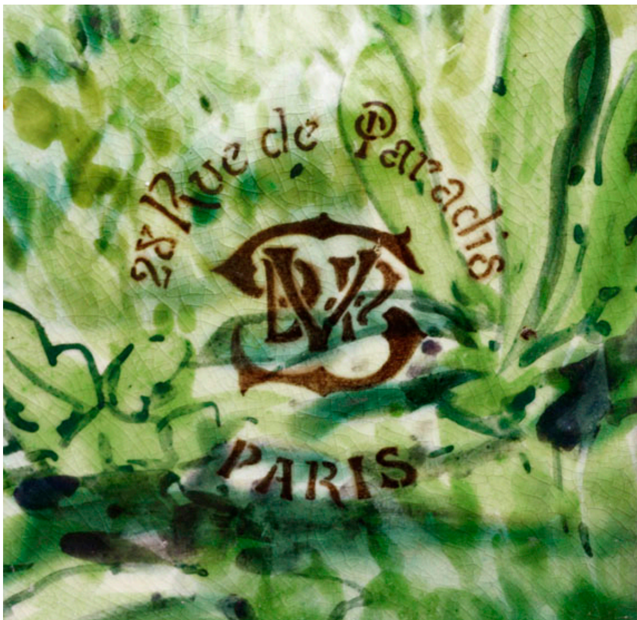
Détail de la signature de l'entreprise ayant réalisé le panneau.