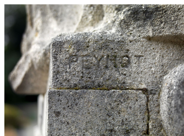
Signature du sculpteur.