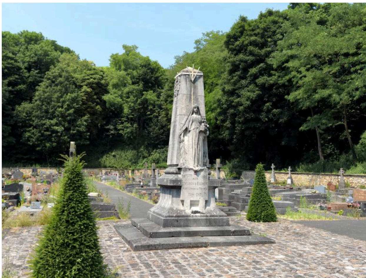
Vue d'ensemble du monument, de trois-quarts.