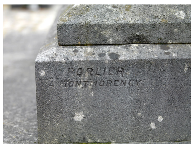
Signature du marbrier. IVR11_20169500138NUC4A