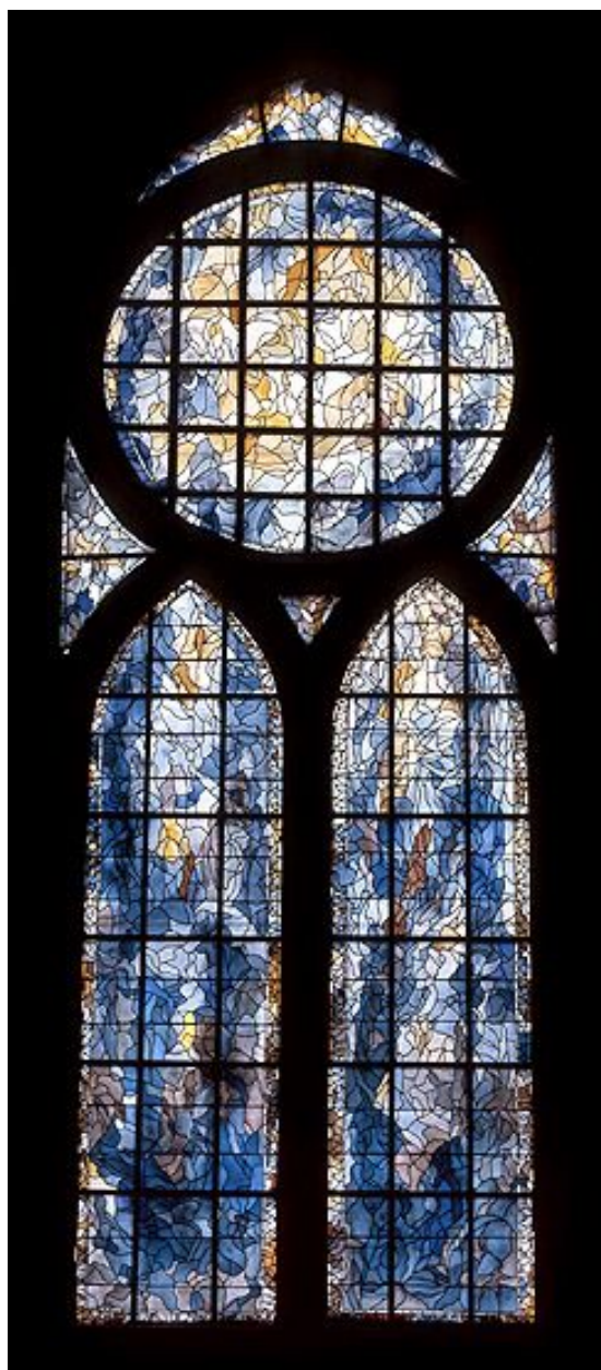
Vue d'ensemble de la verrière de la baie 2.