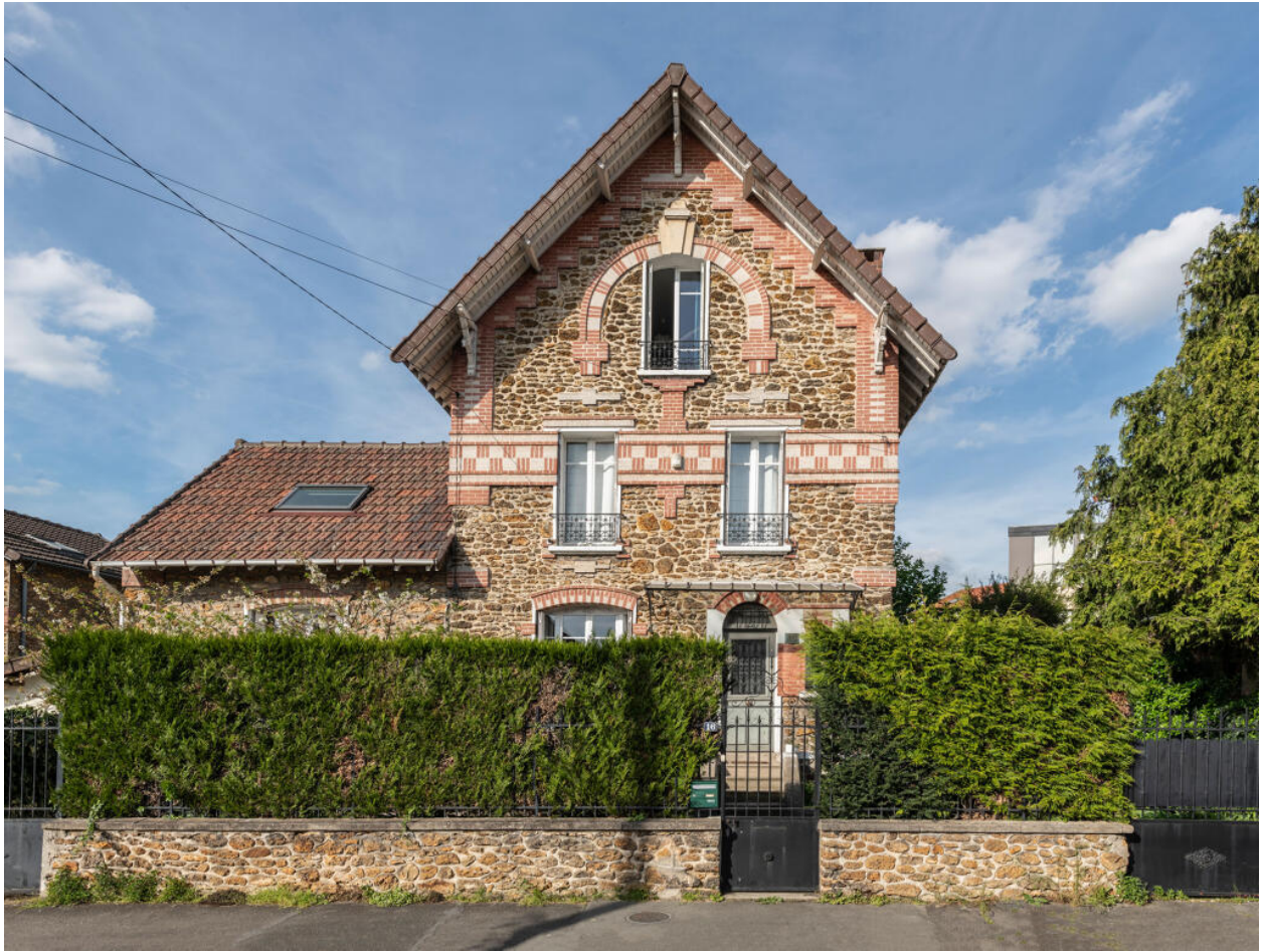
Vue de la façade sud. La marquise qui surmonte la porte d'entrée était à l'origine un auvent à deux pentes.