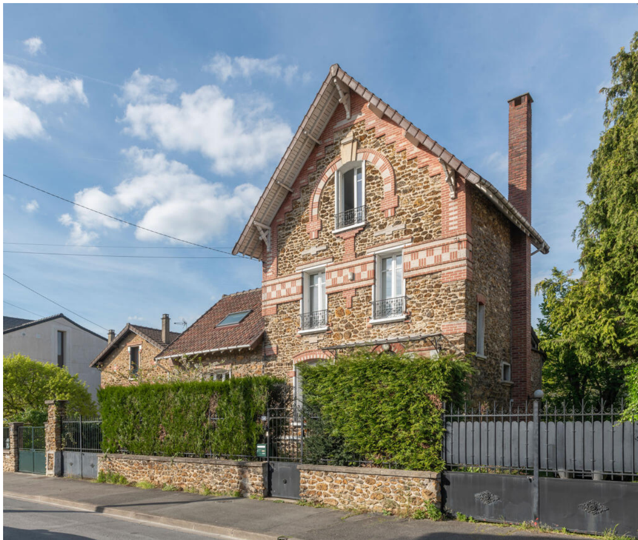
Vue de la façade sud sur rue.