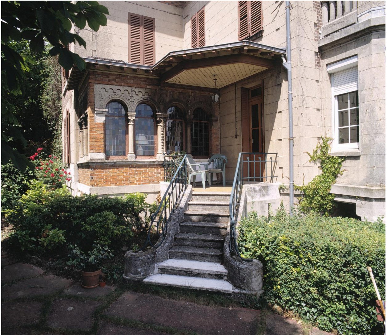
Vue du 'bow-window' réalisé avec une claire-voie romane provenant d'une maison de Cluny (Saône-et-Loire).