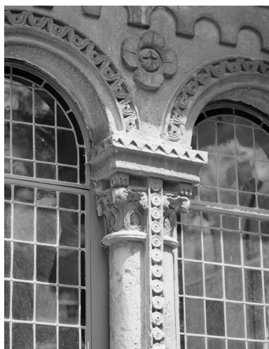
Claire-voie romane : détail d'un chapiteau double surmontant deux colonnettes jumelées.

Phot. Philippe Ayrault IVR11_20029100777X