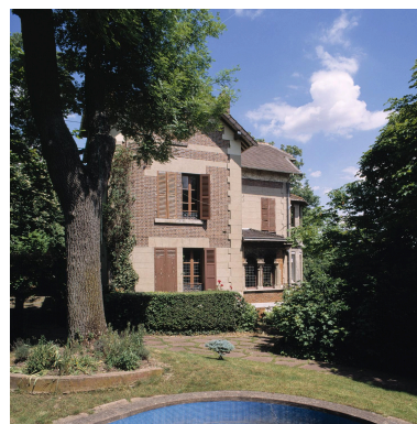
Vue de la façade latérale ouest. IVR11_20029100772XA