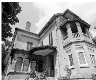
Vue de la façade tournée vers la Seine.