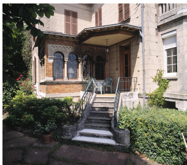
Vue du 'bow-window' réalisé avec une claire-voie romane provenant d'une maison de Cluny (Saône-et-Loire).