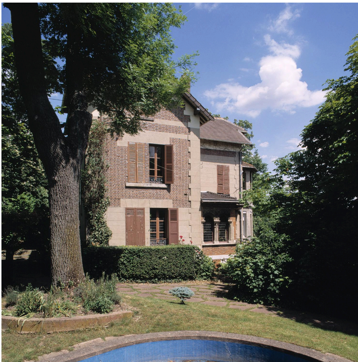
Vue de la façade latérale ouest.