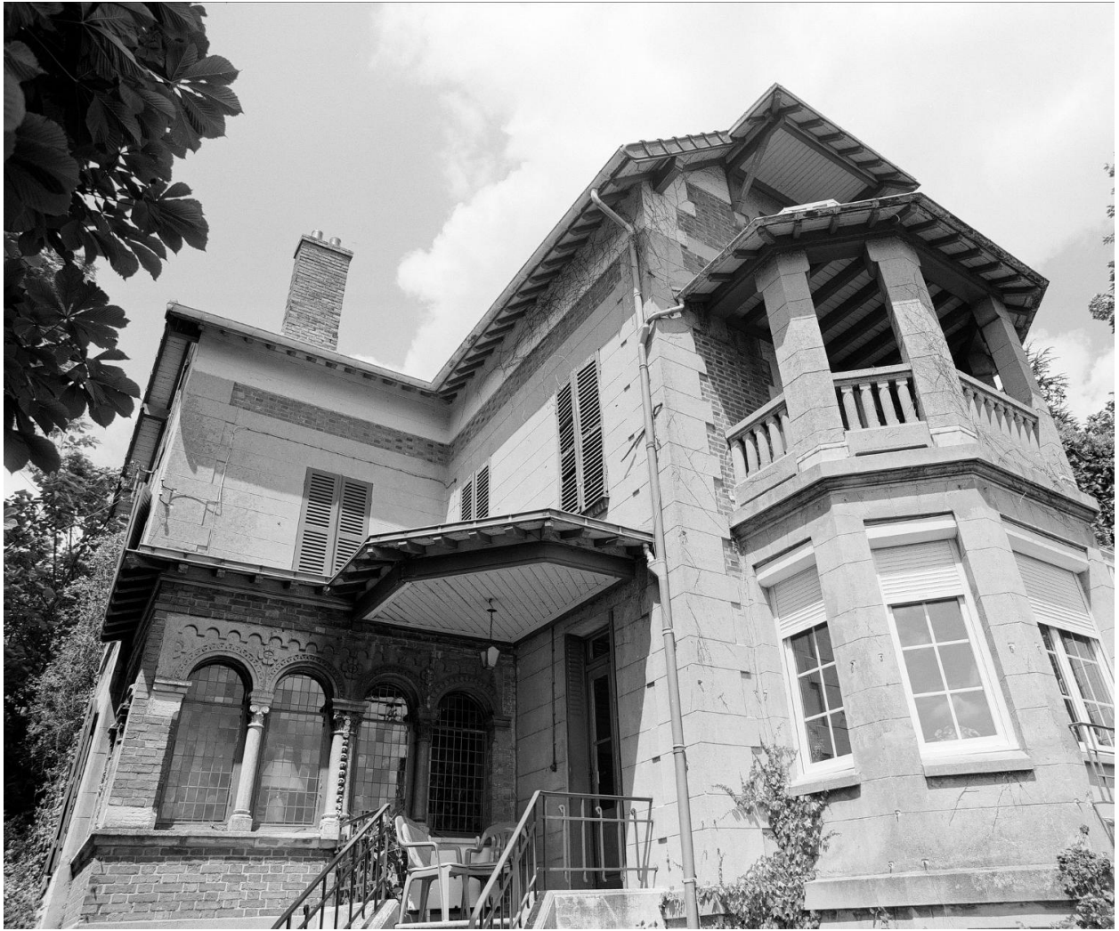
Vue de la façade tournée vers la Seine.