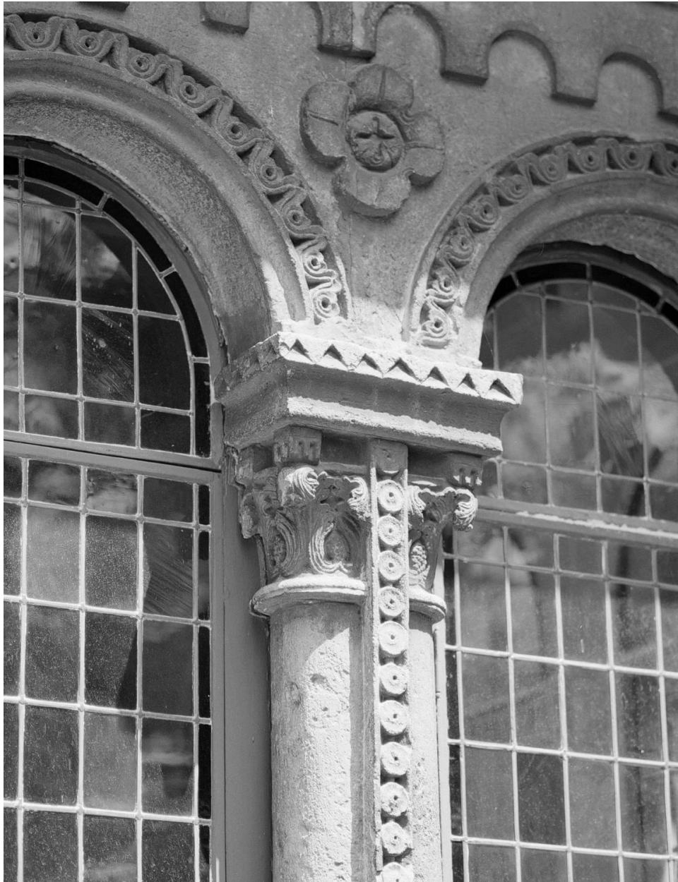
Claire-voie romane : détail d'un chapiteau double surmontant deux colonnettes jumelées.