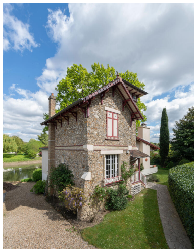
Angle des façades nord et ouest. A l'arrière plan, la Seine.

IVR11_20247800269NUC4A