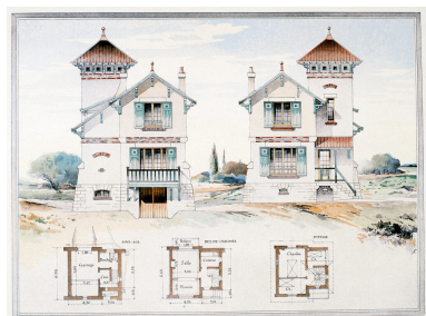
Plans et élévations. Tiré de : L'Habitation pratique, 1906. (Domaine départemental de Sceaux). IVR11_19917800070XA