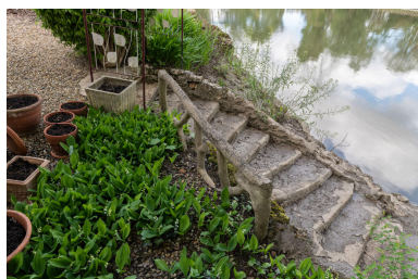
L'escalier en béton rustiqué menant au ponton.

On y accède par un escalier en béton rustiqué. Les berges sont traitées en fausse roche de béton. IVR11_20247800271NUC4A