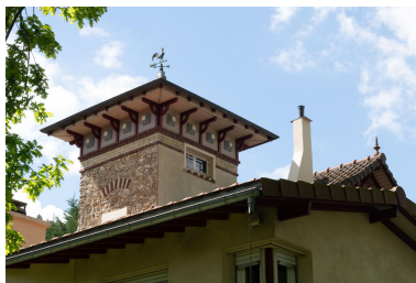
La tour belvédère, symbolique plutôt que fonctionnelle.

Phot. Kruszyk Laurent IVR11_20247800269NUC4A