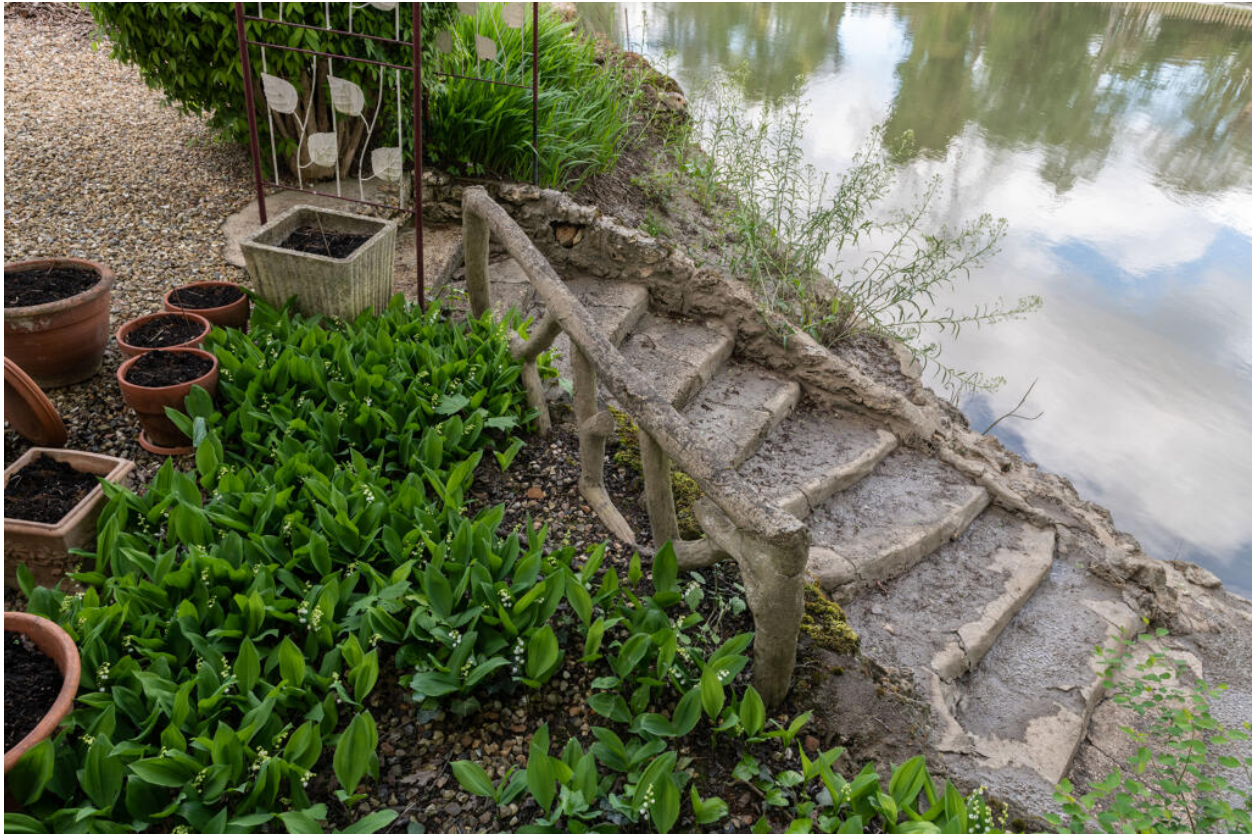
L'escalier en béton rustiqué menant au ponton.