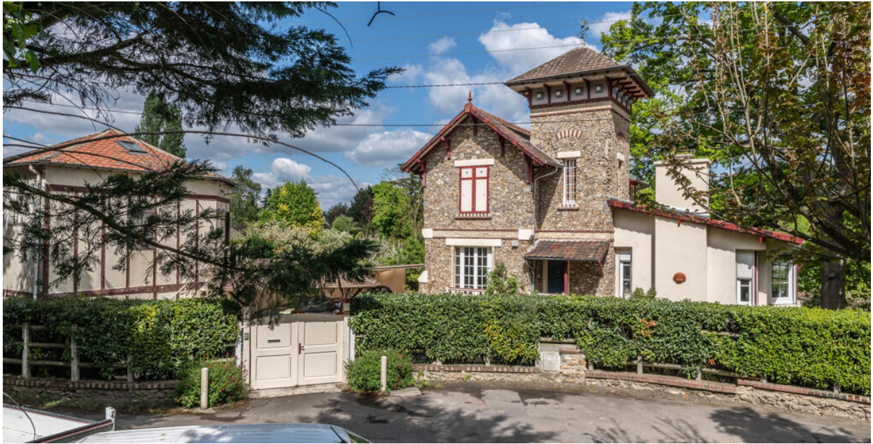
Maison de villégiature construite par paul Huan