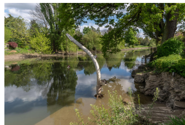
Le ponton sur la Seine, immergé sur la photo, et la poulie à bateaux.

IVR11_20247800268NUC4A