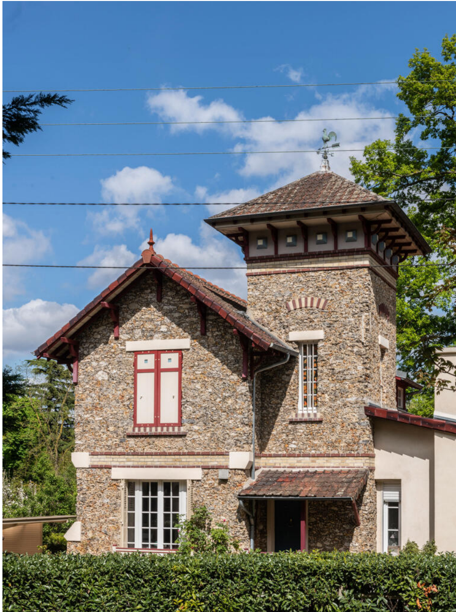
La façade principale côté chemin de la Nourrée.