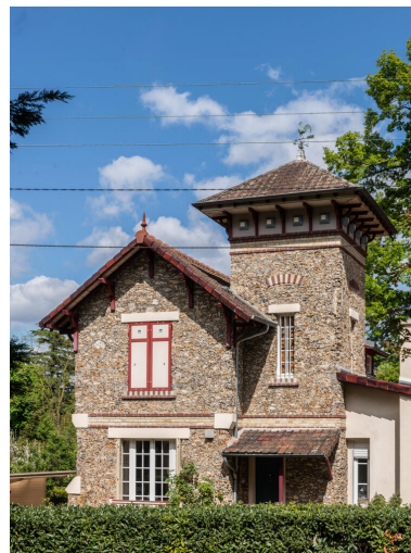
La façade principale côté chemin de la Nourrée. IVR11_20247800267NUC4A