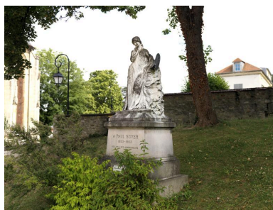
Vue d'ensemble du monument, aujourd'hui installé dans le jardin de l'office de tourisme.