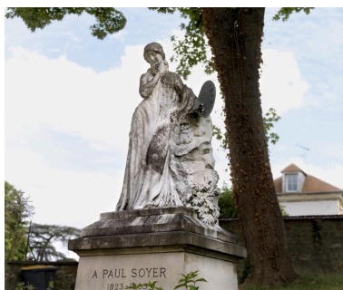
La statue, vue de trois-quarts droit. IVR11_20179500367NUC4A