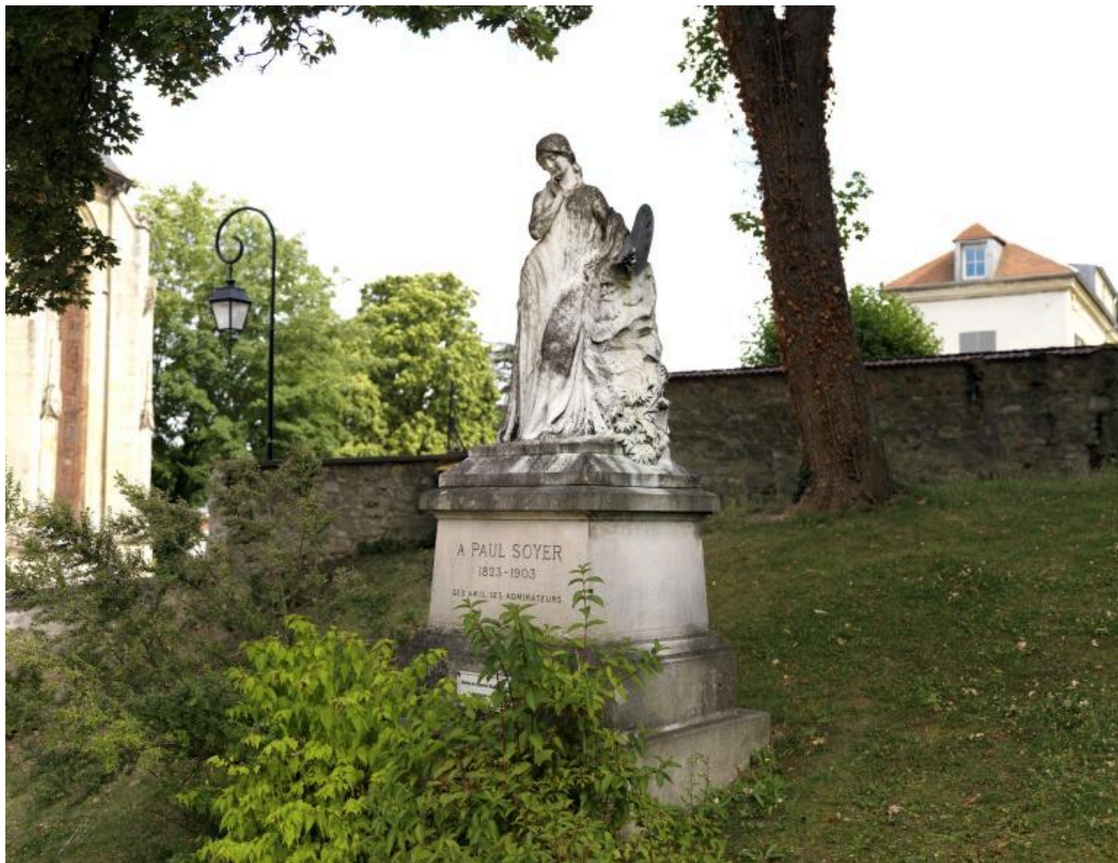
Vue d'ensemble du monument, aujourd'hui installé dans le jardin de l'office de tourisme.