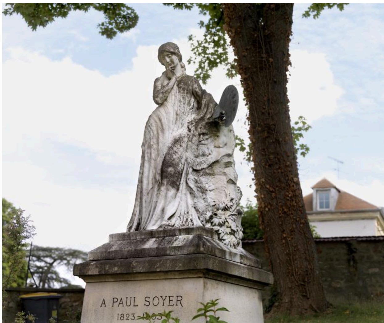
La statue, vue de trois-quarts droit.