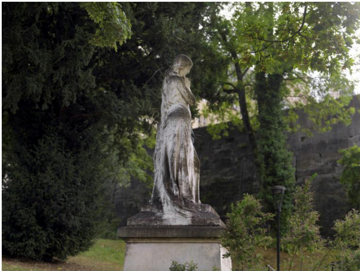
Le monument, vu de trois-quarts gauche.