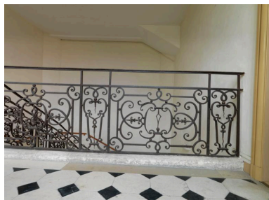
pilastres et panneau rectangulaire de la rampe d'appui. IVR11_20177800820NUC4A