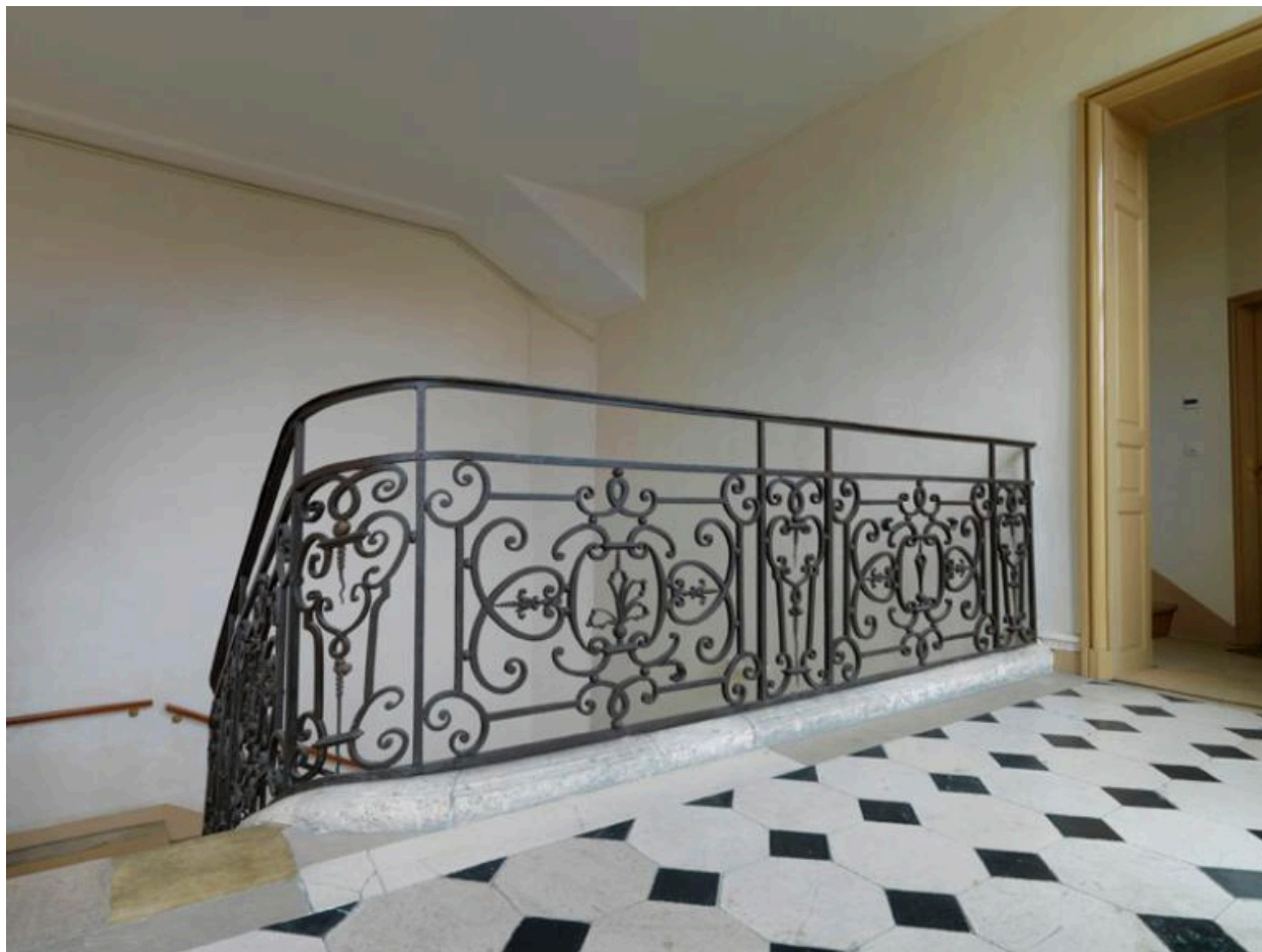
Le palier du premier étage.