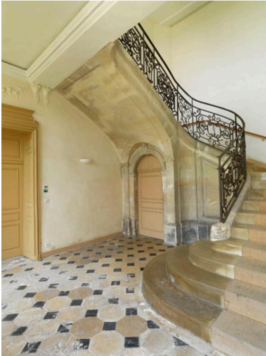
Vue de l'escalier depuis le vestibule. On aperçoit la porte vers la cave.