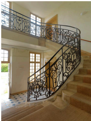
La rampe en ferronnerie se compose de panneaux allongés alternant avec des panneaux à pilastres.