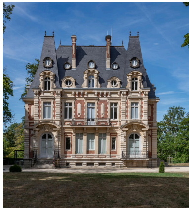
Vue générale du château. IVR11_20229500316NUC4A