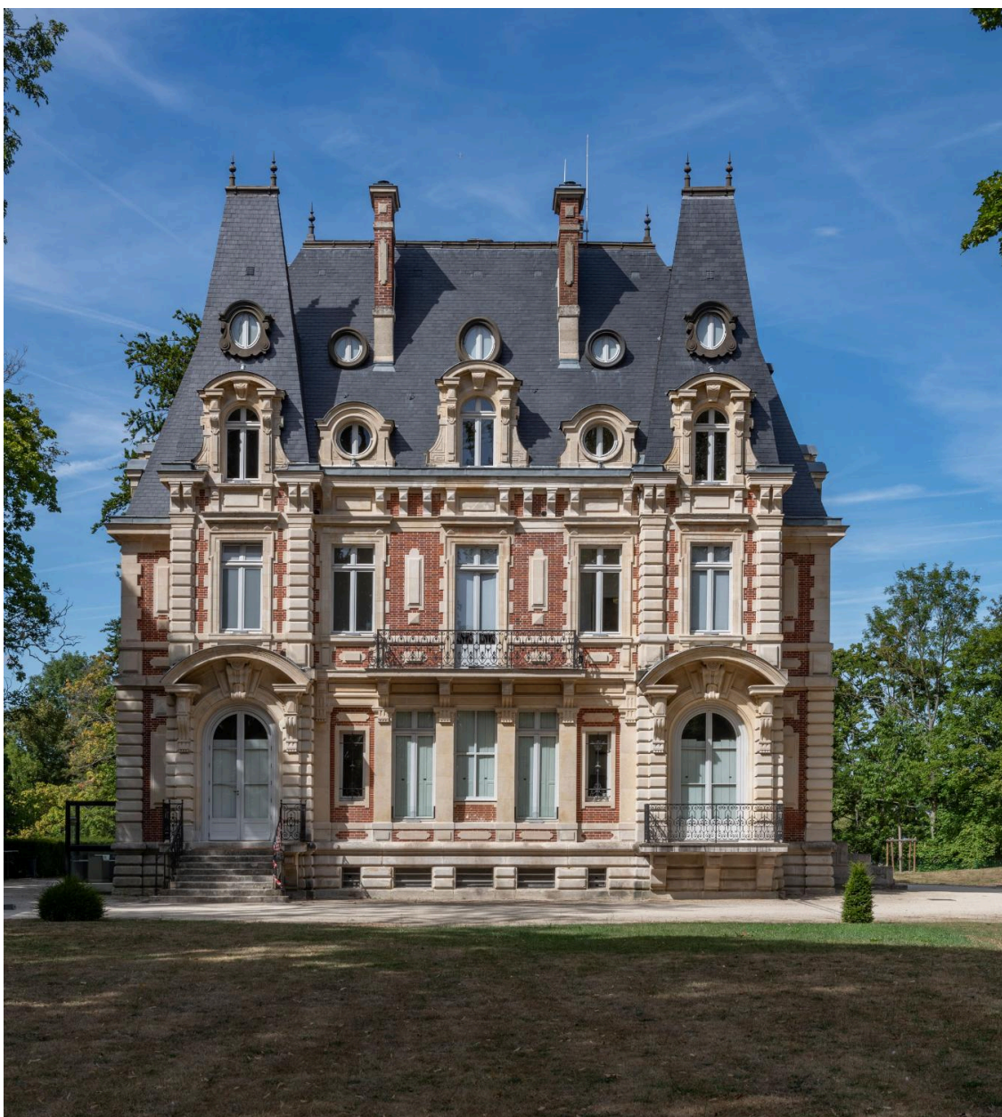
Vue générale du château.