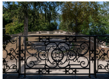
Le travail de ferronnerie des garde-corps est particulièrement soigné ; ici le balcon de la façade postérieure offrant un belvédère sur l'Oise. IVR11_20229500320NUC4A