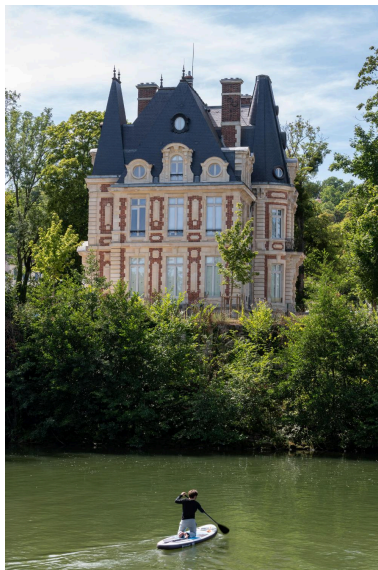
Vue générale du château Conti depuis la rive droite de l'Oise et la gare de Parmain.