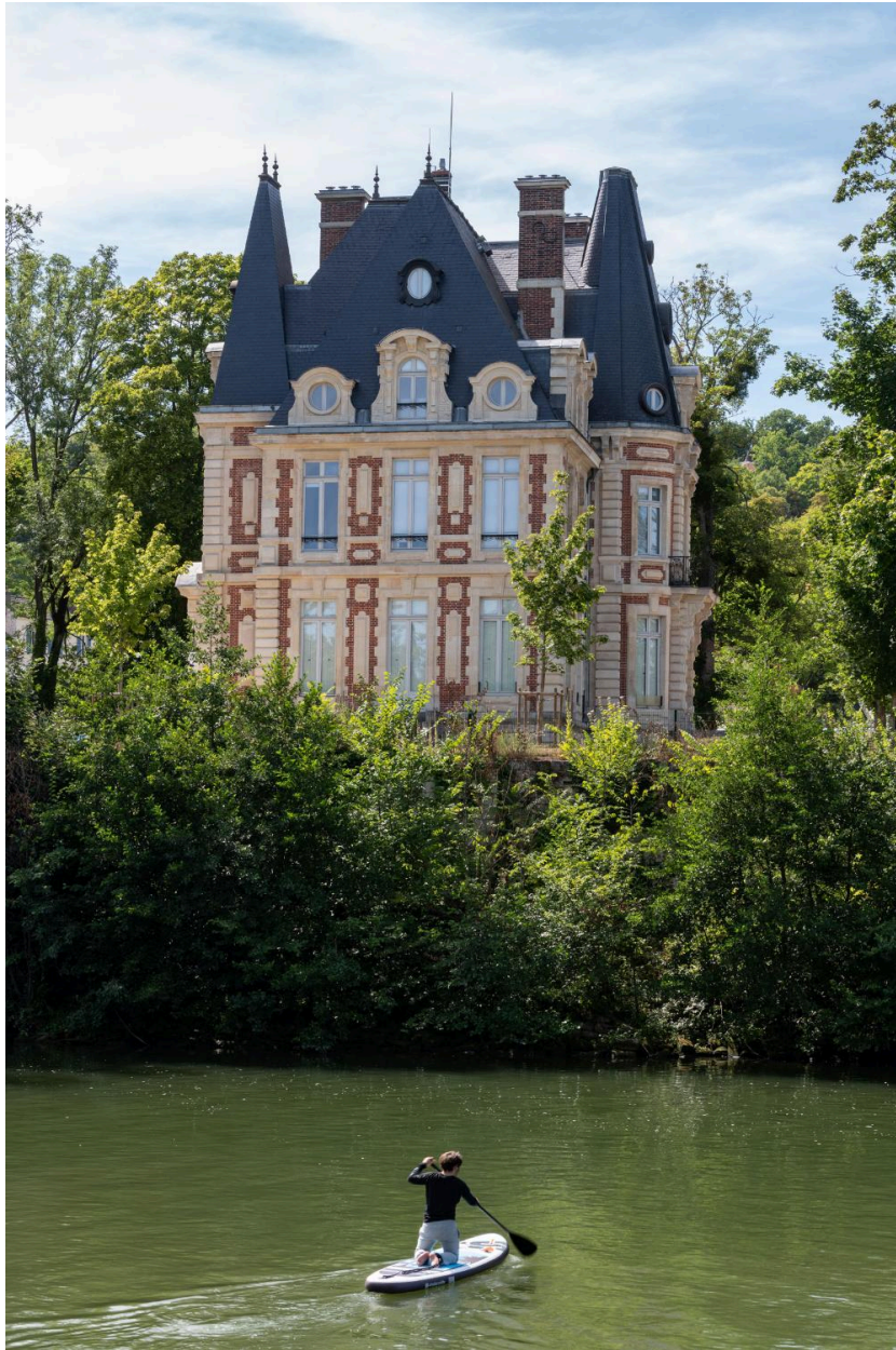
Vue générale du château Conti depuis la rive droite de l'Oise et la gare de Parmain.