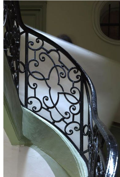
un panneau d'une partie tournante. IVR11_20107500258NUC4A