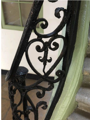
Détail du départ de l'escalier. IVR11_20107500257NUC4A