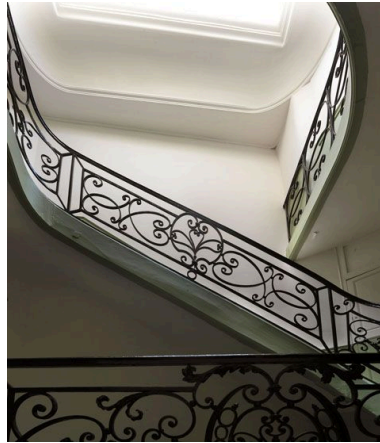
Vue d'une supérieure volée où le motif se simplifie.