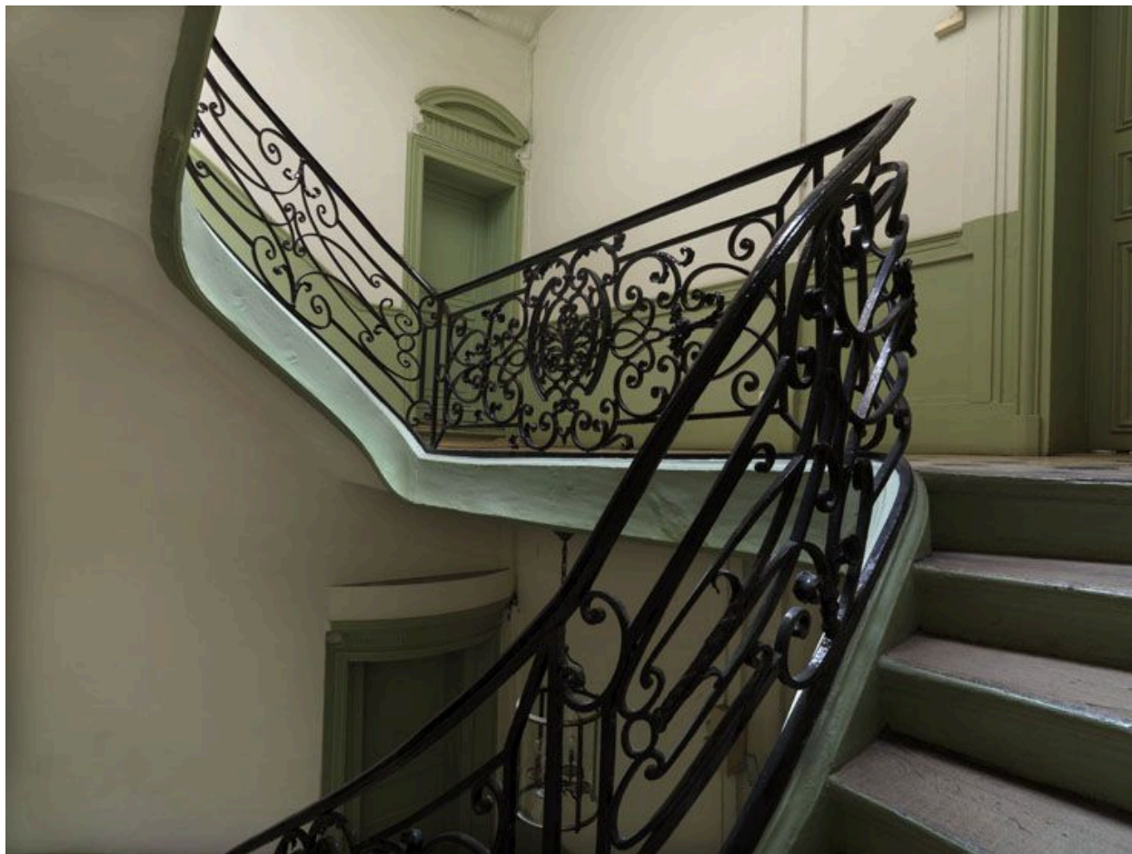
Vue du palier du 2ème étage à partir duquel le motif se simplifie.