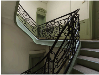
Vue du palier du 2ème étage à partir duquel le motif se simplifie.