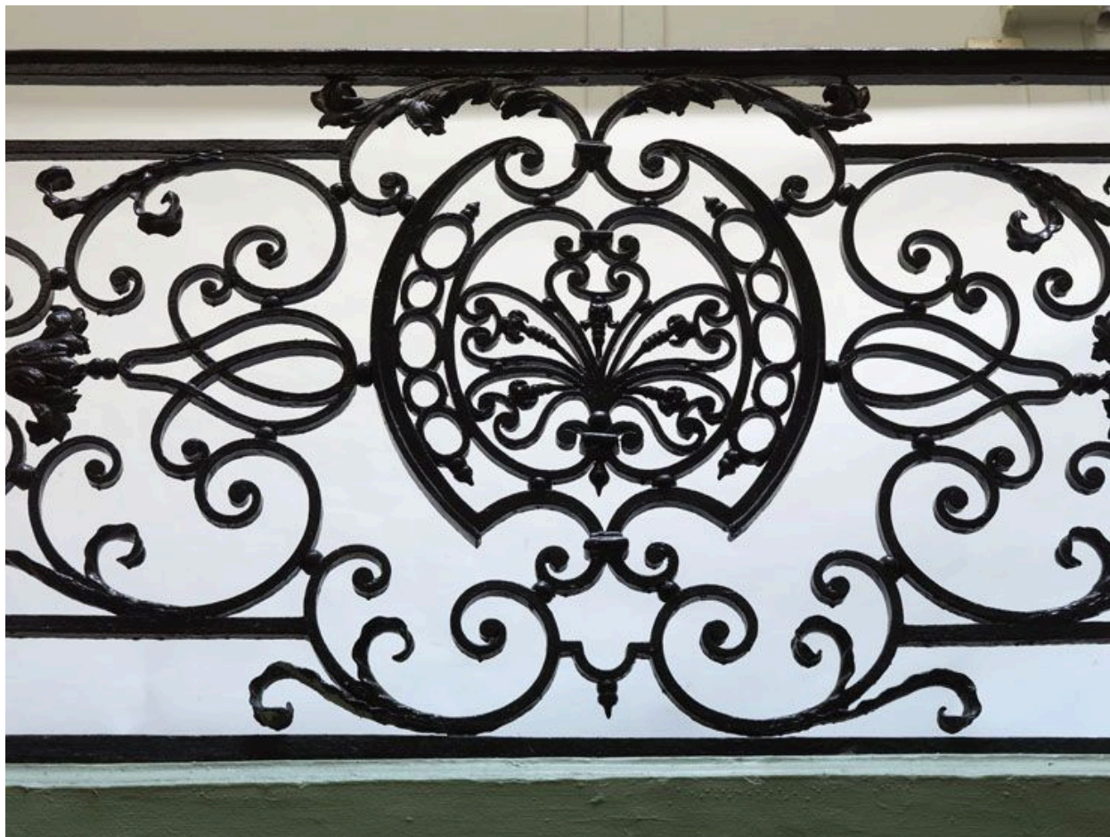
Détail du motif central du panneau du 2e étage.