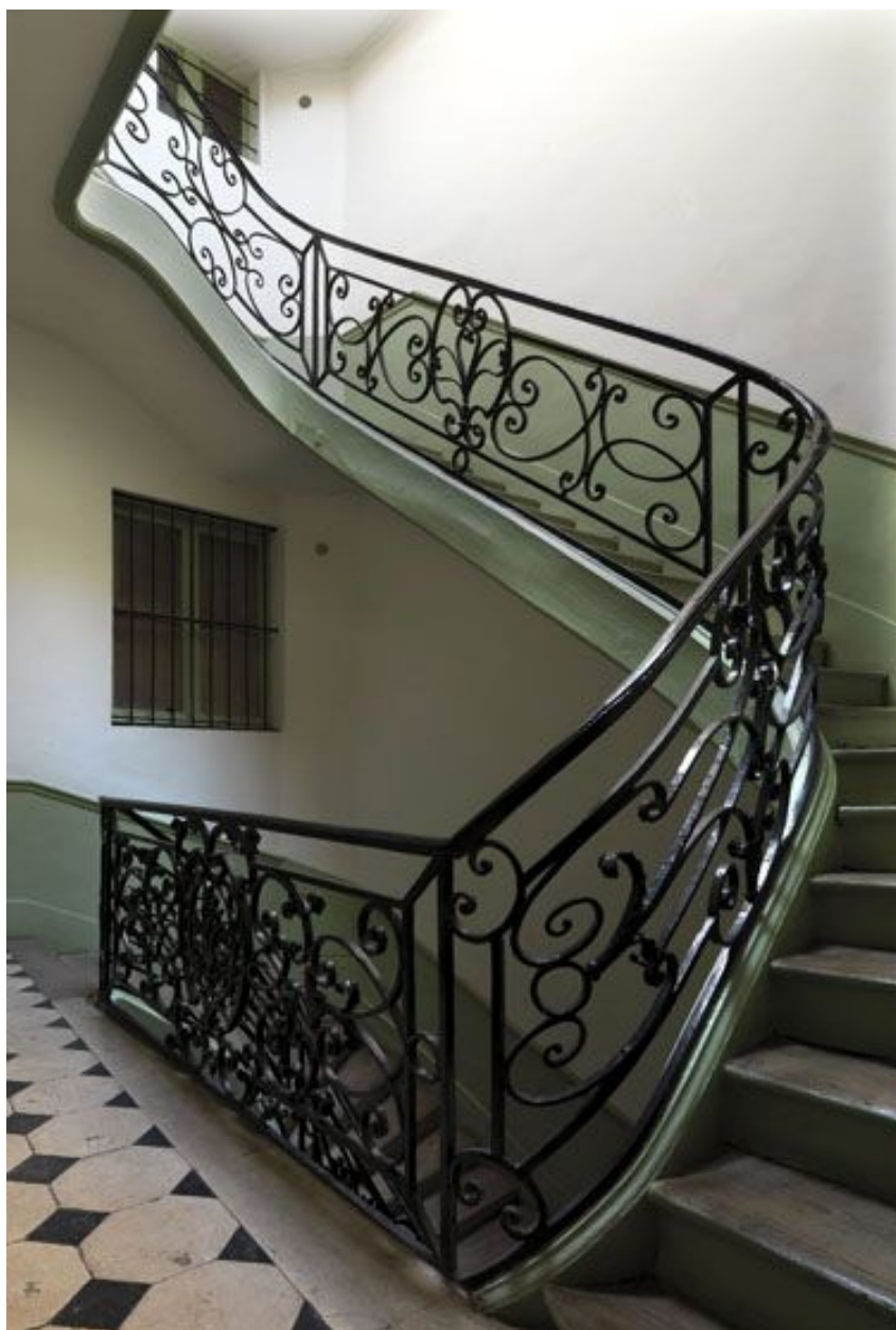
Vue du palier du 2ème étage et de la volée vers le 3ème où le motif se simplifie.