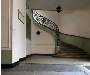
Vue du vestibule et du départ de l'escalier. IVR11_20107500256NUC4A