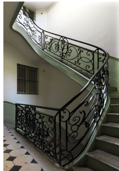
Vue du palier du 2ème étage et de la volée vers le 3ème où le motif se simplifie.