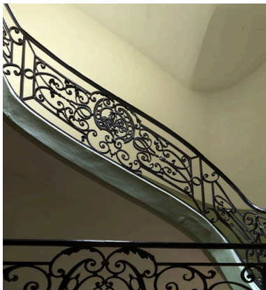
un panneau long d'une volée entre le 1er et le 2ème étage.