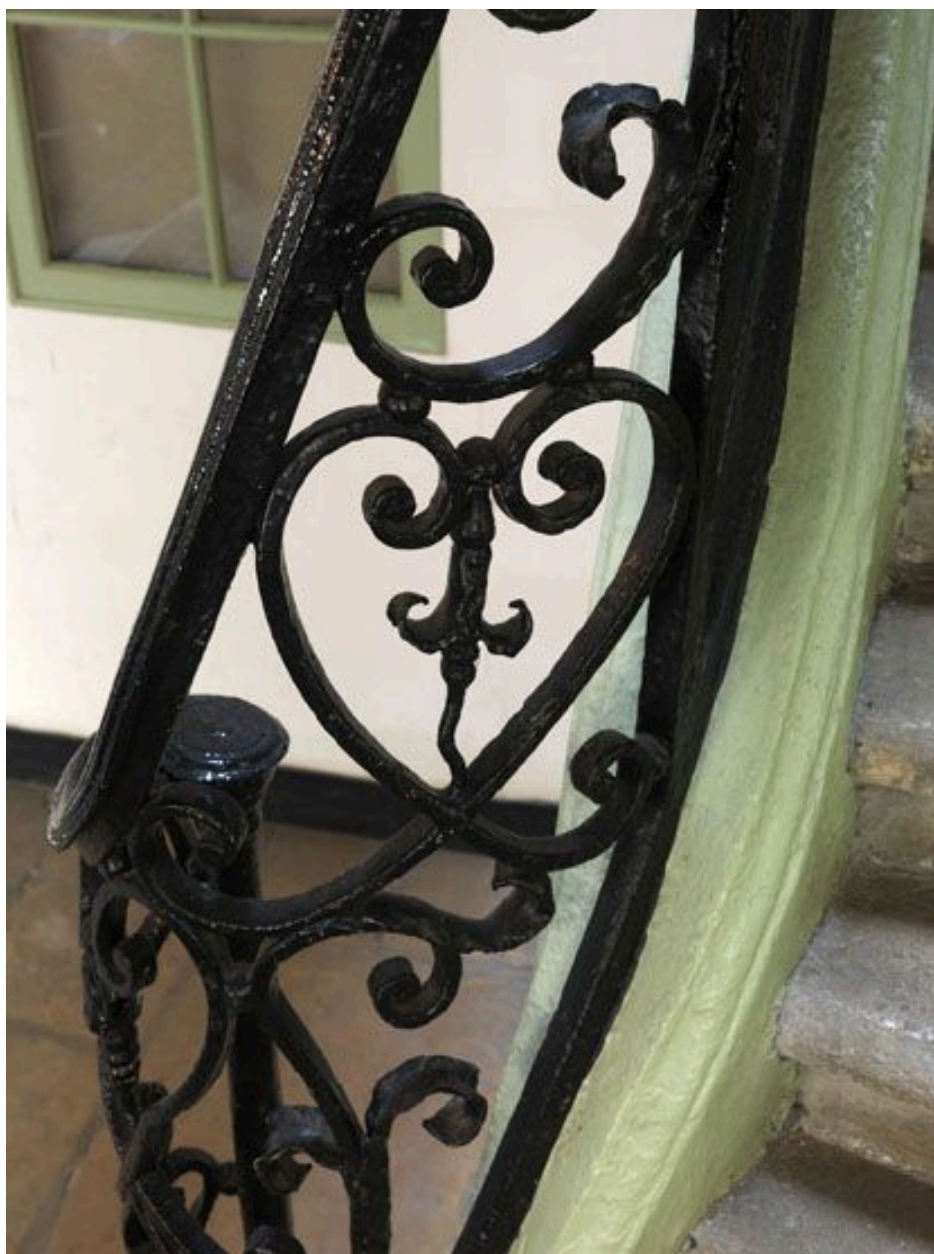
Détail du départ de l'escalier.