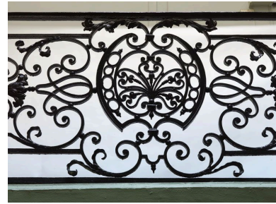
Détail du motif central du panneau du 2e étage. IVR11_20107500264NUC4A