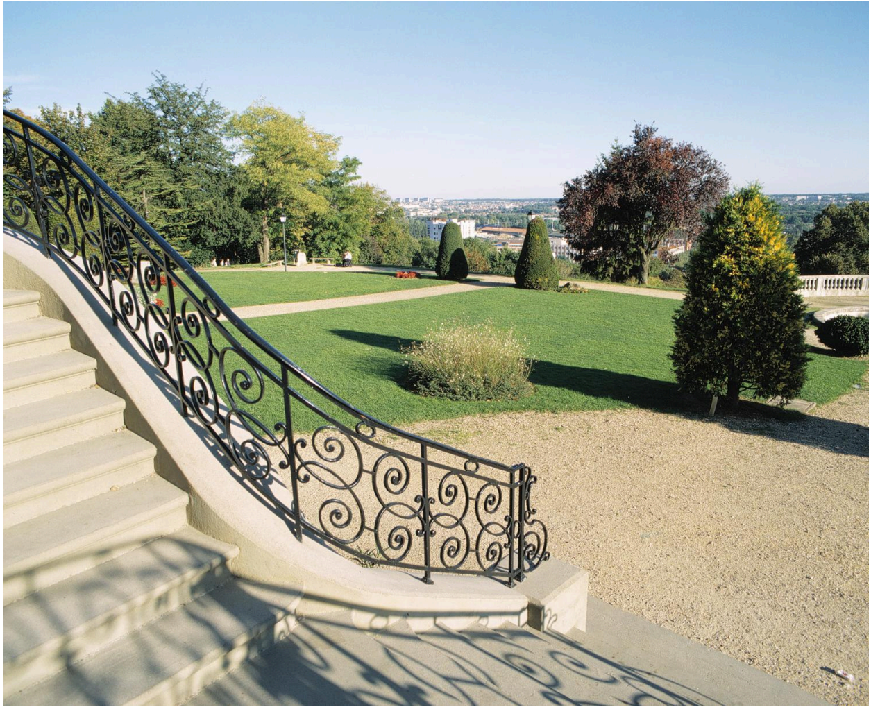
Vue du parc depuis l'escalier de la terrasse.