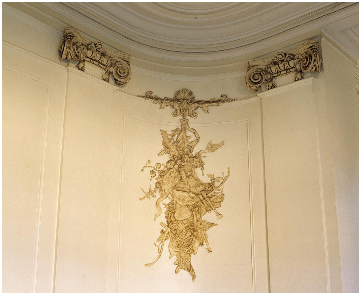
Vestibule : détail d'un panneau décoratif en stuc (chute d'armes) entre deux chapiteaux ioniques.