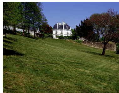
La mairie et la pelouse du parc d'Avaucourt qui descend vers l'avenue Aristide-Briand.