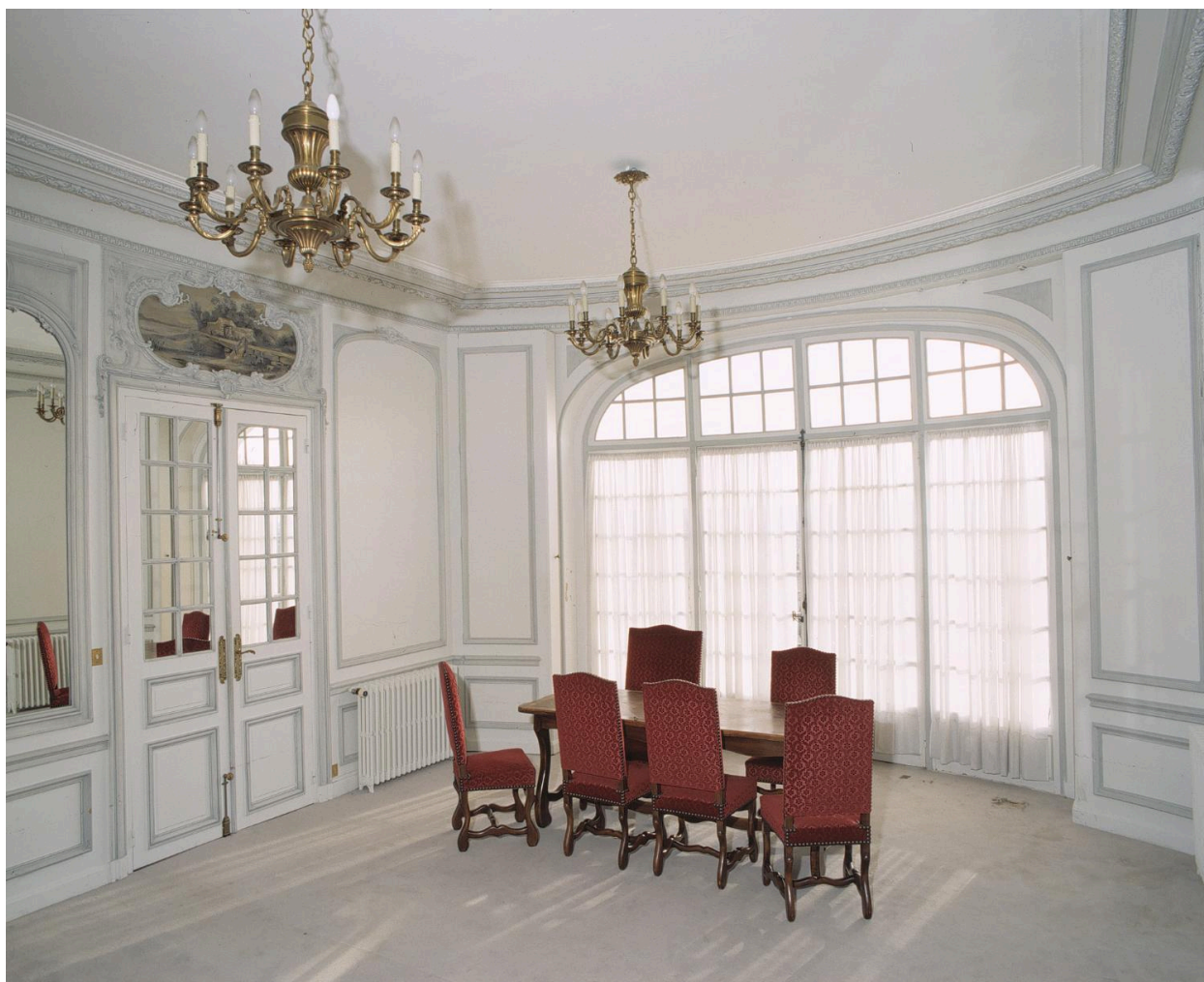
La salle des mariages, éclairée par une grande baie ouvrant sur la terrasse.