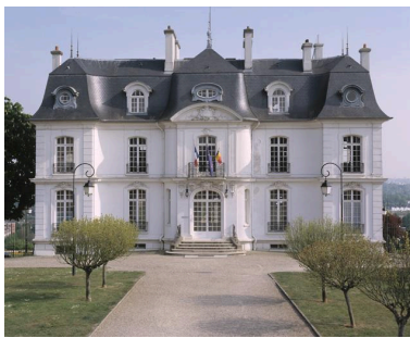
Façade antérieure.