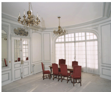
La salle des mariages, éclairée par une grande baie ouvrant sur la terrasse.