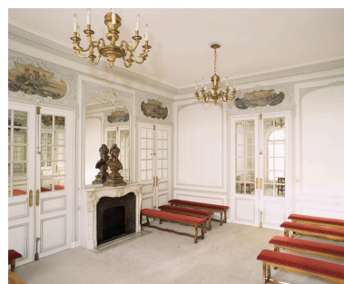
La salle des mariages ; elle est ornée de dessus-de-porte représentant des paysages peints en camaïeu.