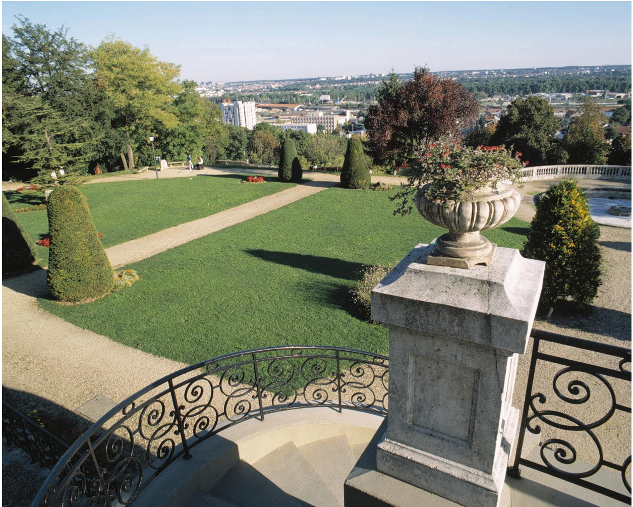
Autre vue du parc depuis l'escalier de la terrasse.