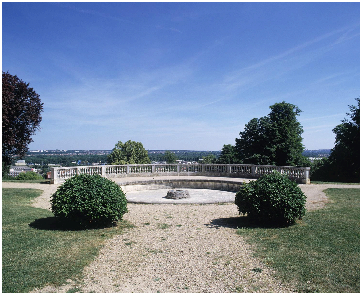
Le bassin et sa balustrade en hémicycle.