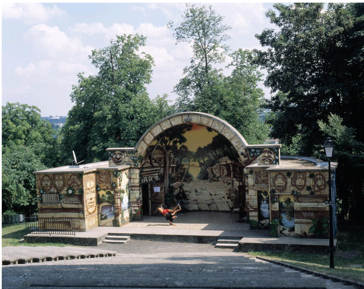
Le théâtre de plein air et ses gradins aménagés dans la pente du terrain.