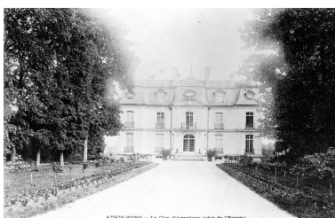
Vue de la façade antérieure. IVR11_20019100093X