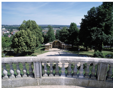
Vue du théâtre de plein air, de la terrasse du château. IVR11_20049100422XA