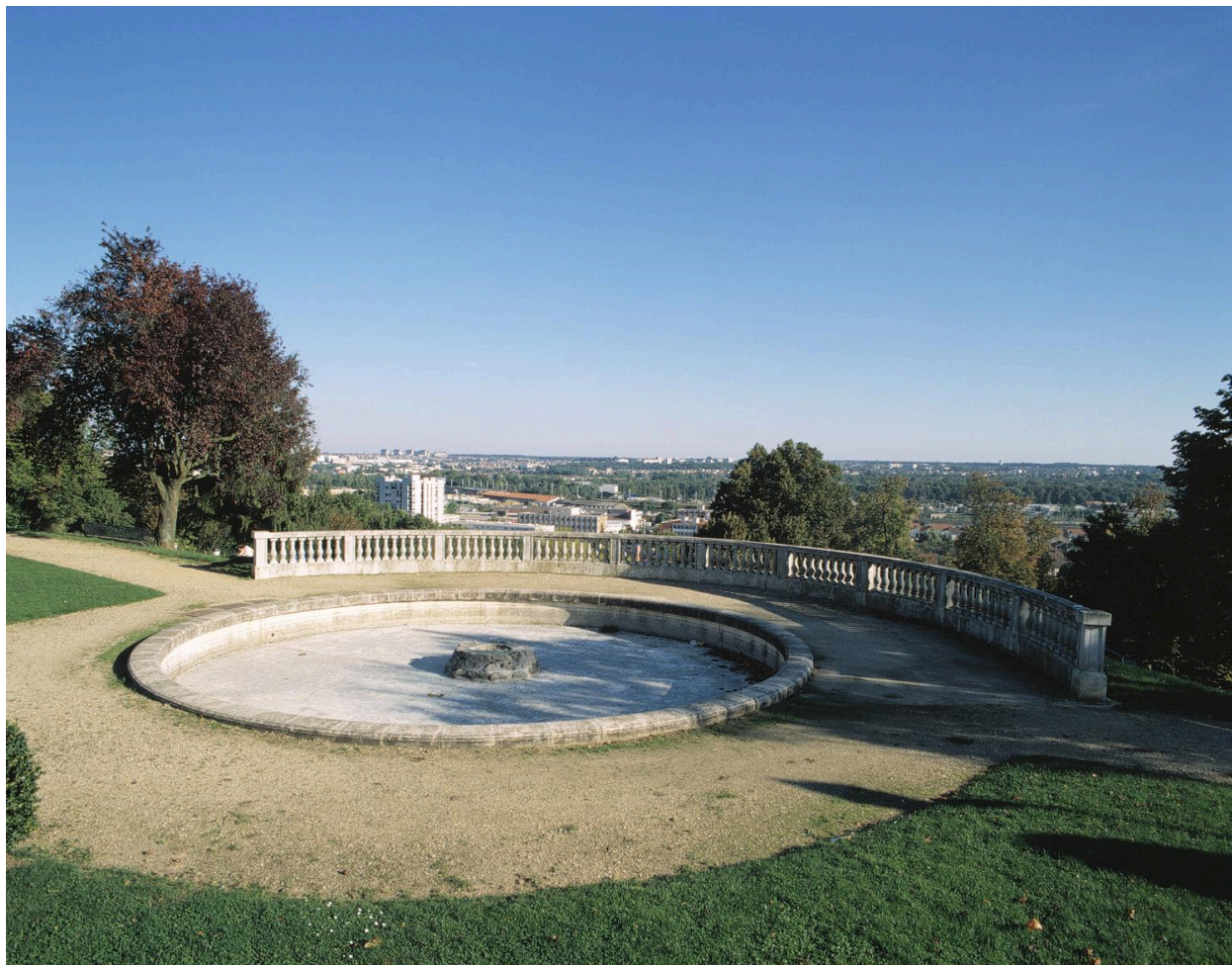
Vue du bassin et de la balustrade placée en belvédère au-dessus de la pente du parc.