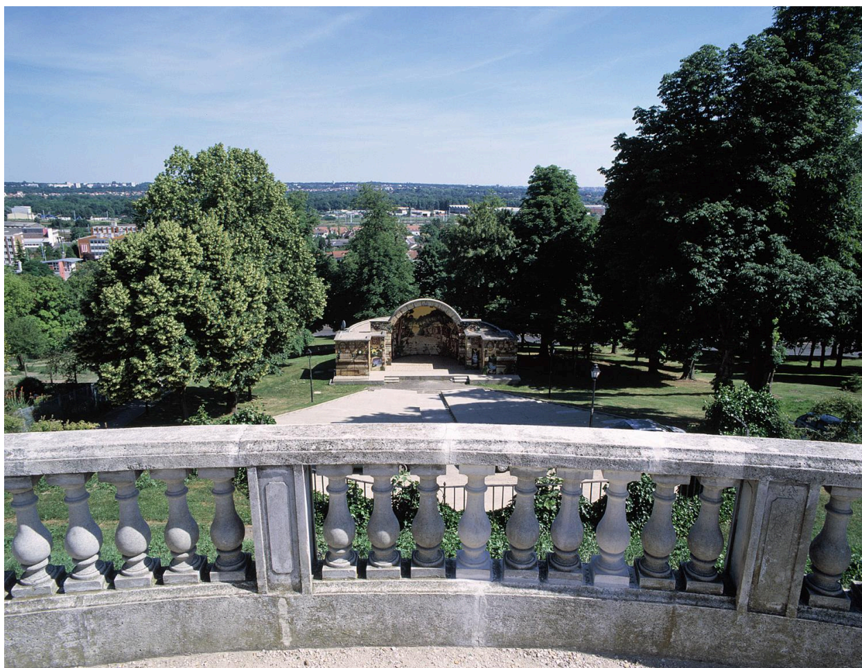
Vue du théâtre de plein air, de la terrasse du château.