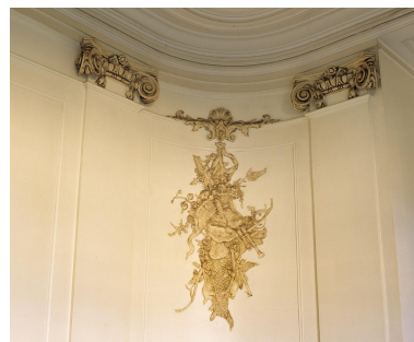
Vestibule : détail d'un panneau décoratif en stuc (chute d'armes) entre deux chapiteaux ioniques.