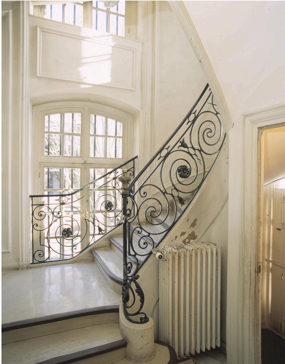
Départ de l'escalier situé à l'extrémité du vestibule (côté gauche). Rampe en ferronnerie de style Louis XVI.