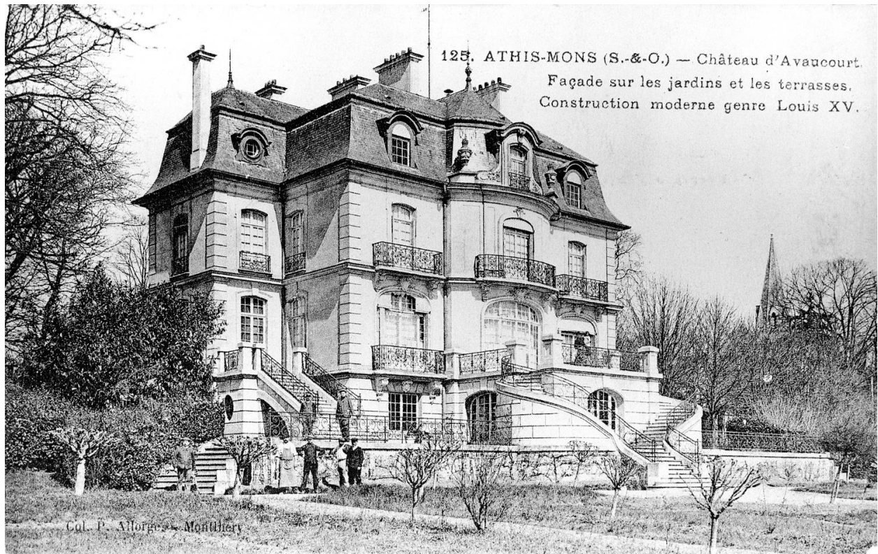
Vue d'ensemble de la façade sur les jardins.