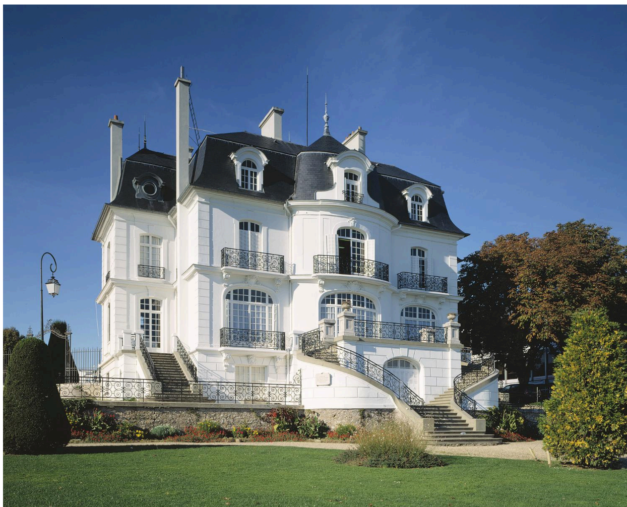
Façade arrière, côté Seine.