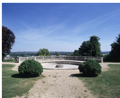
Le bassin et sa balustrade en hémicycle. IVR11_20049100424XA