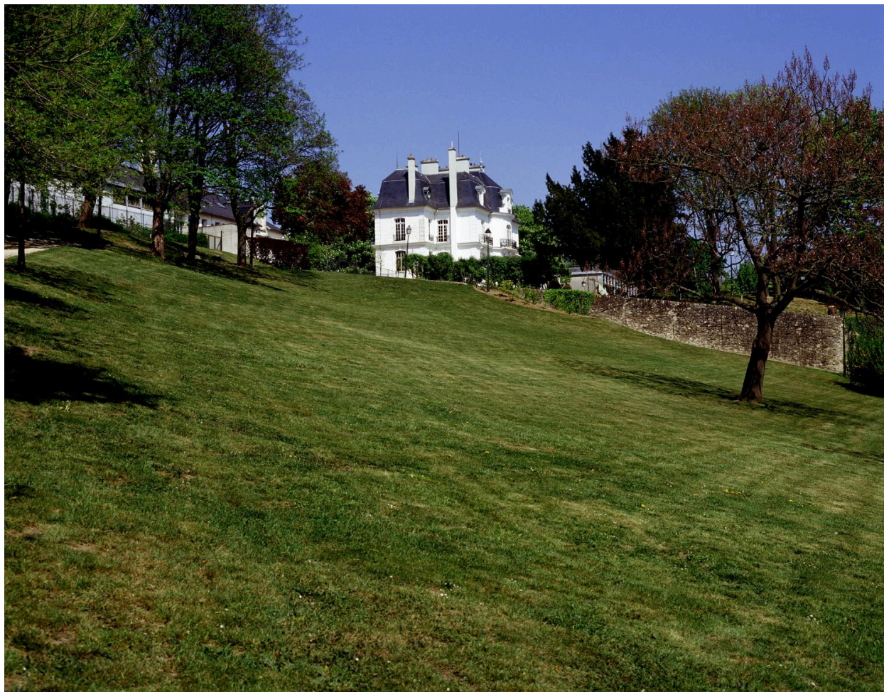
La mairie et la pelouse du parc d'Avaucourt qui descend vers l'avenue Aristide-Briand.