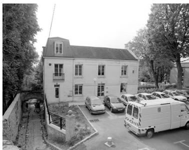
Maison abritant depuis 1981 des services techniques de la mairie ; située au 7, rue de la Montagne d'Athis, elle est reliée au parc du château d'Athis par un petit pont qui date de la période où les deux édifices appartenaient au même propriétaire. IVR11_20029100512X