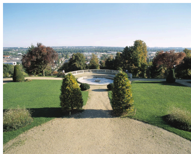
Panorama en direction de la Seine depuis la terrasse de la mairie.