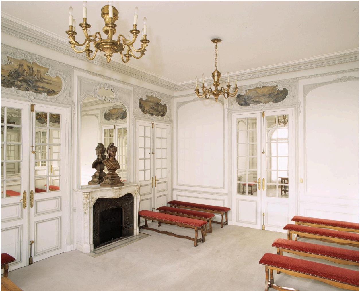
La salle des mariages ; elle est ornée de dessus-de-porte représentant des paysages peints en camaïeu.