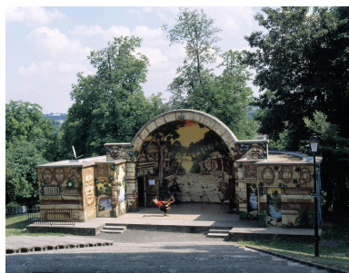
Le théâtre de plein air et ses gradins aménagés dans la pente du terrain. IVR11_20029101020XA