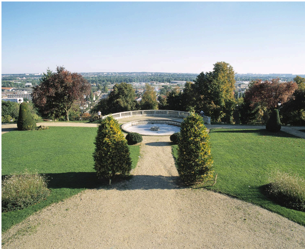
Panorama en direction de la Seine depuis la terrasse de la mairie.