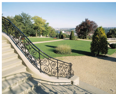
Vue du parc depuis l'escalier de la terrasse. IVR11_20019100571XA