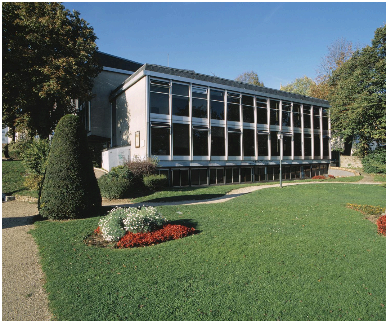
Bâtiment annexe de la mairie construit en 1971 par J. Goldstein.