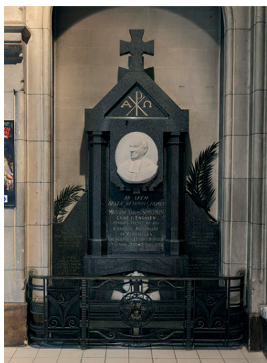
Vue d'ensemble. IVR11_20099500593NUC4A