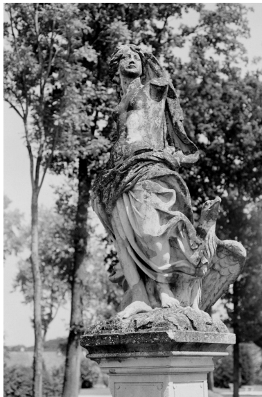
La statue de l'Air, vue de trois-quart gauche.

IVR11_20007800541XA