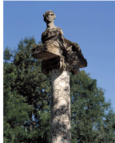
Vue d'ensemble du sphinx et de sa colonne.