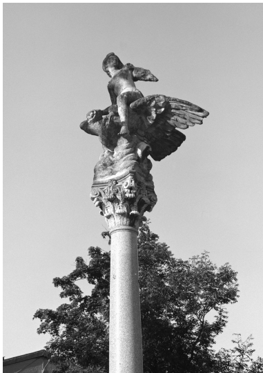
Vue rapprochée de la statue de Hébé. IVR11_20017800019X