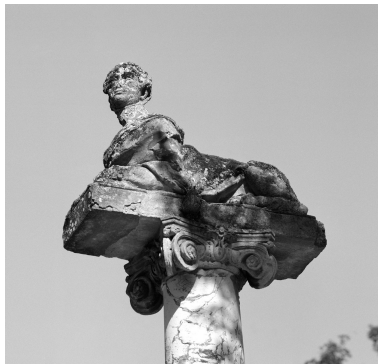
Vue rapprochée du sphinx. IVR11_20017800061X