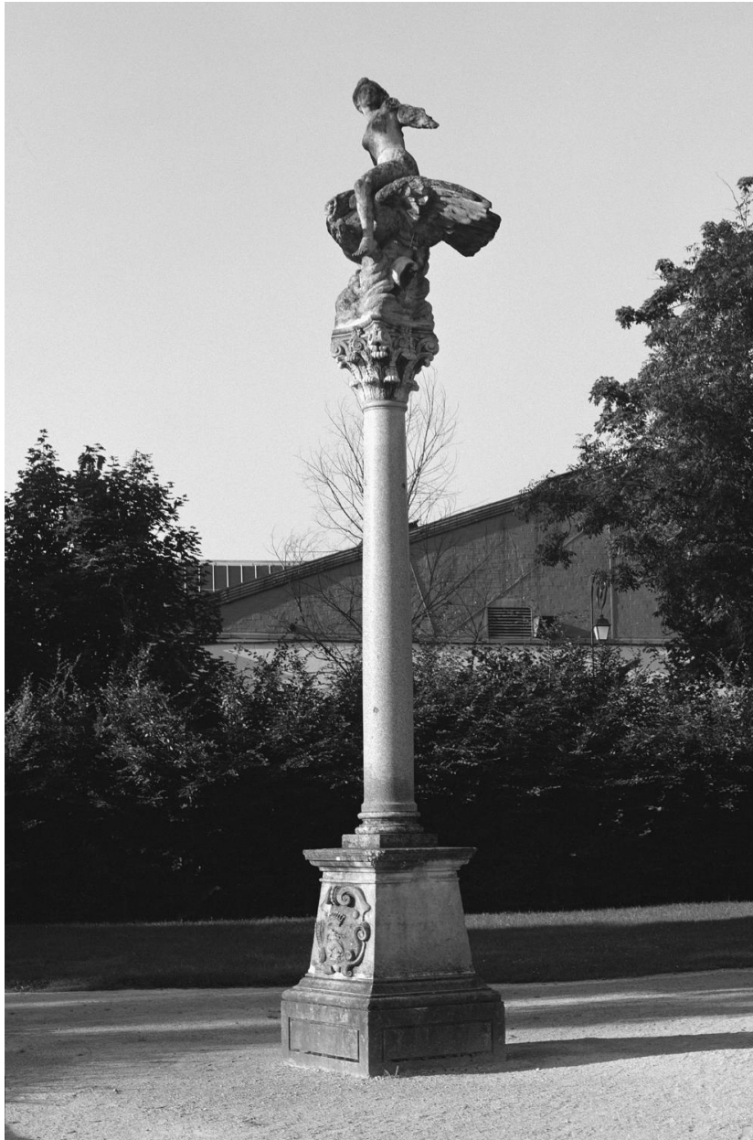
Vue d'ensemble de la statue Hêbé et de sa colonne.