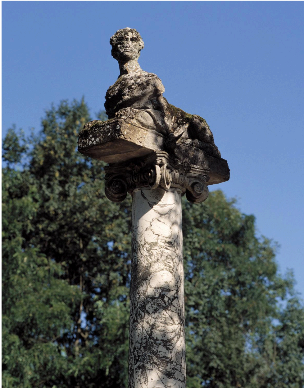
Vue d'ensemble du sphynge et de sa colonne.