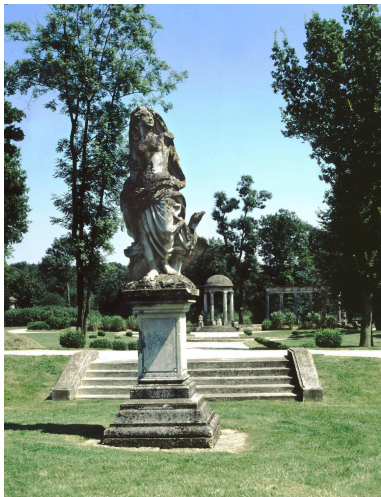
La statue de l'Air, vue de face. A l'arrière plan, le tholos et l'exèdre.

Phot. Christian Décamps IVR11_20007800541XA