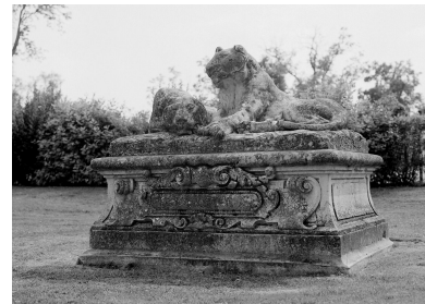
Vue d'ensemble du couple de panthères. IVR11_20007800656X

IVR11_20007800552X