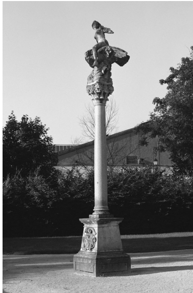
Vue d'ensemble de la statue Hébé et de sa colonne.