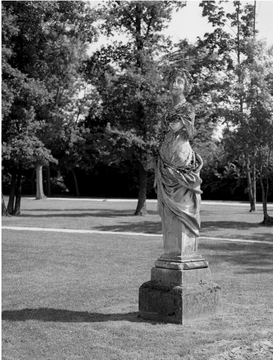
La statue du Printemps, vue de trois-quart gauche.