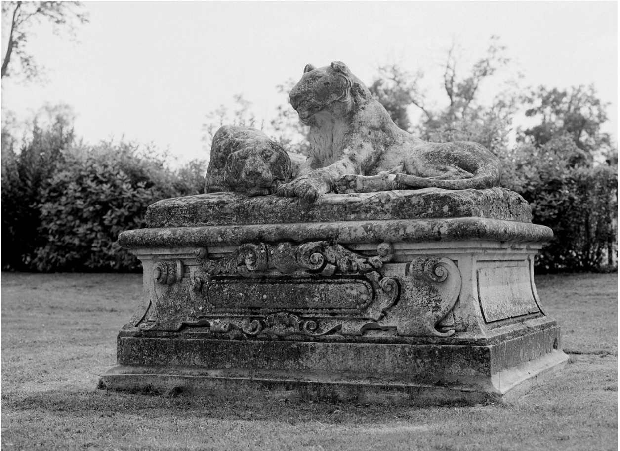
Vue d'ensemble du couple de panthères.