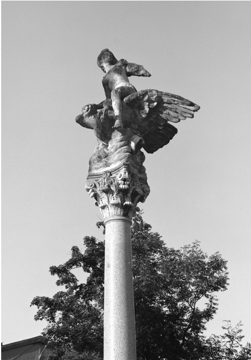
Vue rapprochée de la statue de Hébé.