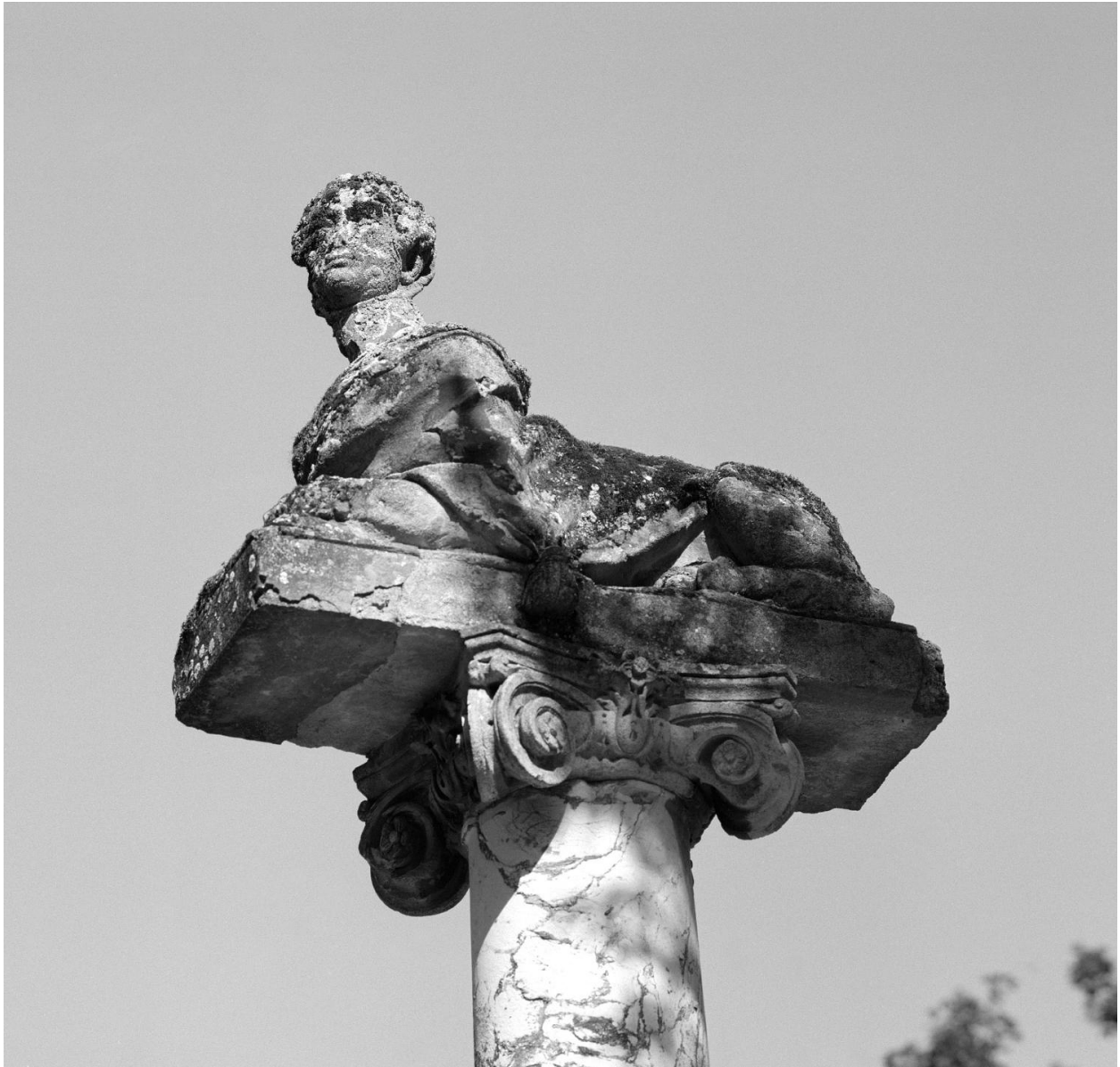
Vue rapprochée du sphynge.