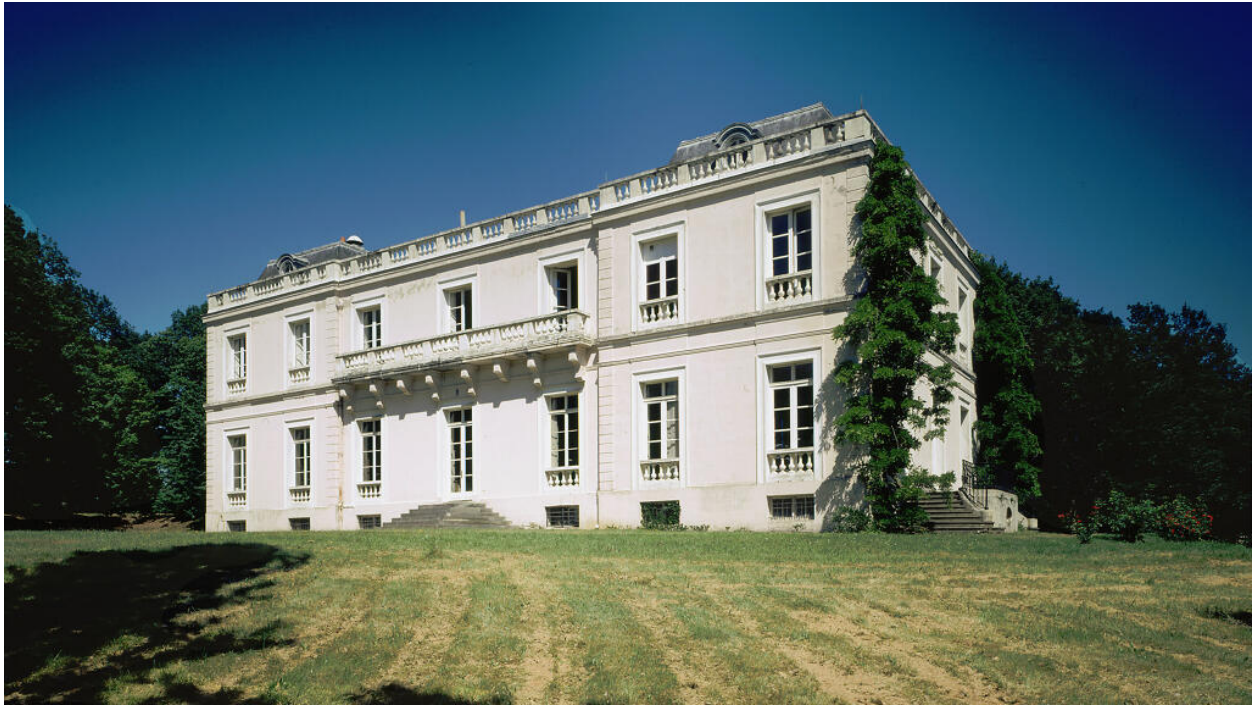
Vue d'ensemble de la façade principale. Maison de notable dite château du Bois du Rocher, actuellement musée de la photographie