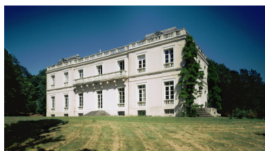
Vue d'ensemble de la façade principale. Maison de notable dite château du Bois du Rocher, actuellement musée de la photographie IVR11_20007800427VA