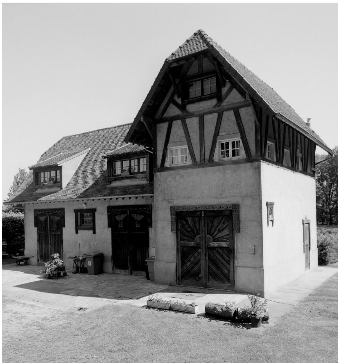
Vue d'ensemble de la maison du gardien construite dans le style norvégien.