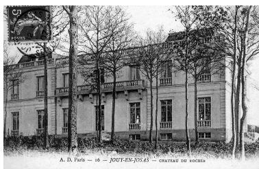
Vue d'ensemble du château. Carte postale. Maison de notable dite château du Bois du Rocher, actuellement musée de la photographie IVR11_20007800221NUC