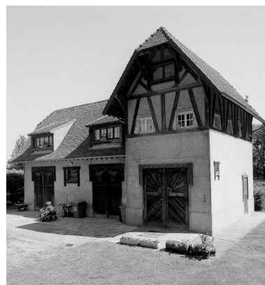
Vue d'ensemble de la maison du gardien construite dans le style norvégien.