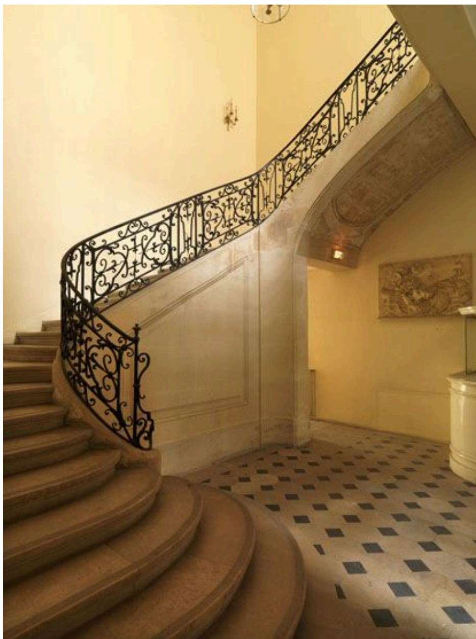
Vue d'ensemble de l'escalier.