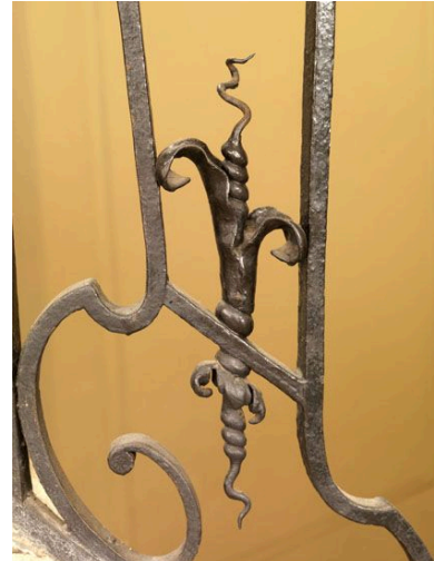
Détail d'un pilastre : une queue de cochon émergeant d'un fleuron. IVR11_20107500293NUC4A