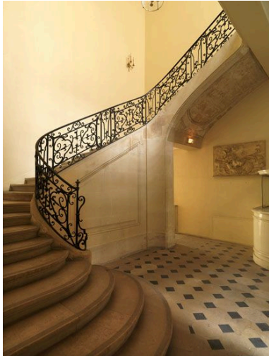
Vue d'ensemble de l'escalier. IVR11_20107500290NUC4A