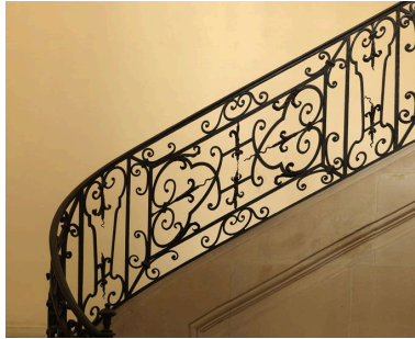
Détail d'un panneau rampant.