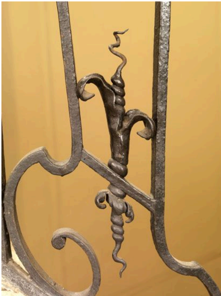
Détail d'un pilastre : une queue de cochon émergeant d'un fleuron.