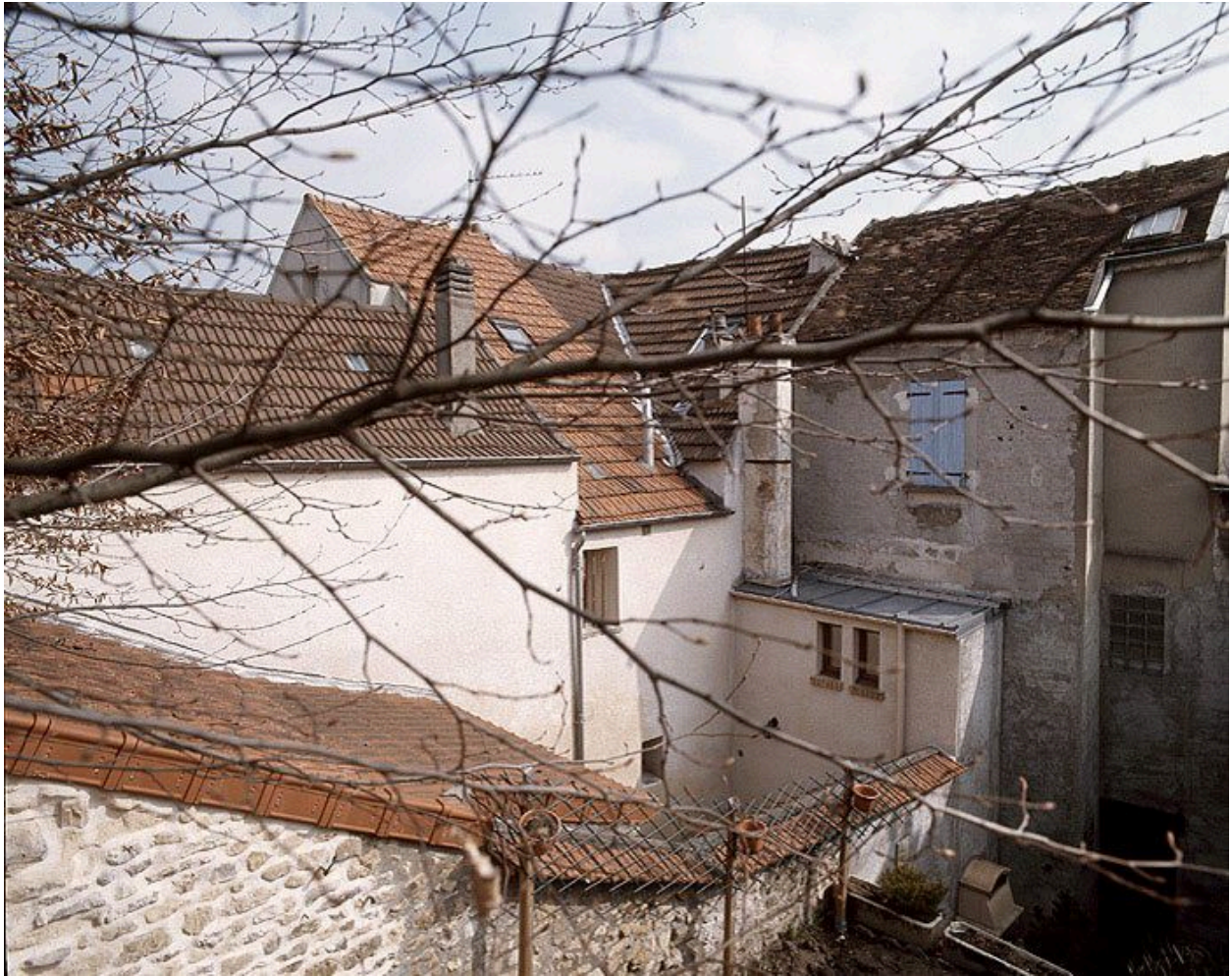
Vue d'ensemble du mur ouest de l'aile en retour.