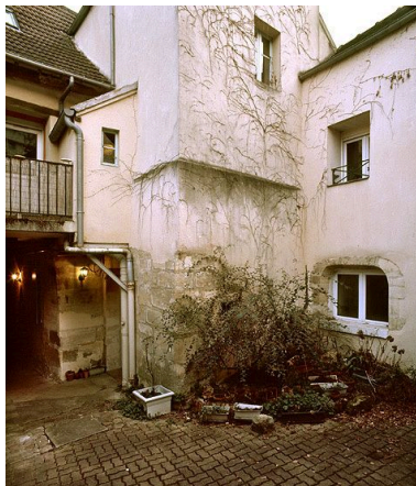
Vue d'ensemble de la cour arrière.