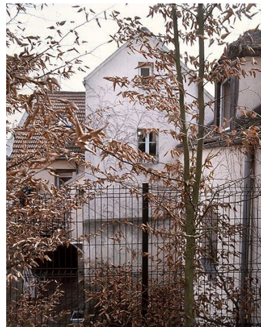
Façade arrière de la tour de l'escalier. IVR11_20067800308XA