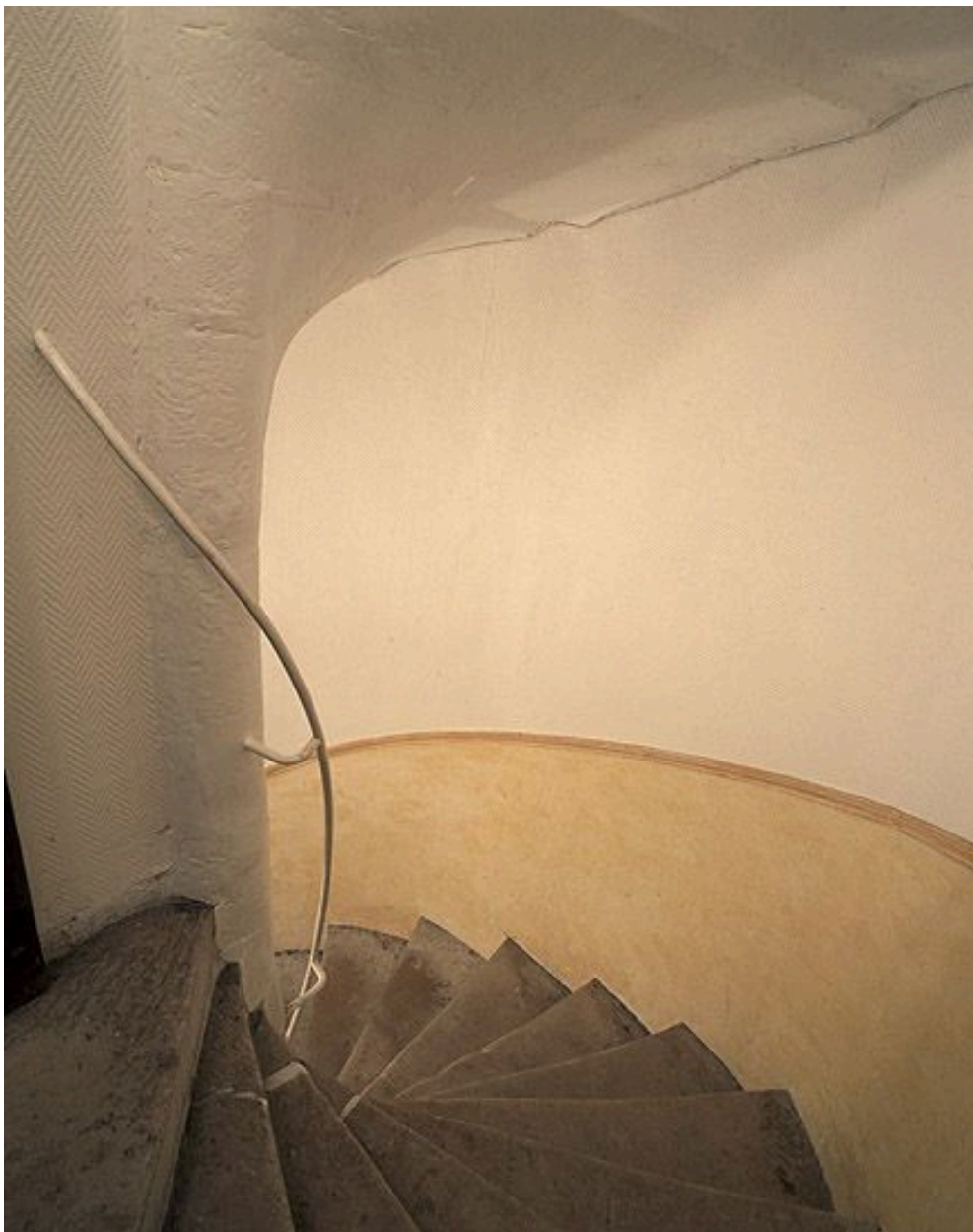
L'escalier en vis.