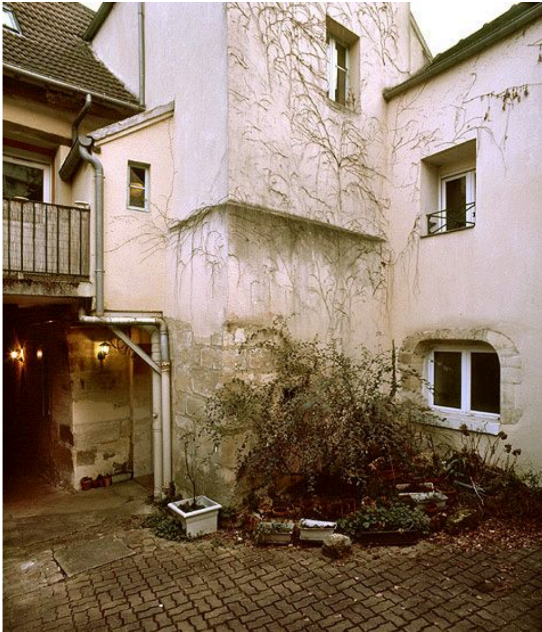
Vue d'ensemble de la cour arrière.