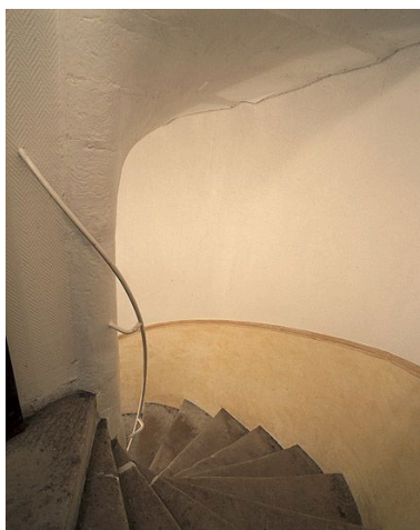
L'escalier en vis.