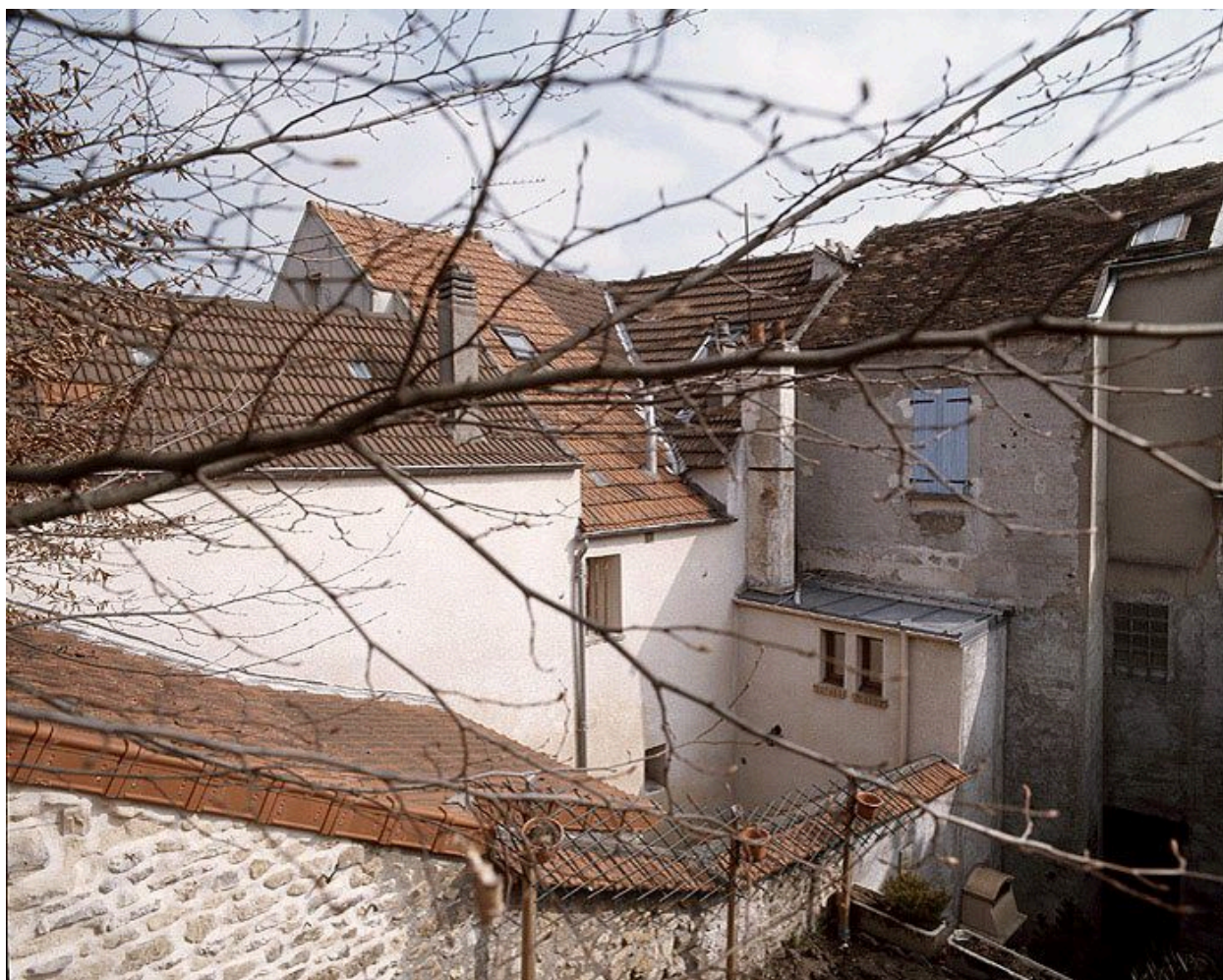
Vue d'ensemble du mur ouest de l'aile en retour.