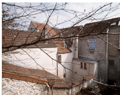
Vue d'ensemble du mur ouest de l'aile en retour.