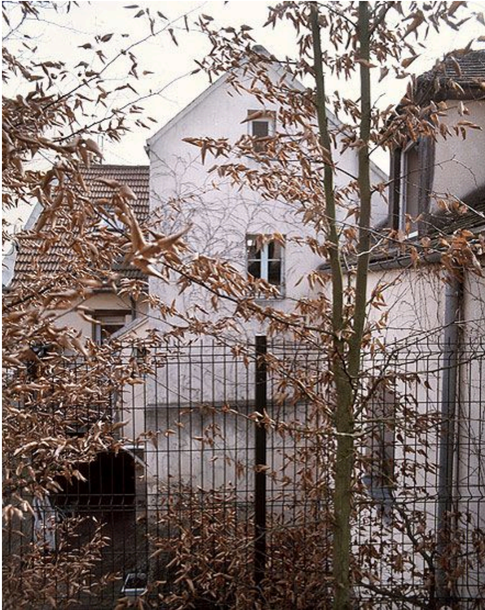
Façade arrière de la tour de l'escalier.