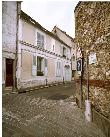
La façade sur rue.