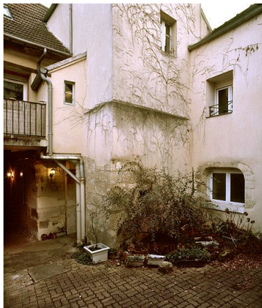
Vue d'ensemble de la cour arrière. IVR11_20067800306XA