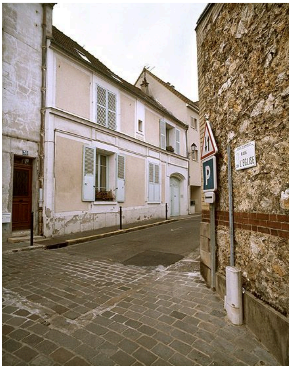
La façade sur rue.