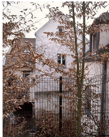
Façade arrière de la tour de l'escalier. IVR11_20067800308XA