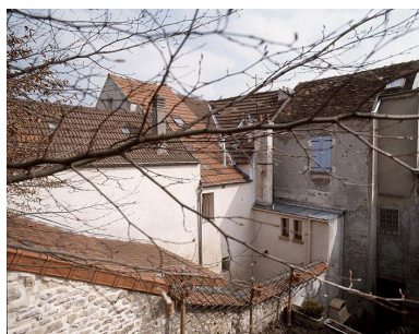
Vue d'ensemble du mur ouest de l'aile en retour.