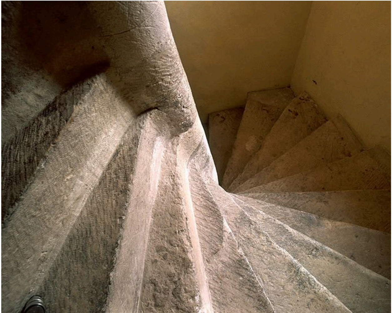
L'escalier en vis : détail des marches et du noyau central.