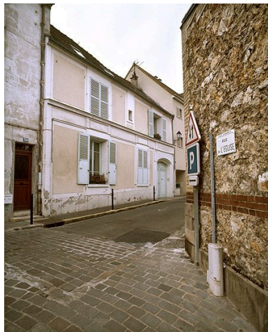
La façade sur rue. IVR11_20067800208XA