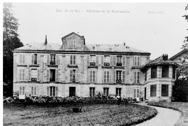
Vue de la façade sur jardin. IVR11_20007800073XB