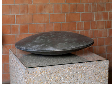
Les fonts baptismaux fermés sur leur socle d'origine dans la chapelle de la semaine. Ces fonts qui ne sont plus utilisés, sont conservés dans les réserves de l'église.