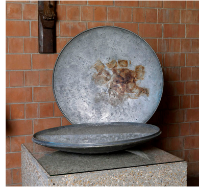
Les fonts baptismaux ouverts sur leur socle d'origine dans la chapelle de la semaine. Ces fonts qui ne sont plus utilisés, sont conservés dans les réserves de l'église. Le couvercle de la cuve baptismale est dégradé par le feu.