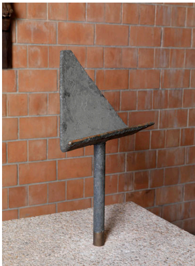
Pupitre de l'autel originel. Il est aujourd'hui conservé dans les réserves de l'église.