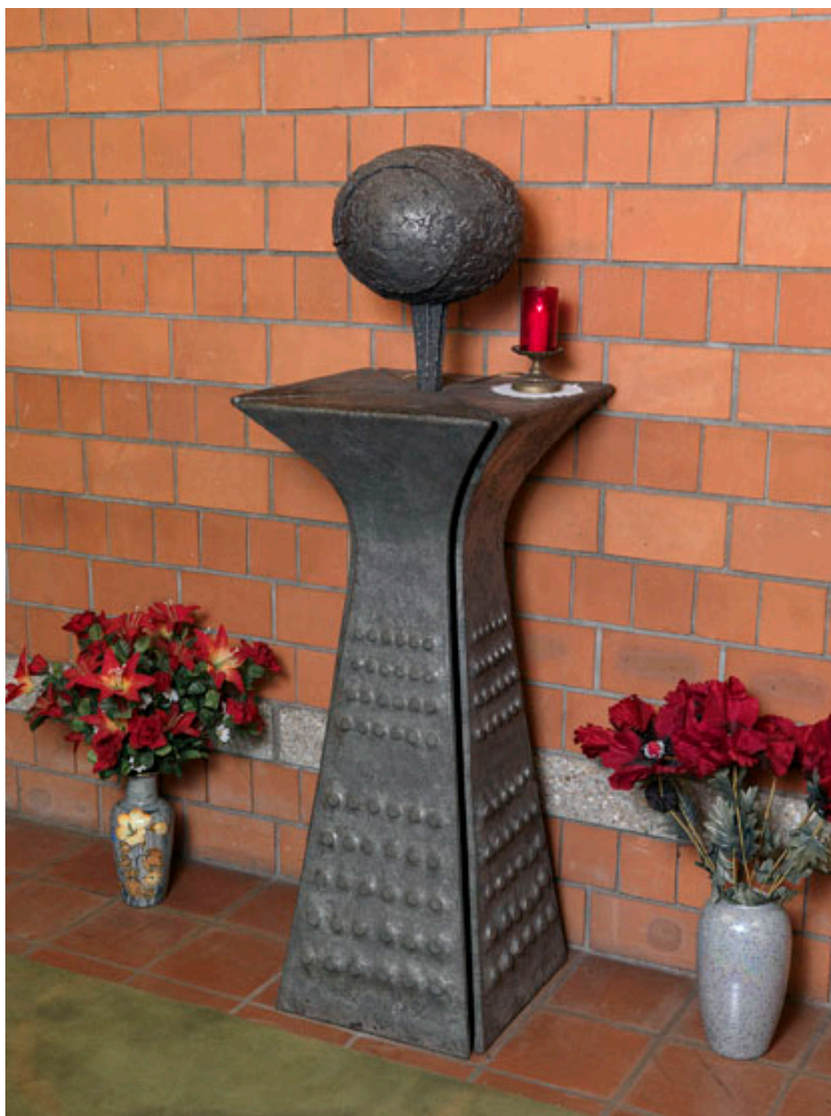
Vue générale du tabernacle.